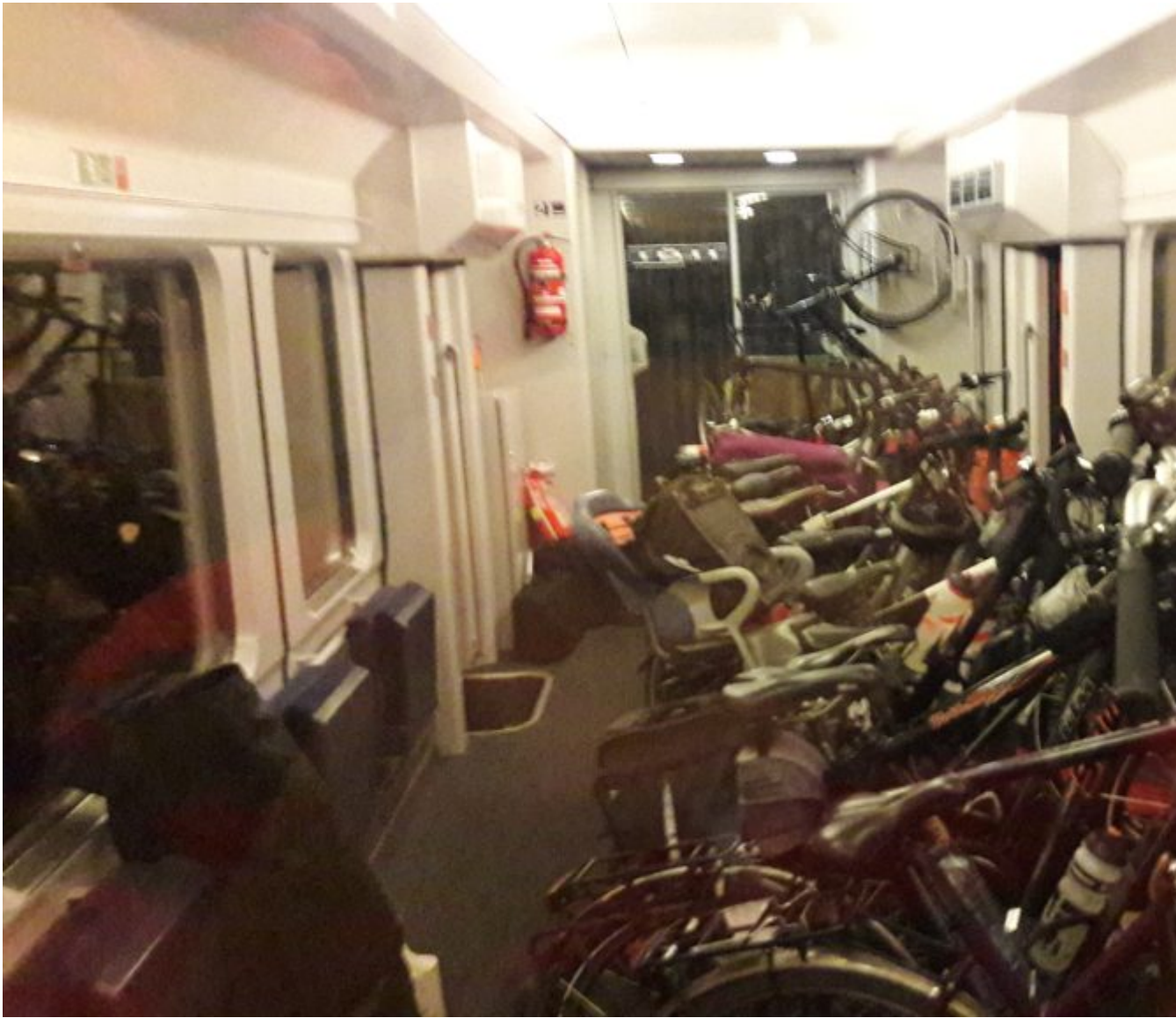
Wel heel veel fietsen