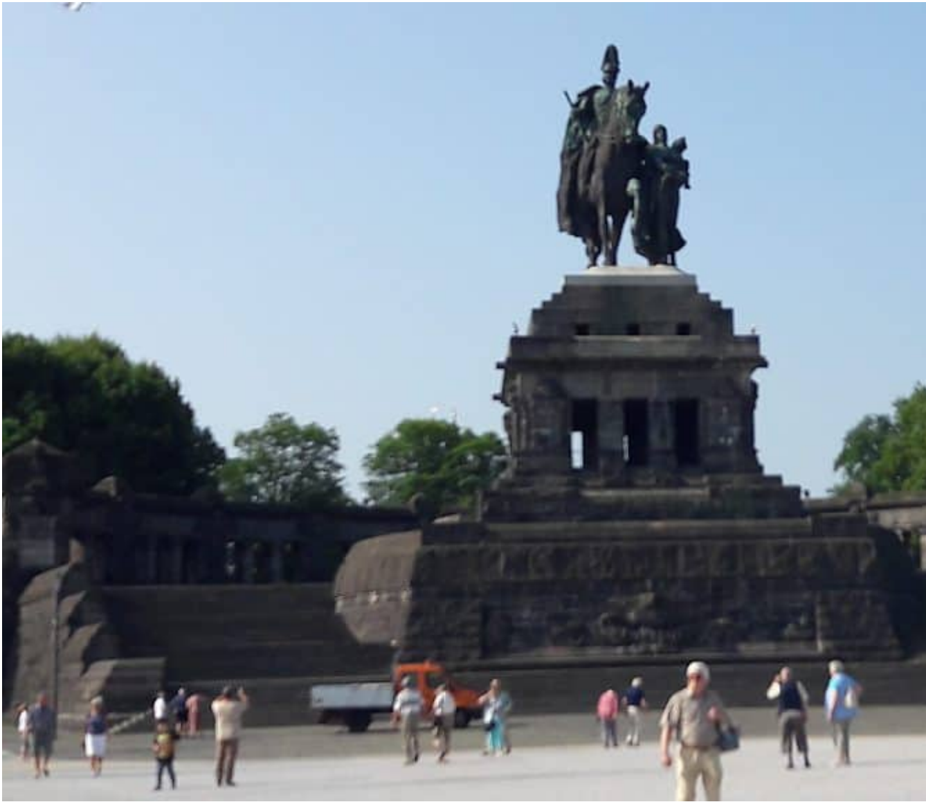
Deutsches Eck bij Koblenz waar Moezel in de Rijn komt