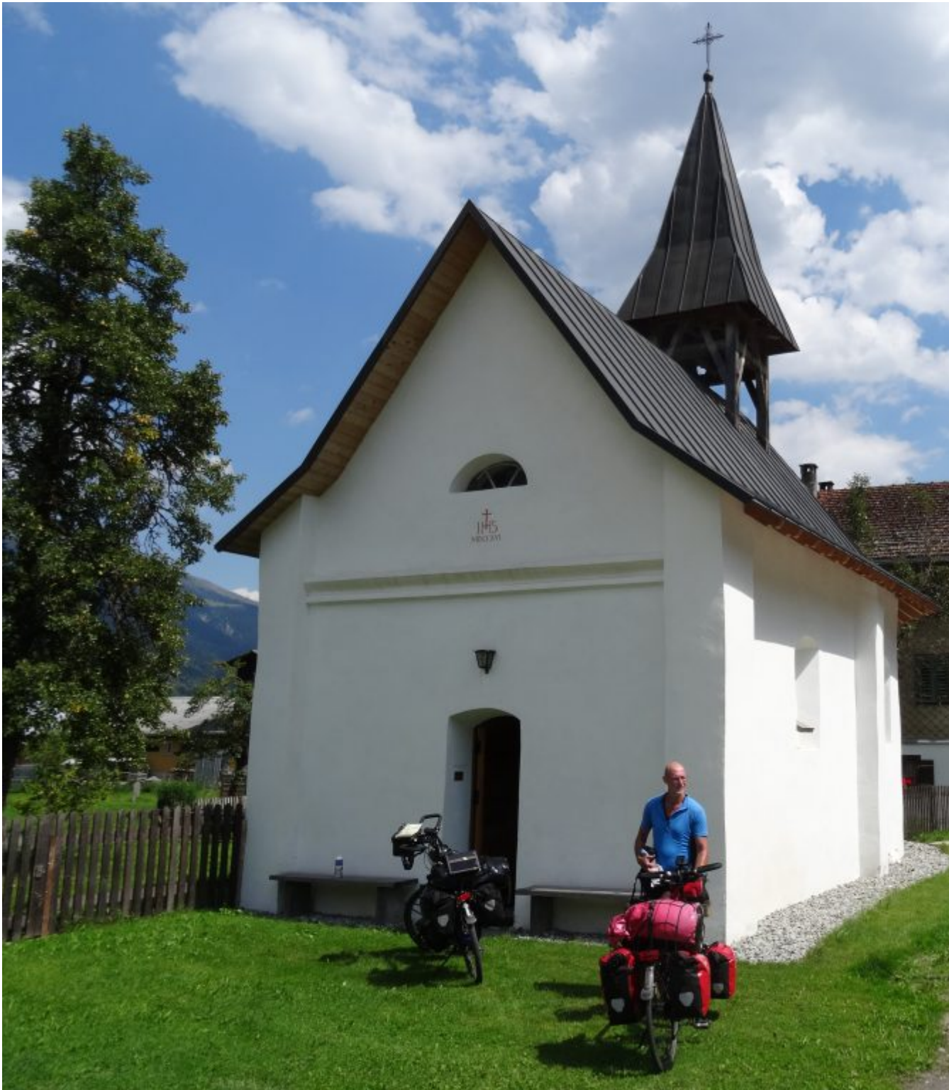
Kapelletje St. Antonius von Padua in Surrein