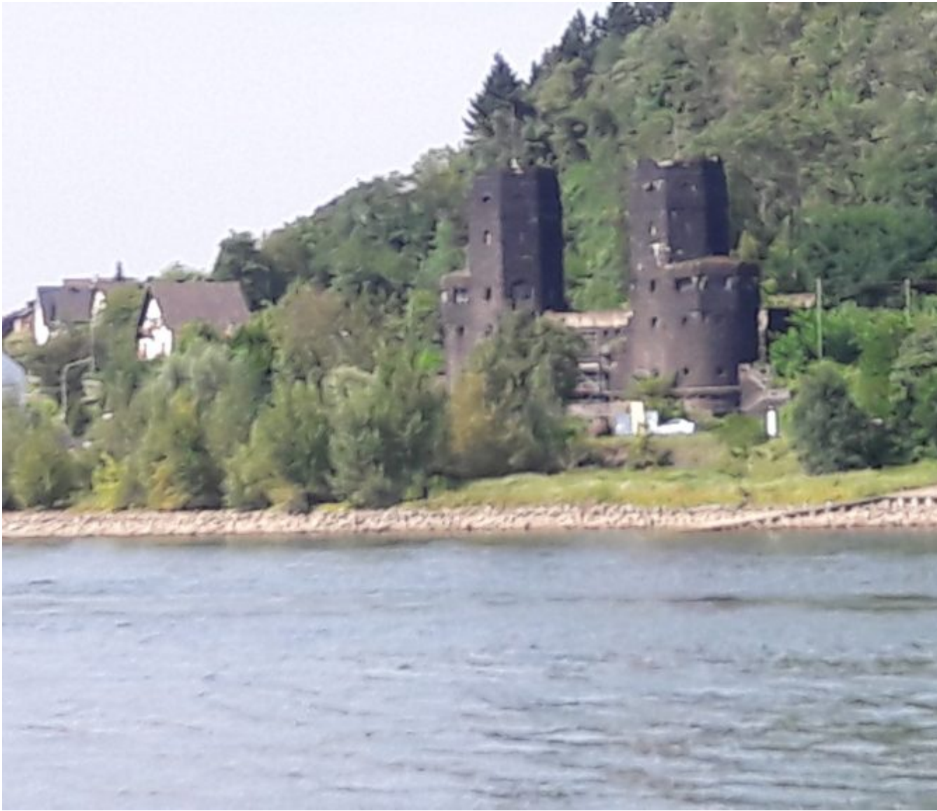
Resten van de brug bij Remagen