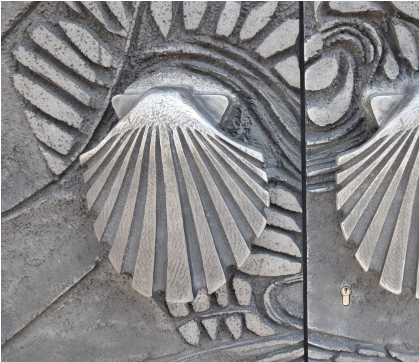
Handvaten in de vorm van een Jacobsschelp