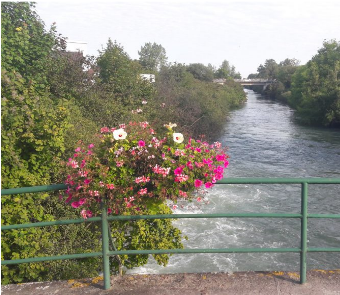
Canal de Hunique