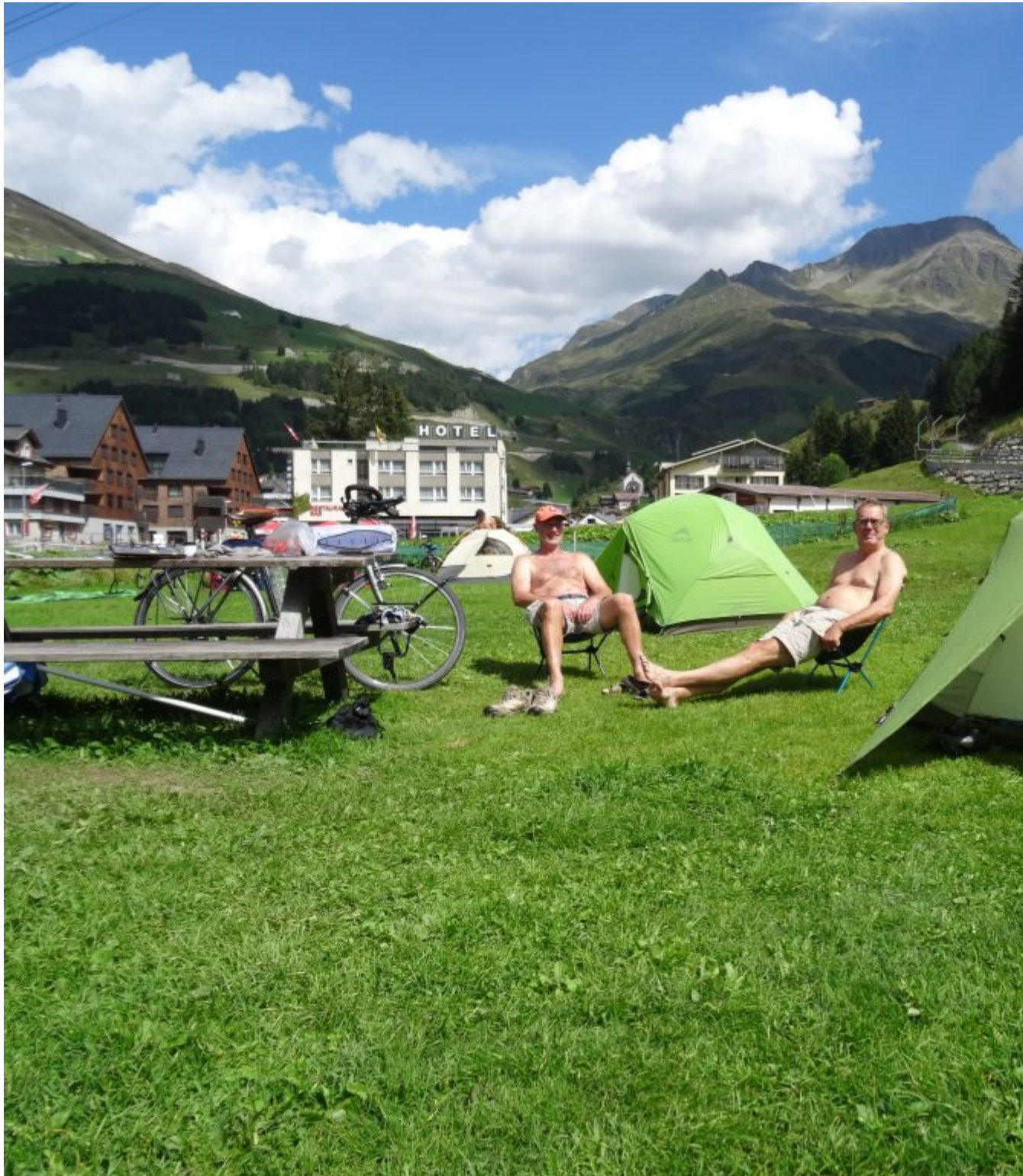
Het zonnetje schijnt nog op de eerste camping Gotthard in Andermatt