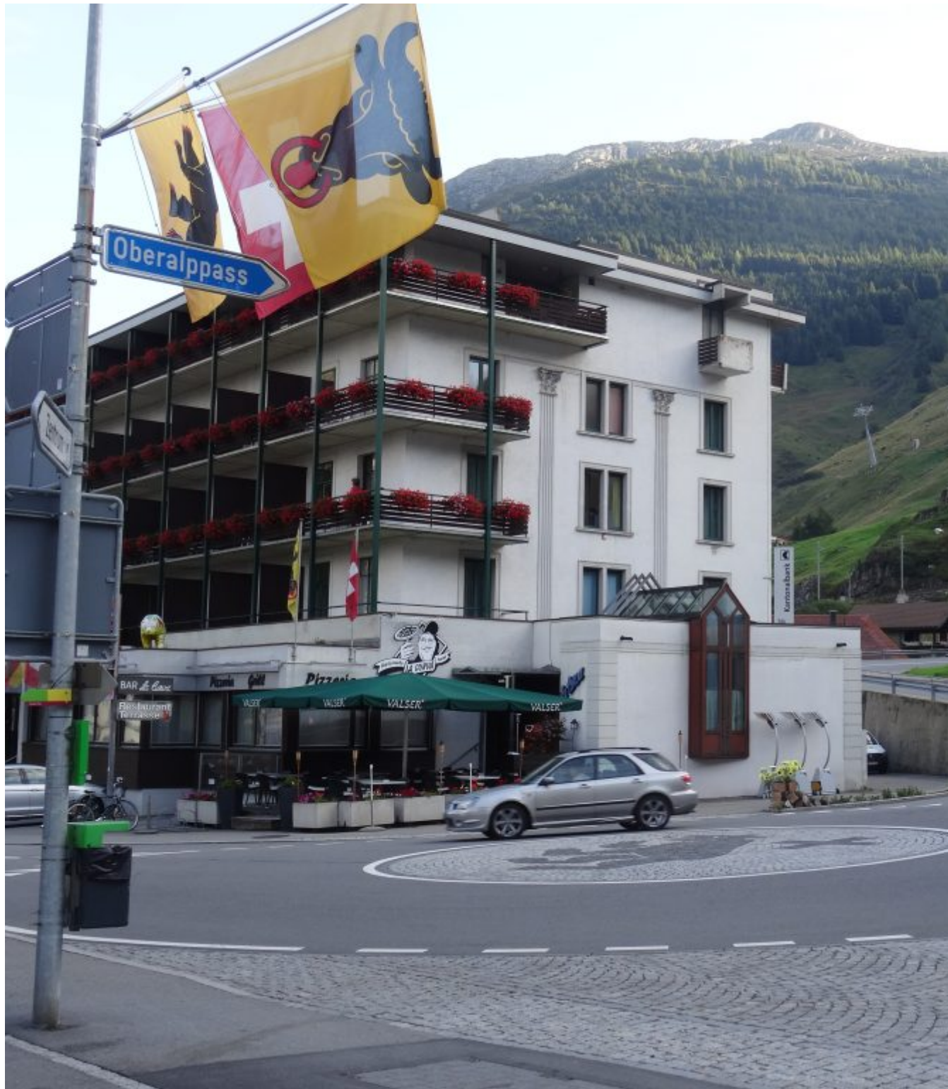
De start van de beklimming