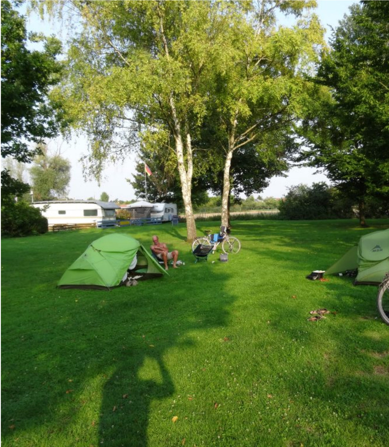
Camping Riedsee in Leeheim