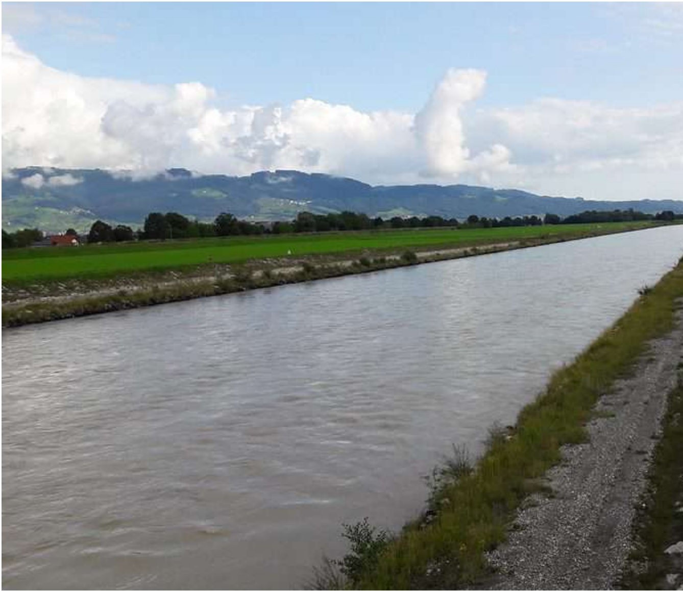
De gekanaliseerde Rijn voor het Bodenmeer