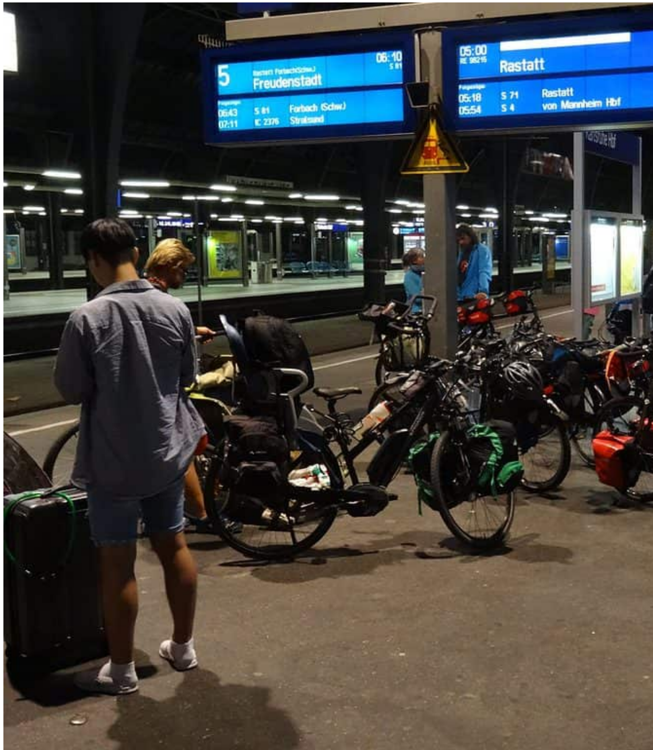
Nog een niet verwachte overstap