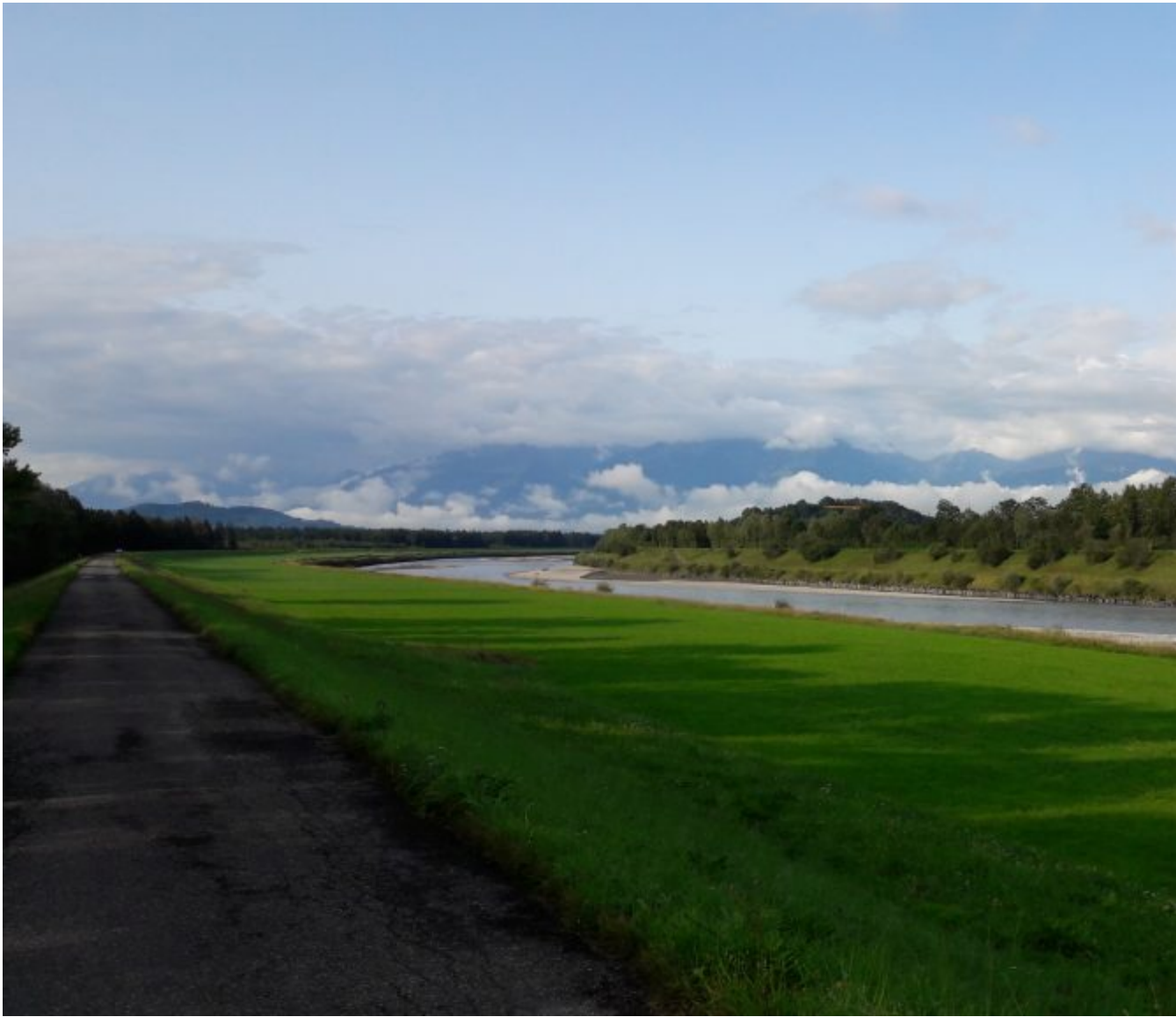
De gekanaliseerde Rijn voor het Bodenmeer