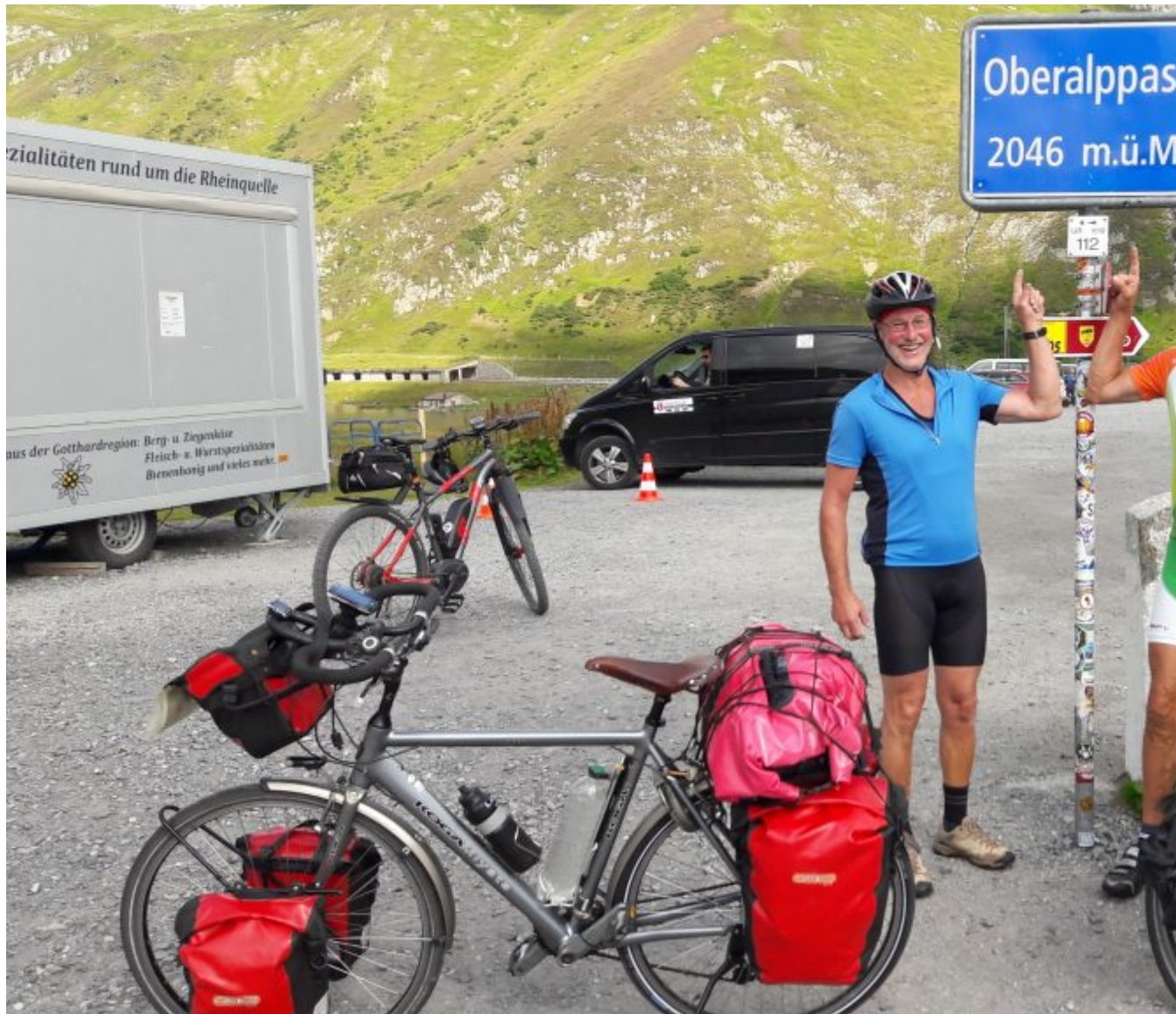
Zo hoog zijn we nog nooit geweest