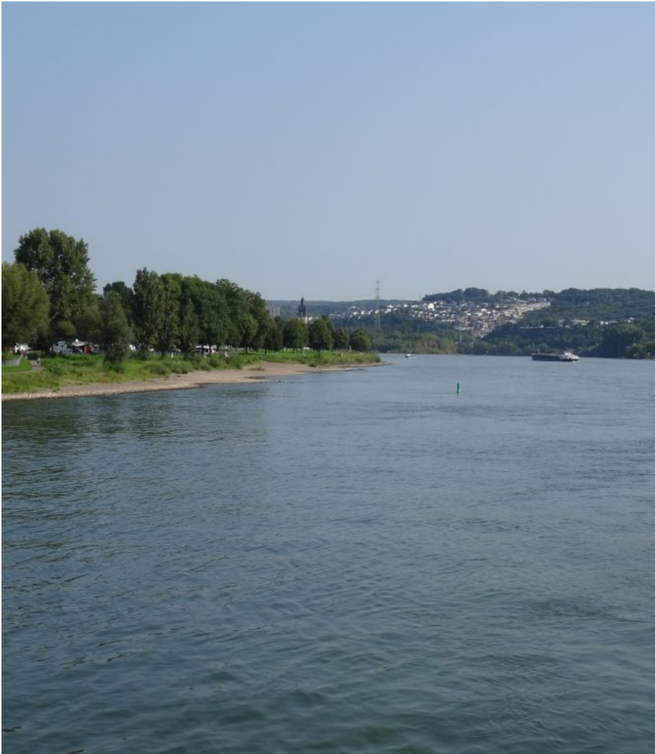
De Rijn van rechts en de Moezel van links