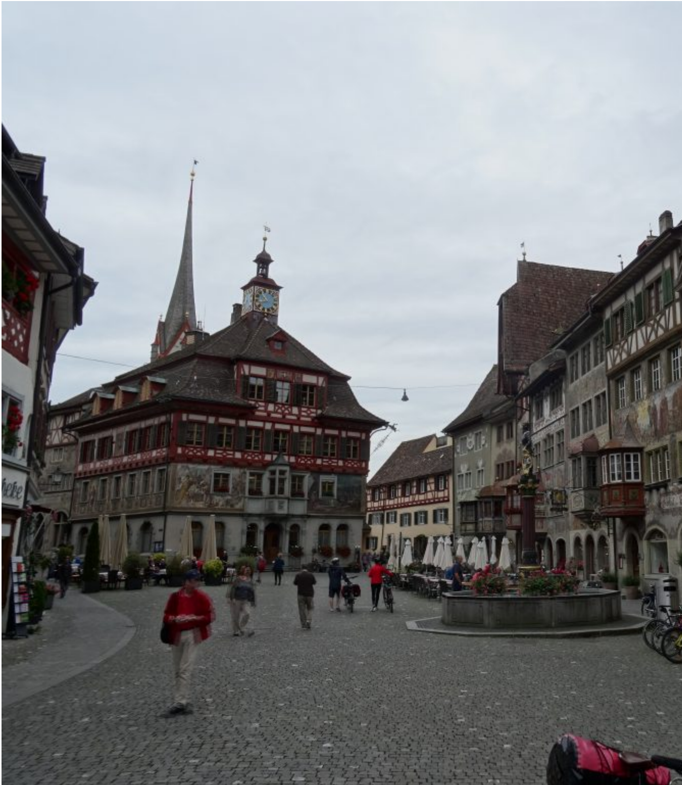
Stein am Rhein