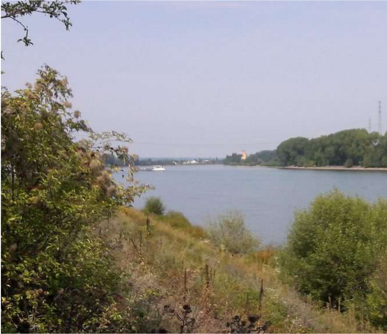
De steeds bredere Rijn in Worms