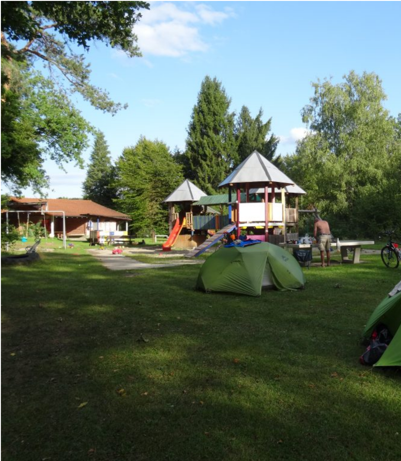
Camping Herdern in Herdern