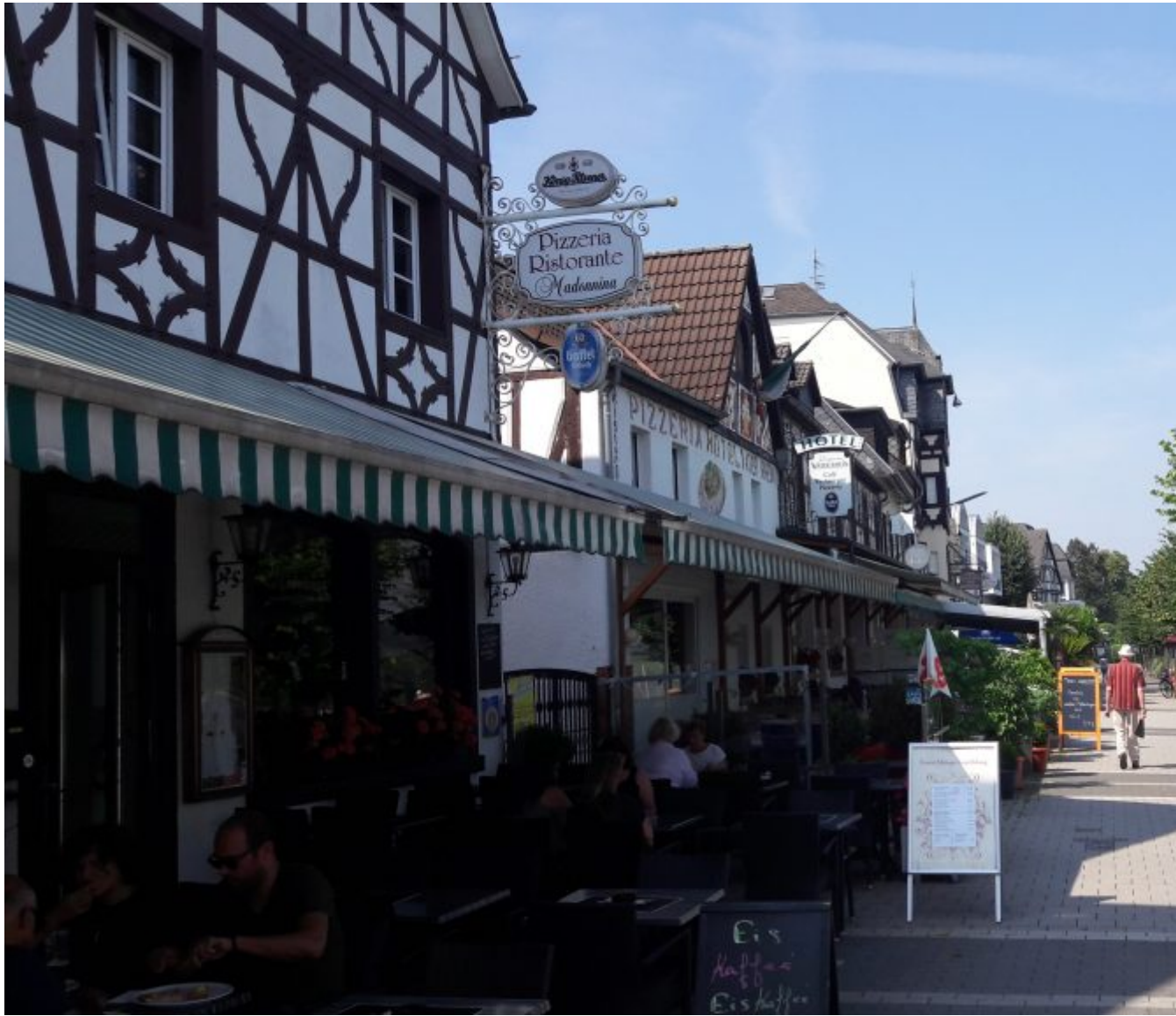
Rijnboulevard in Bad Breisig