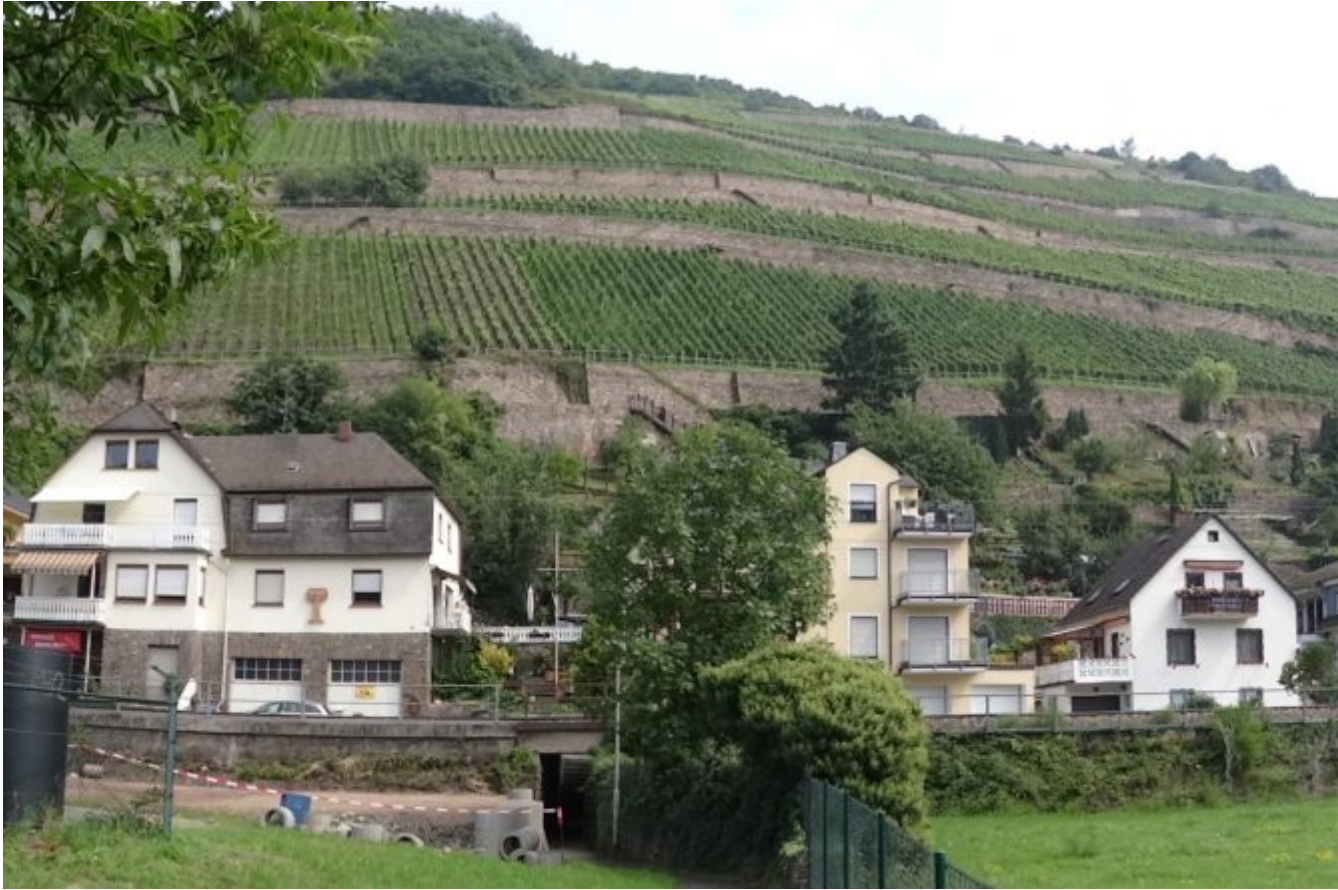
De wijnvelden van de Rijn