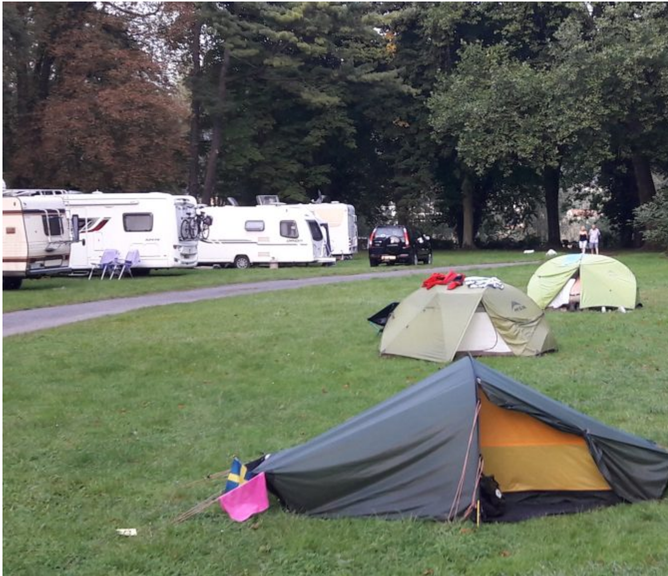
Camping Genienau in Mehlem (Bonn)