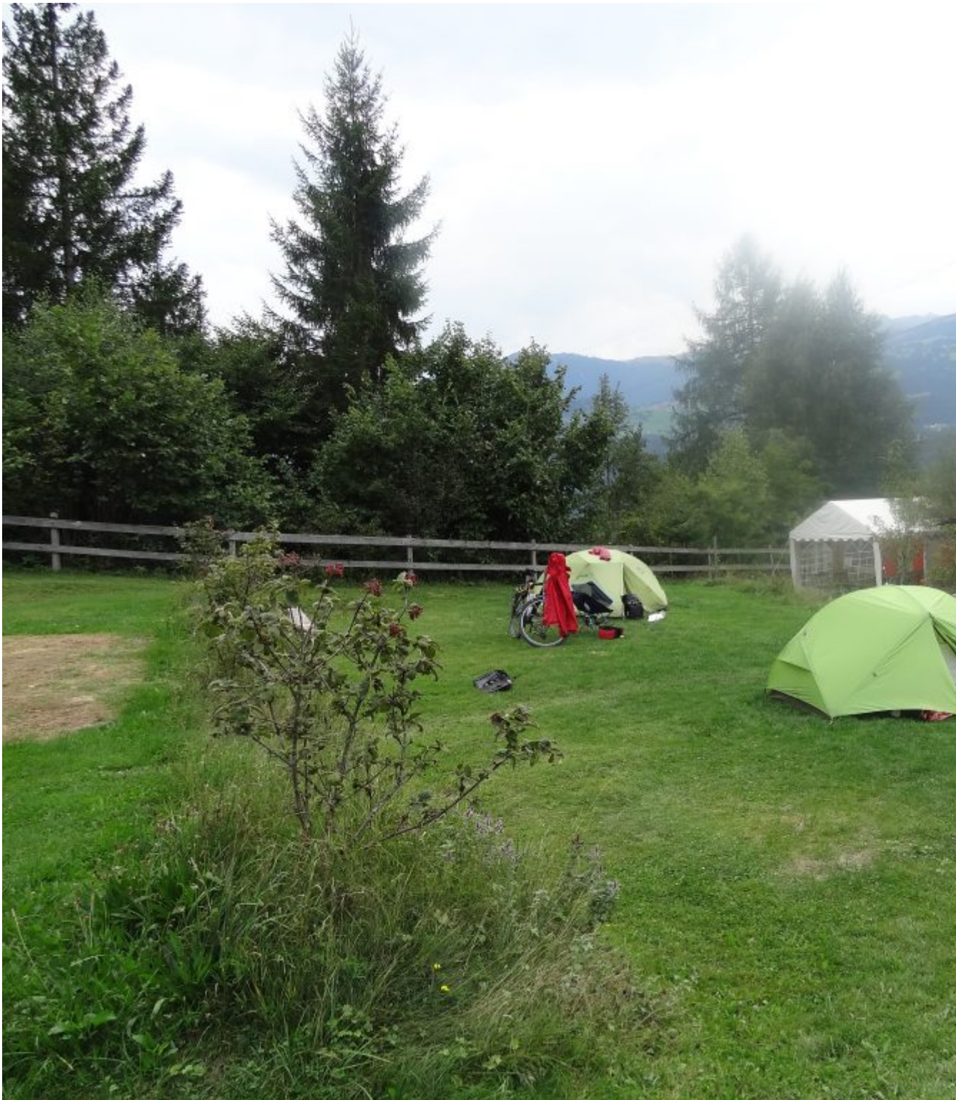
Camping Carrera bij Carrera

Het hoofdaltaar uit 1679 in een hoog barokke stijl