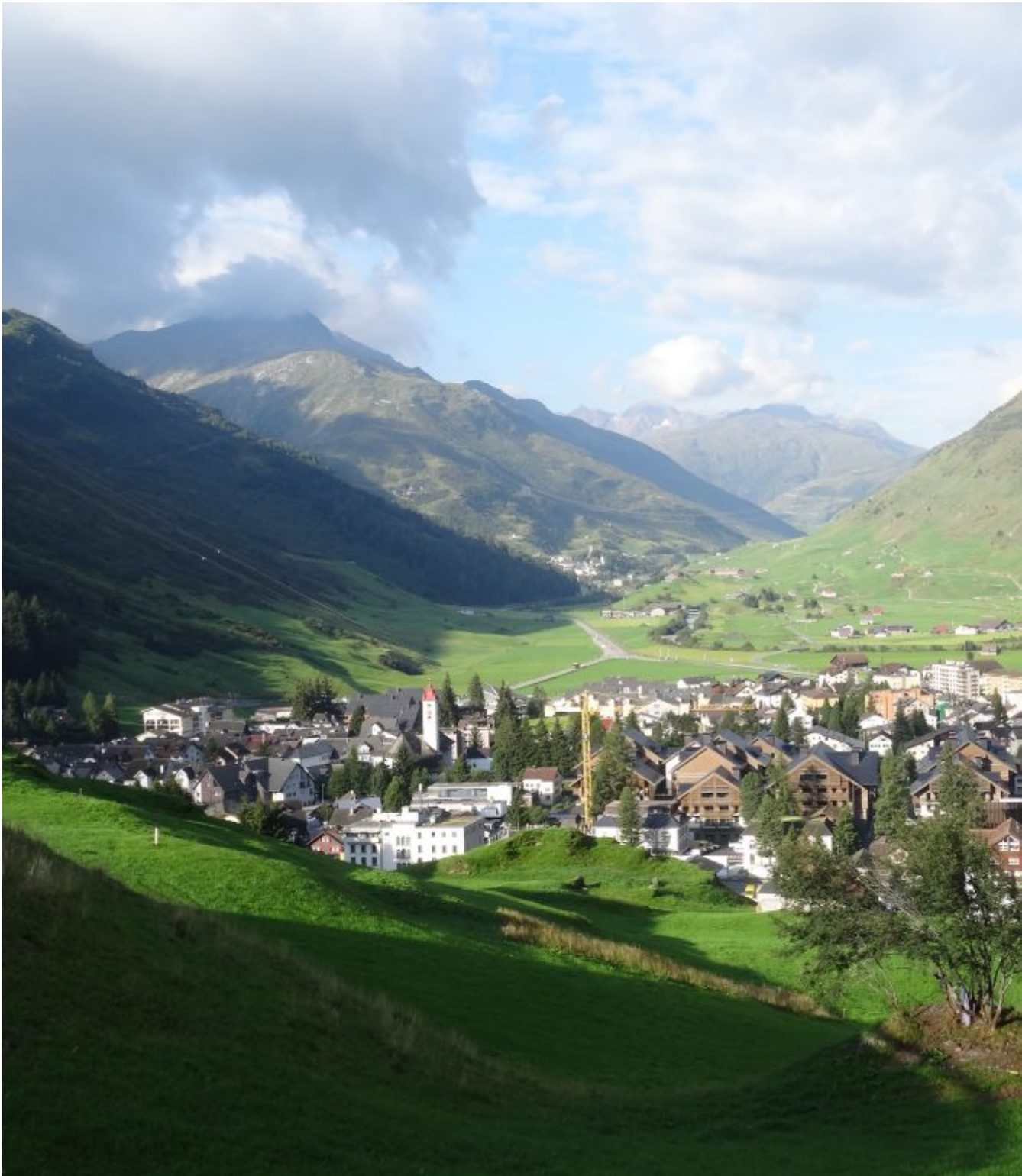
Terugblik op Andermatt