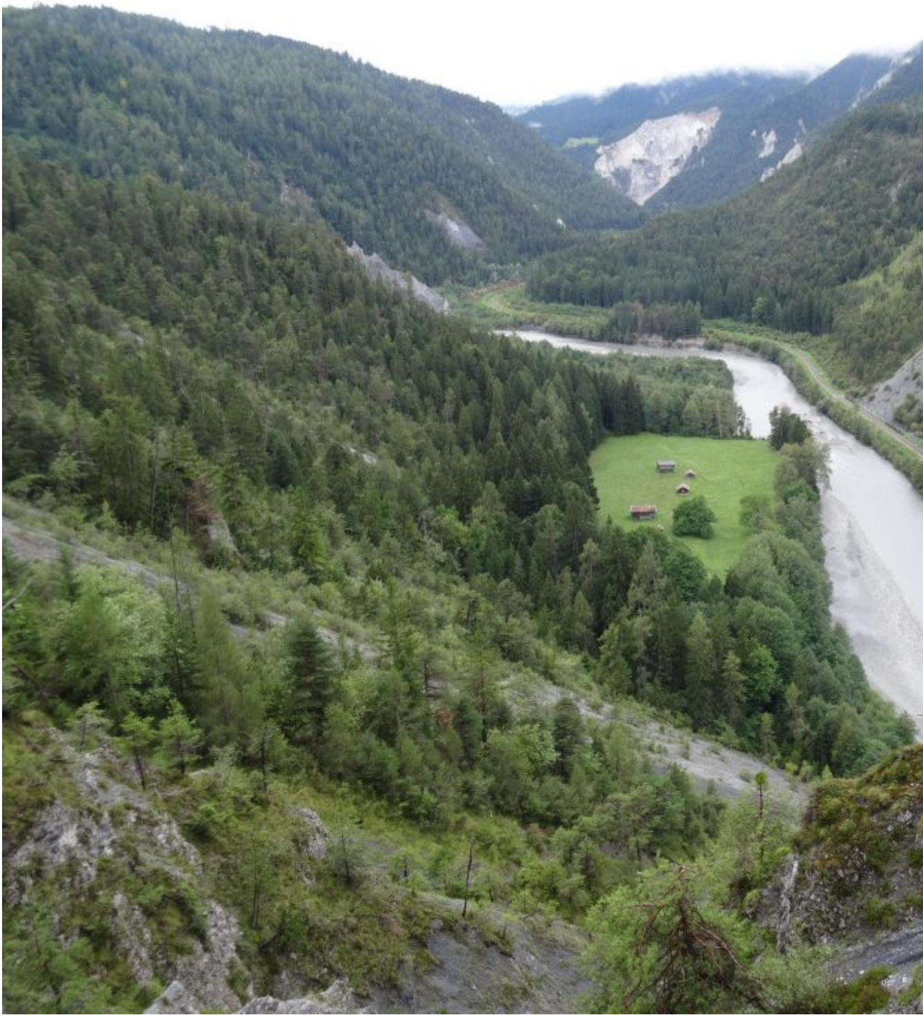
De Rijn weer in zicht in een diep dal