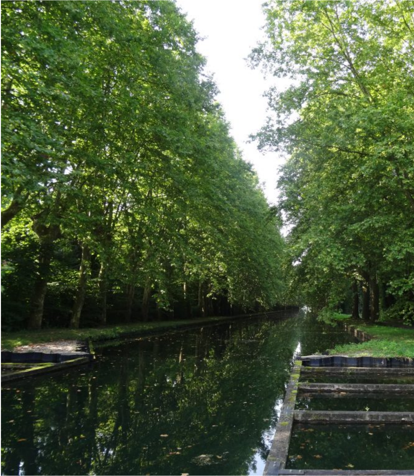
Canal du Rhone au Rhin