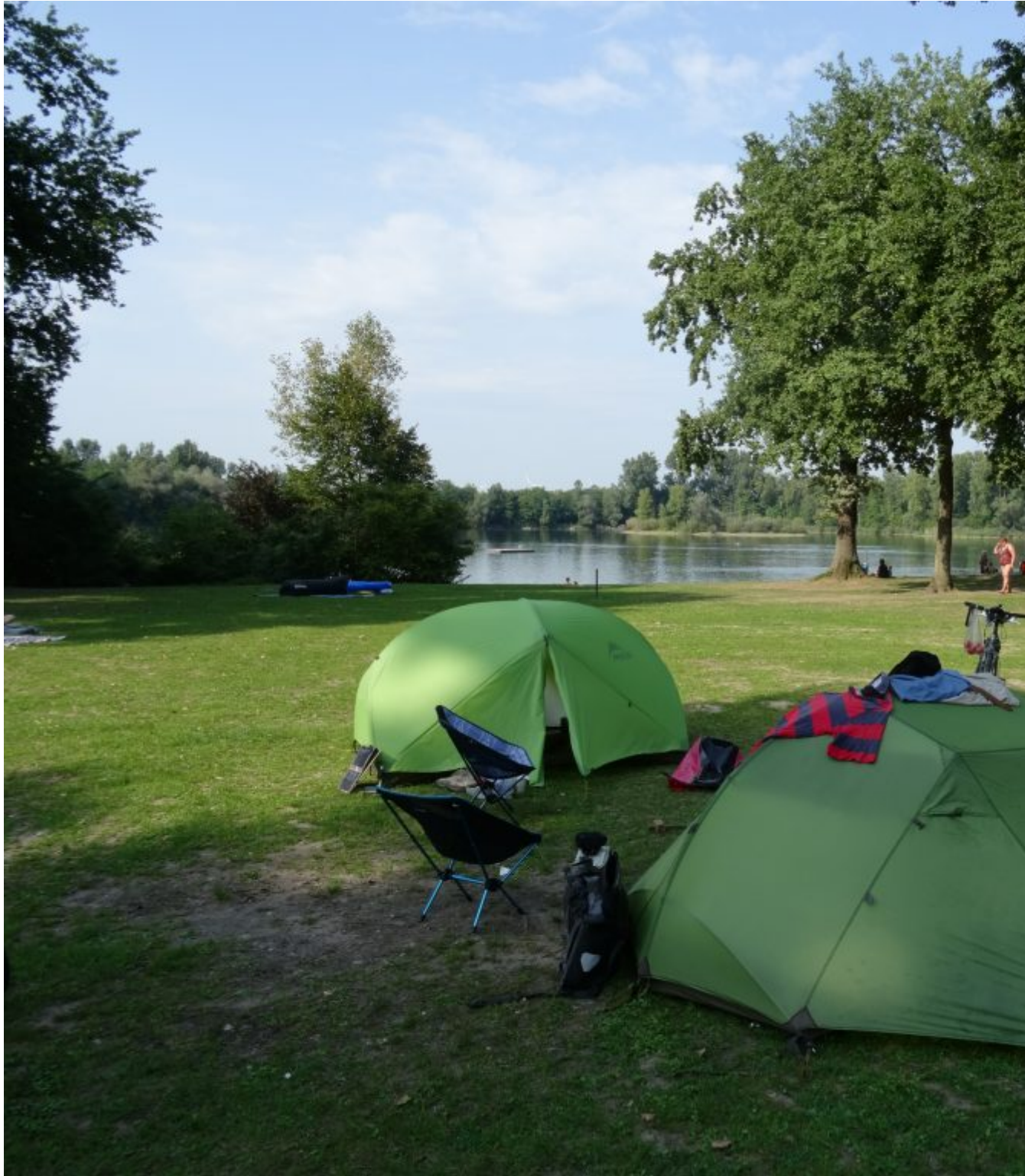
Camping Haus am See in Lingefeld

Zaterdag 26 augustus. Soms zit het mee en soms tegen