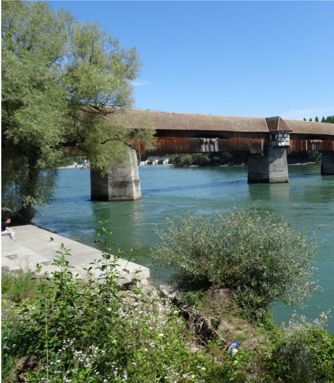
Historische houten grensbrug bad Säckingen