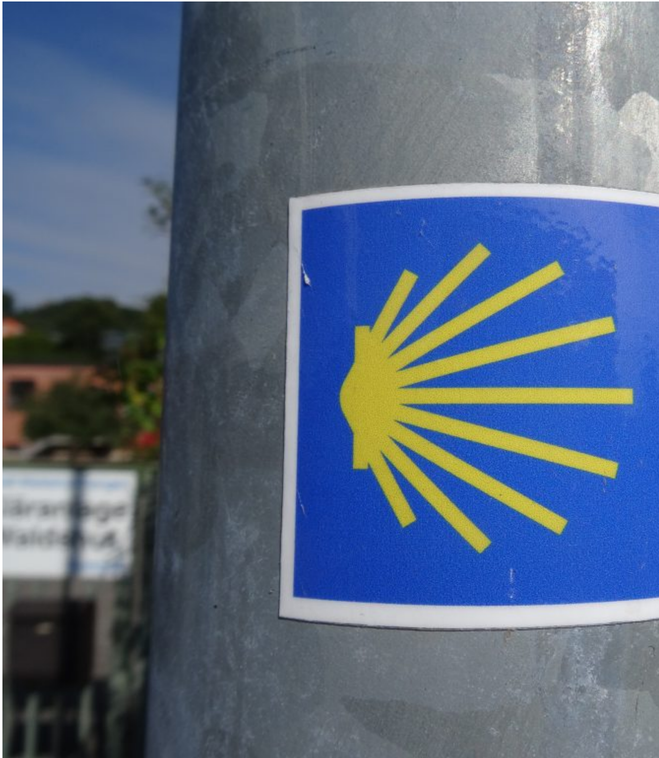
Waldshut-Tiengen routeschelp naar Santiago de Compostela