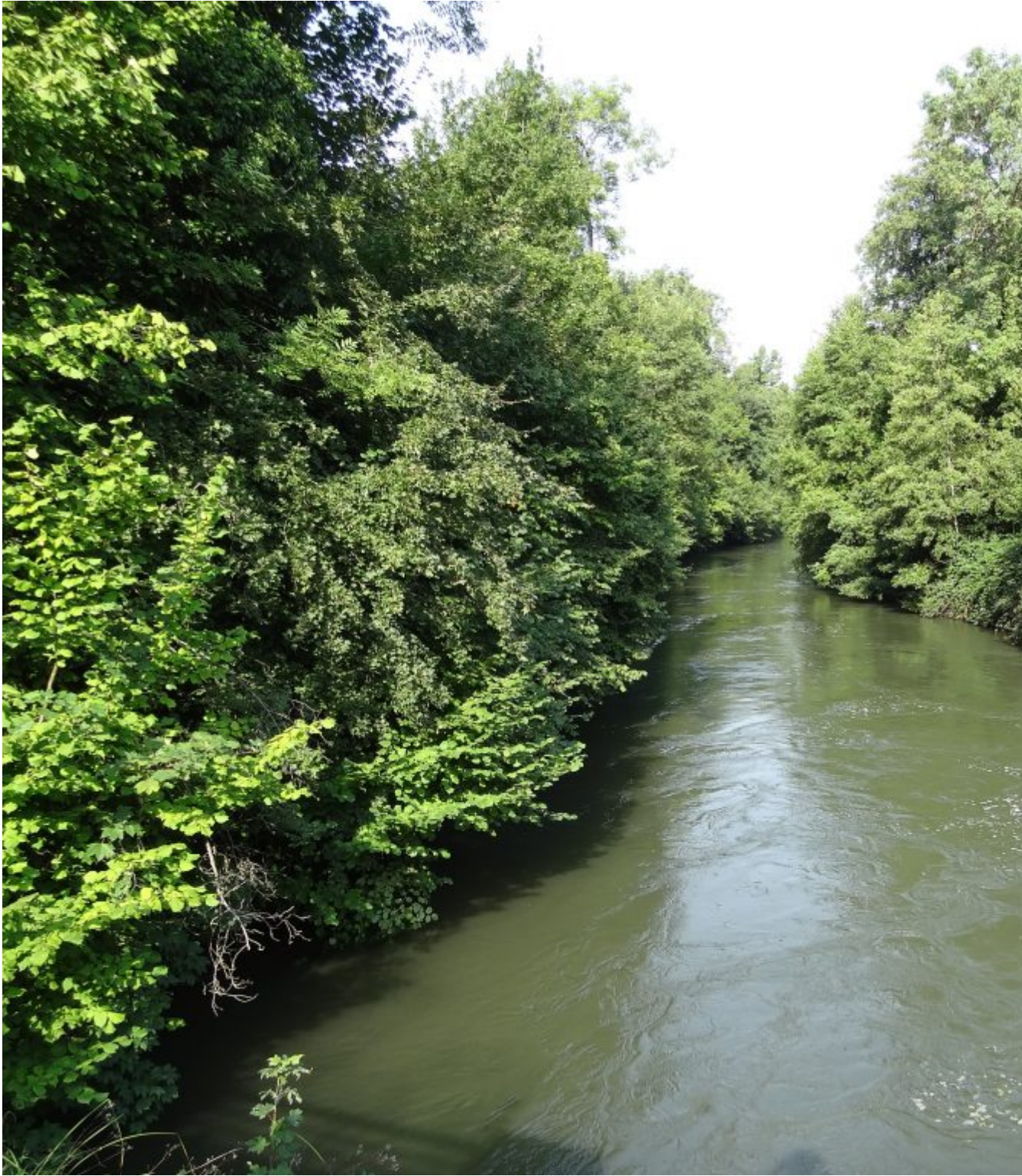
Een stukje oude Rijn