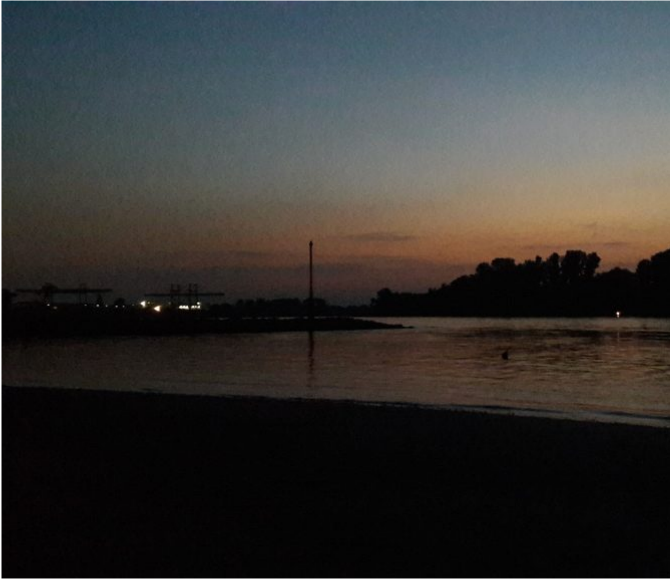
De Rijn by Night