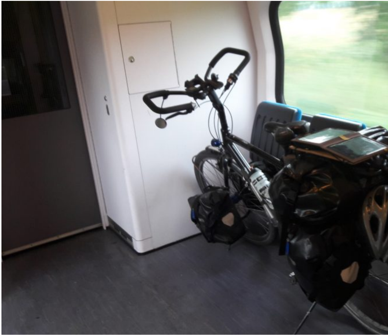
De fiets alleen in een Nederlandse trein