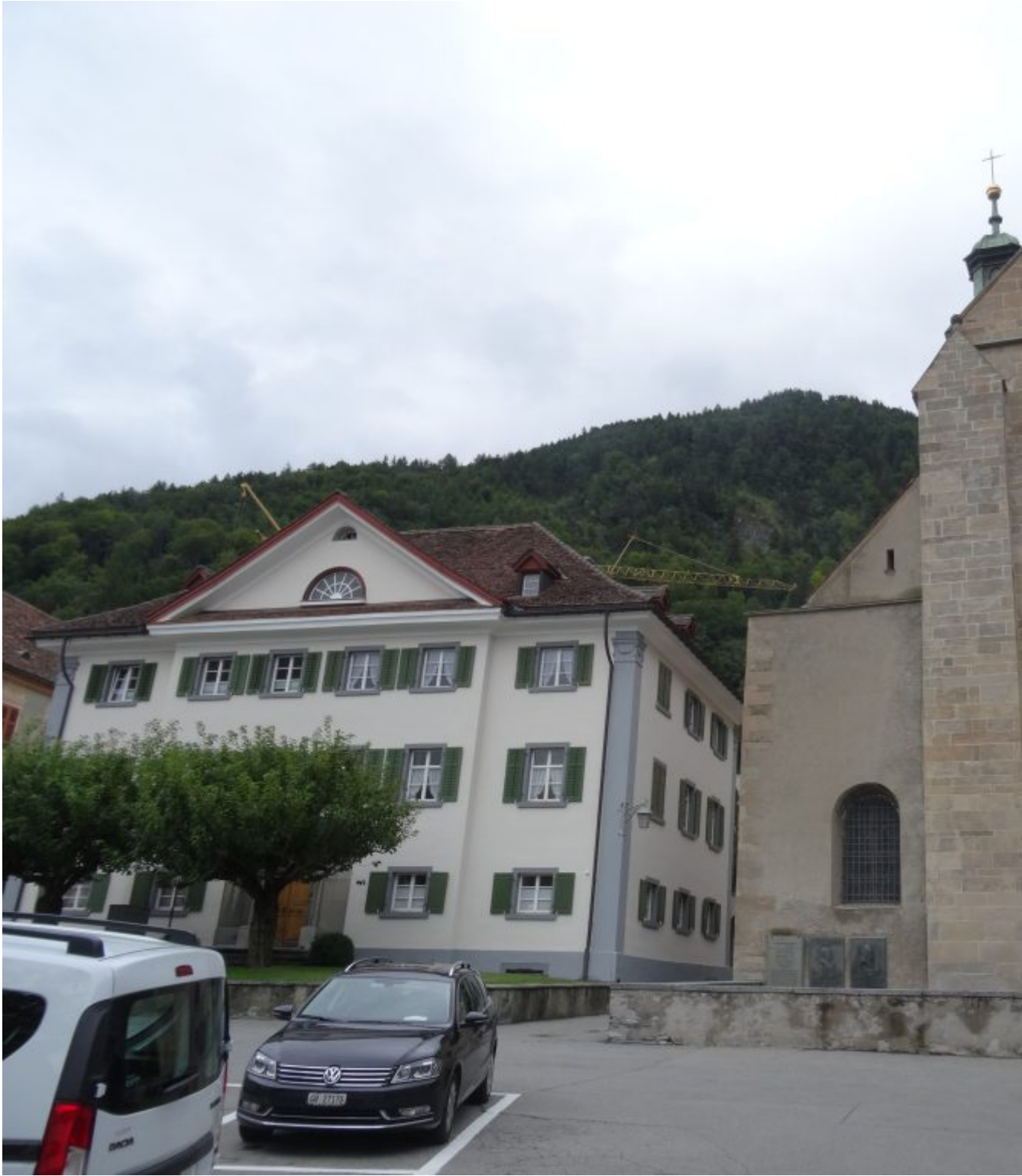
St. Maria Himmelfahrt kathedraal