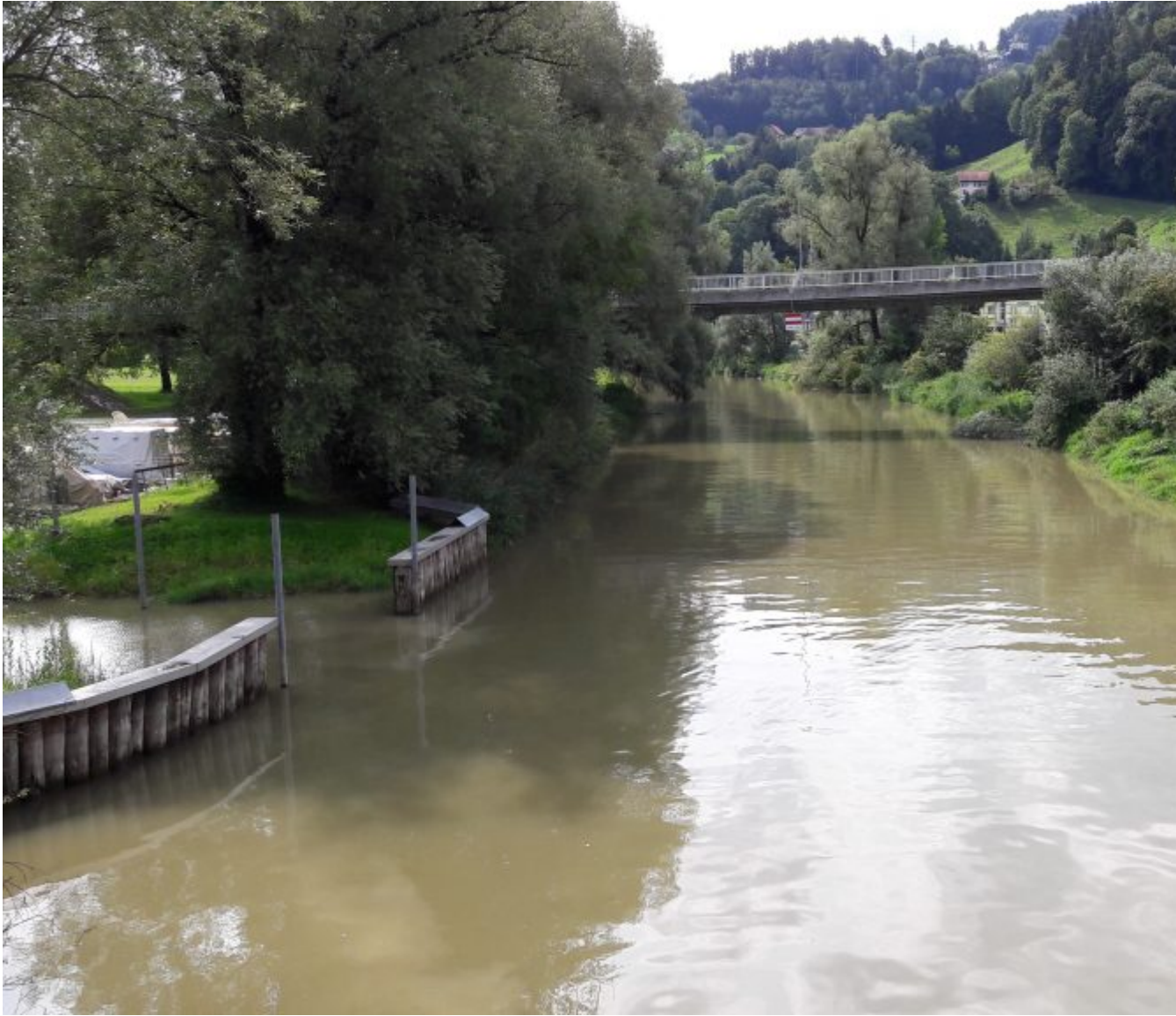
De originele loop van de Rijn