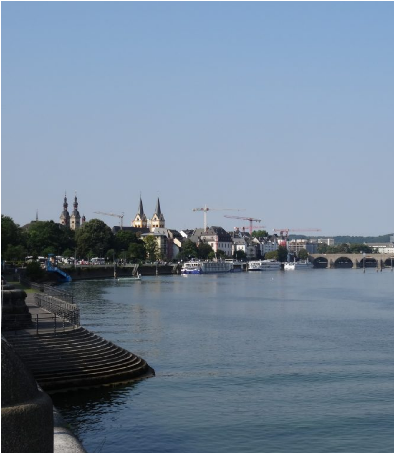
De Rijn van rechts en de Moezel van links