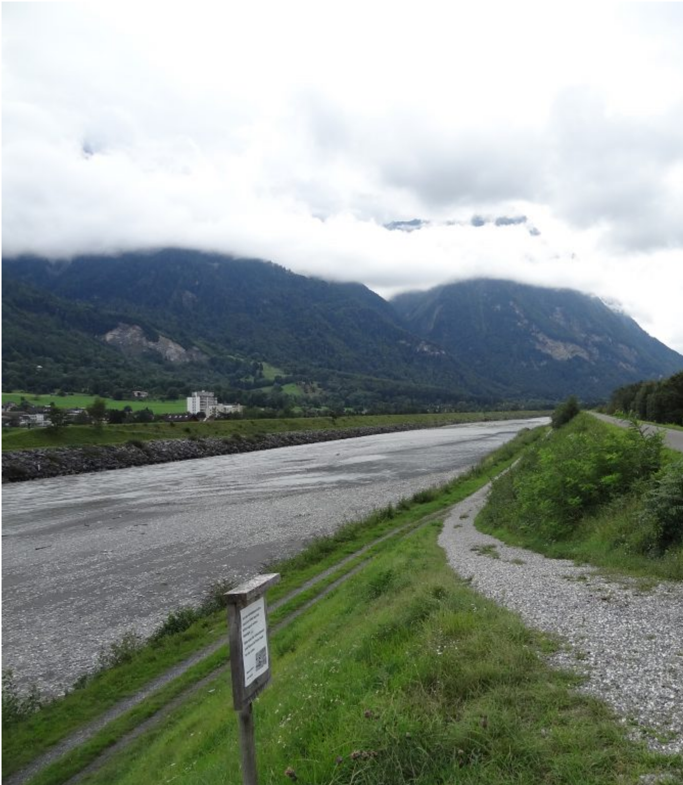
De gekanaliseerde Rijn