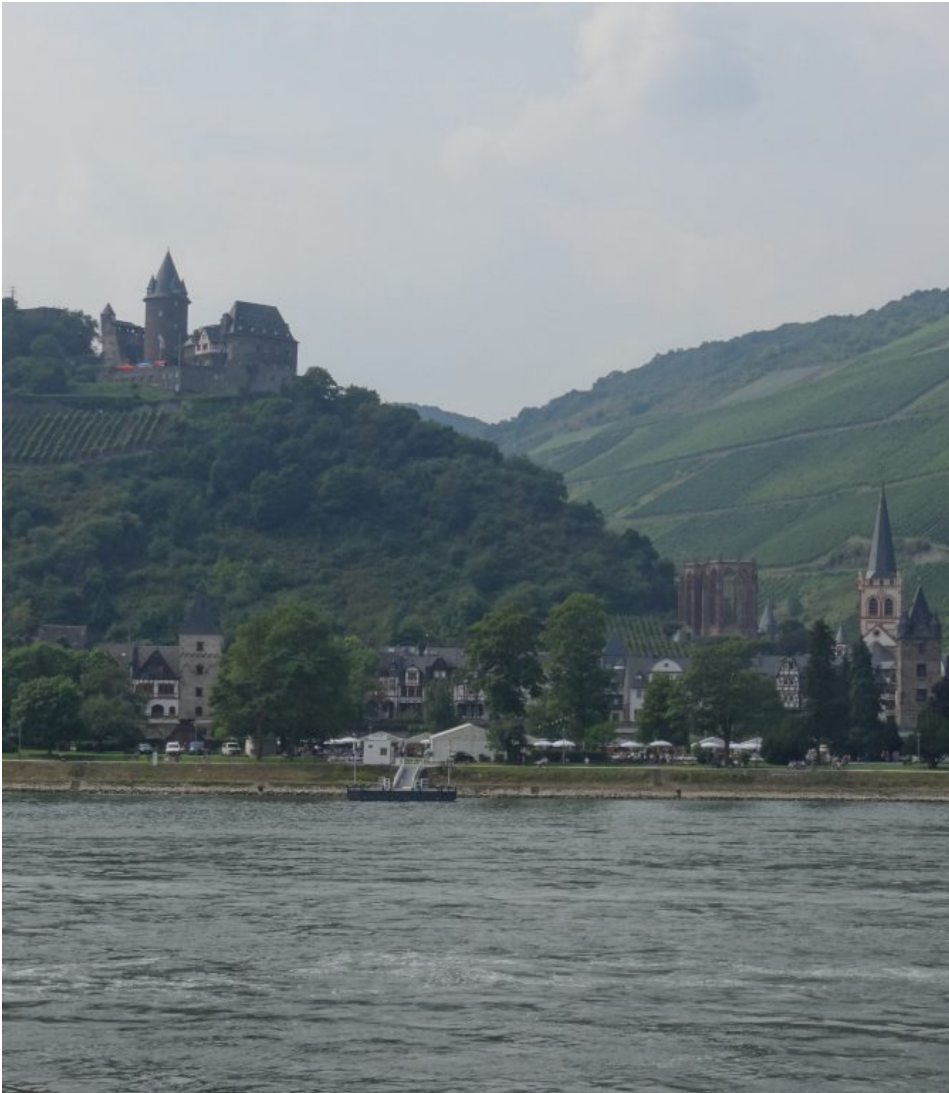
Nog een doorkijkje aan de Rijn