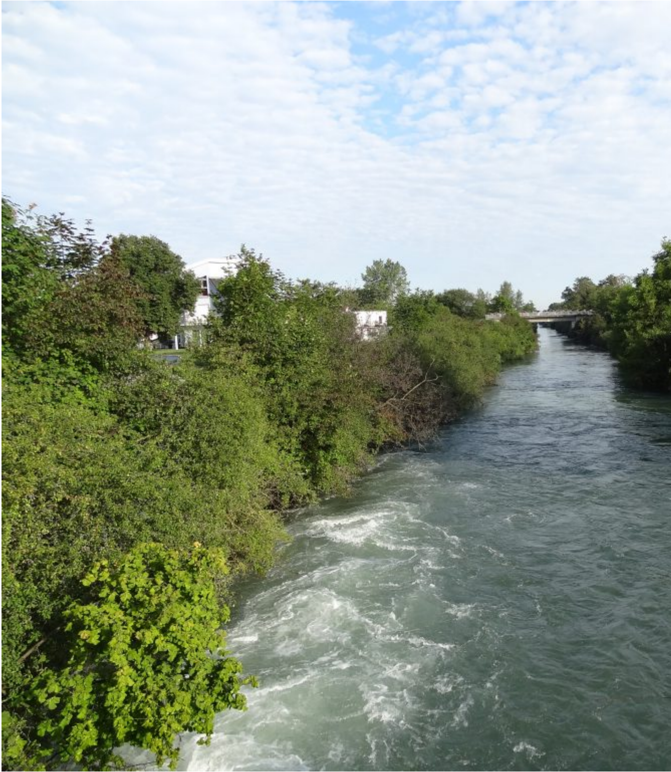
Canal de Hunique