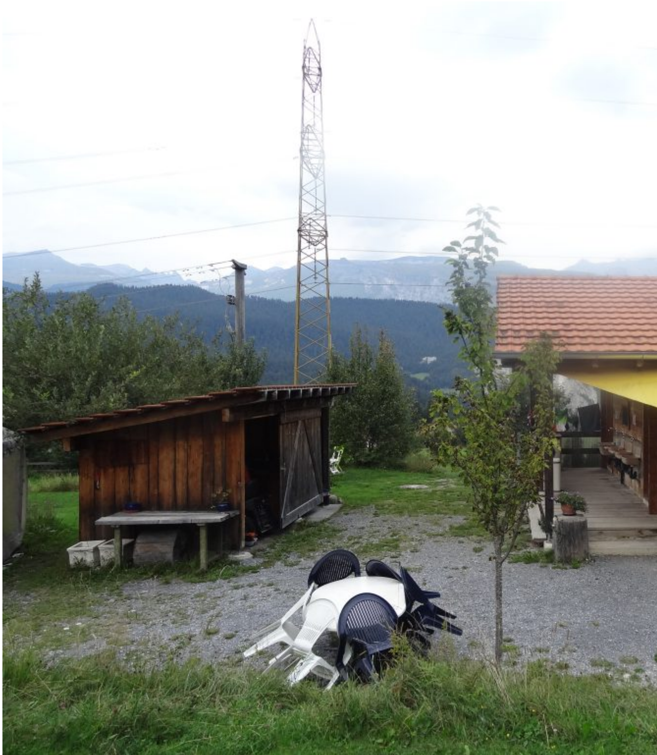
Camping Carrera bij Carrera