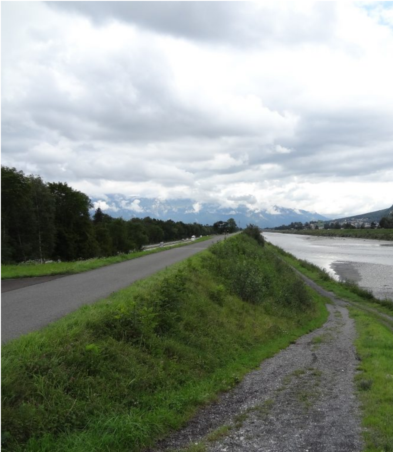
De gekanaliseerde Rijn