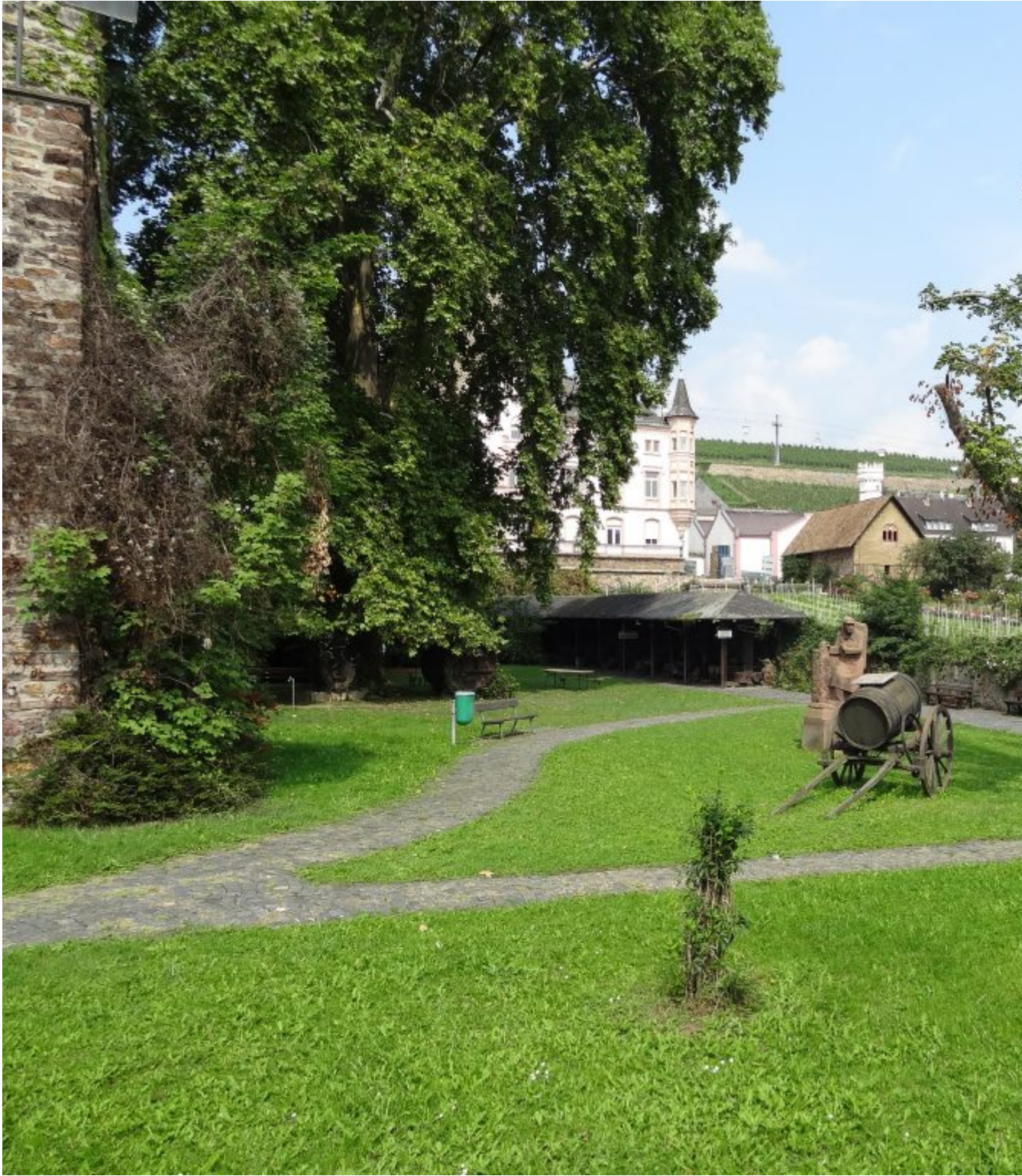
Met de omliggende tuin