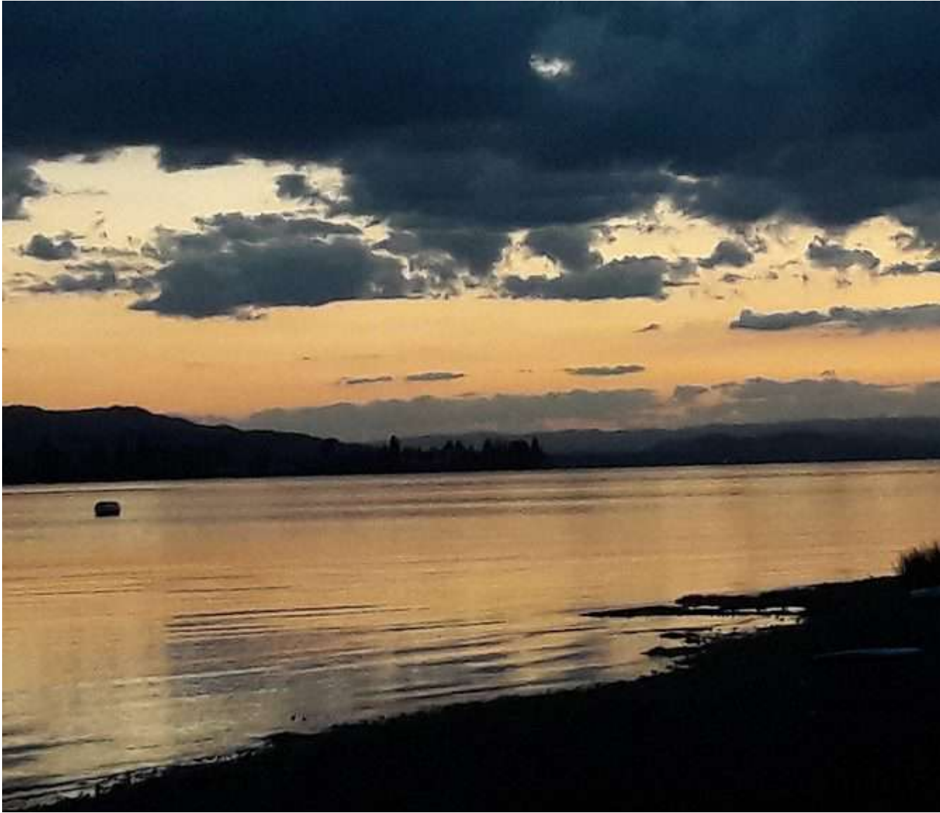
Een prachtige zonsondergang