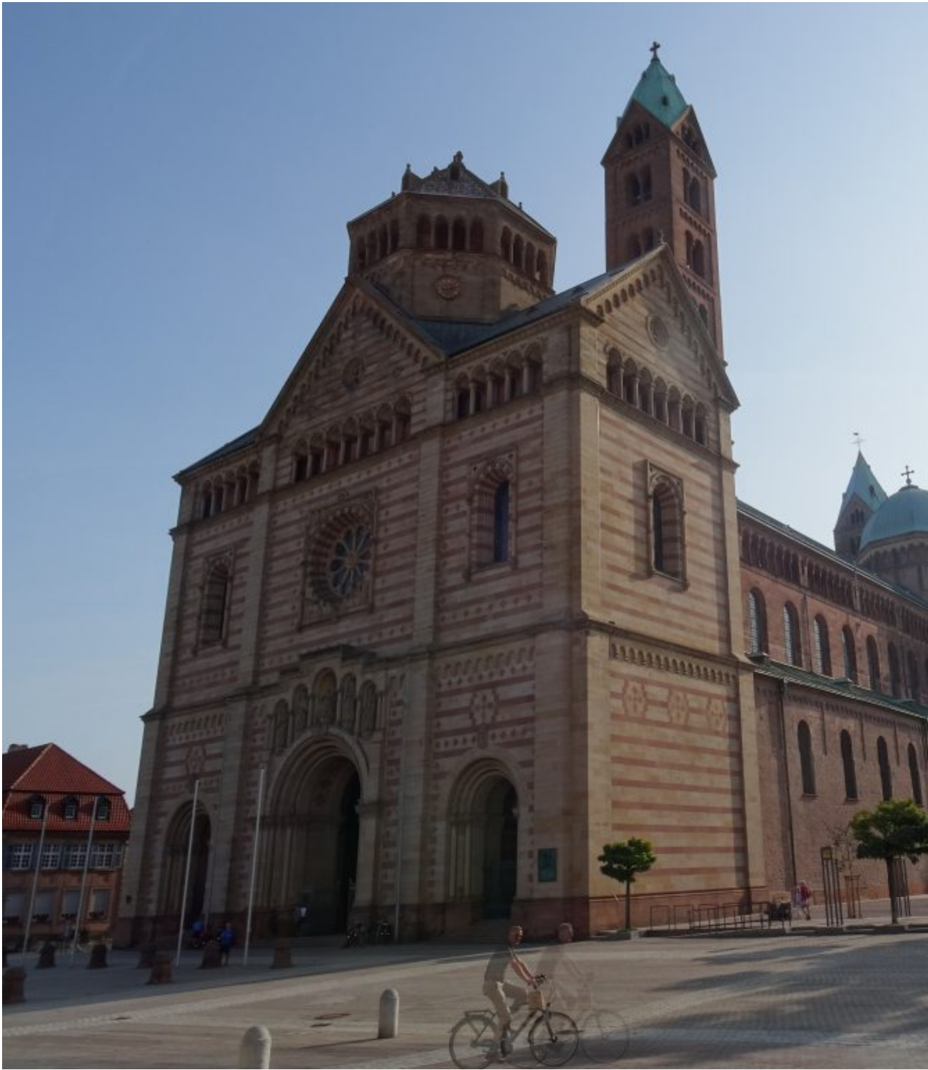
Kaiser- und Mariendom zu Speyer