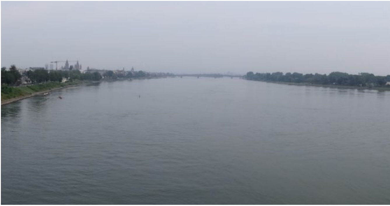
De Main stroomt hier vanaf rechts in de Rijn