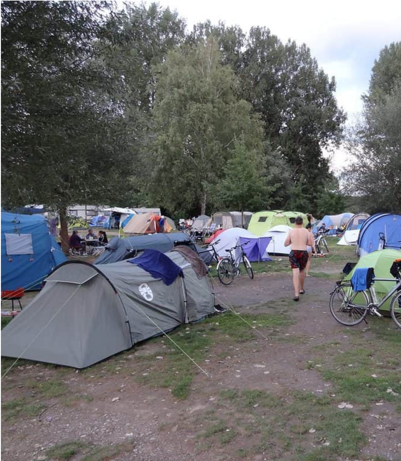
Overvolle tentenveld op camping Hegne

Maandag 21 augustus Naar het Zwarte Woud