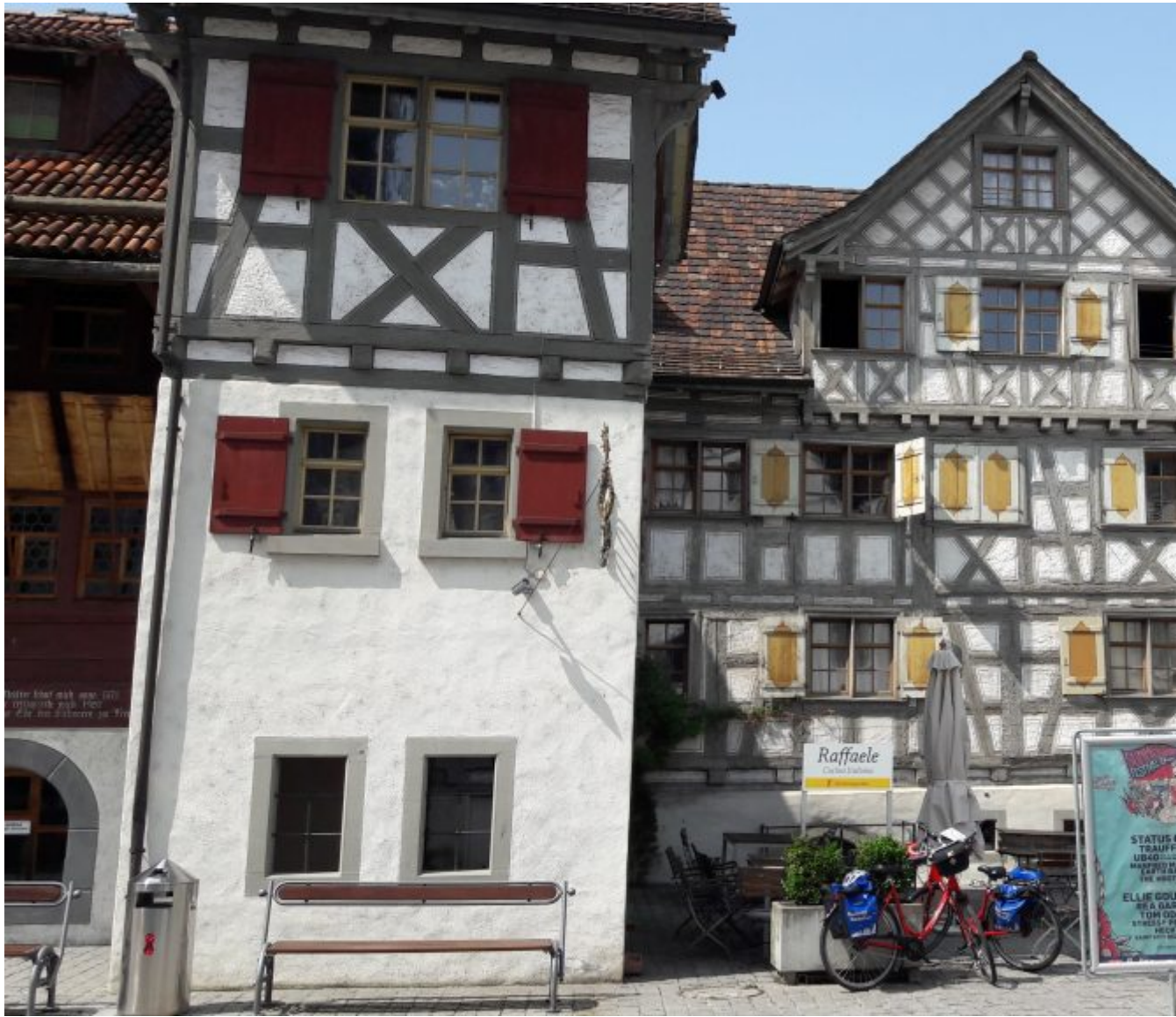
Vakwerkhuzen in Arbon