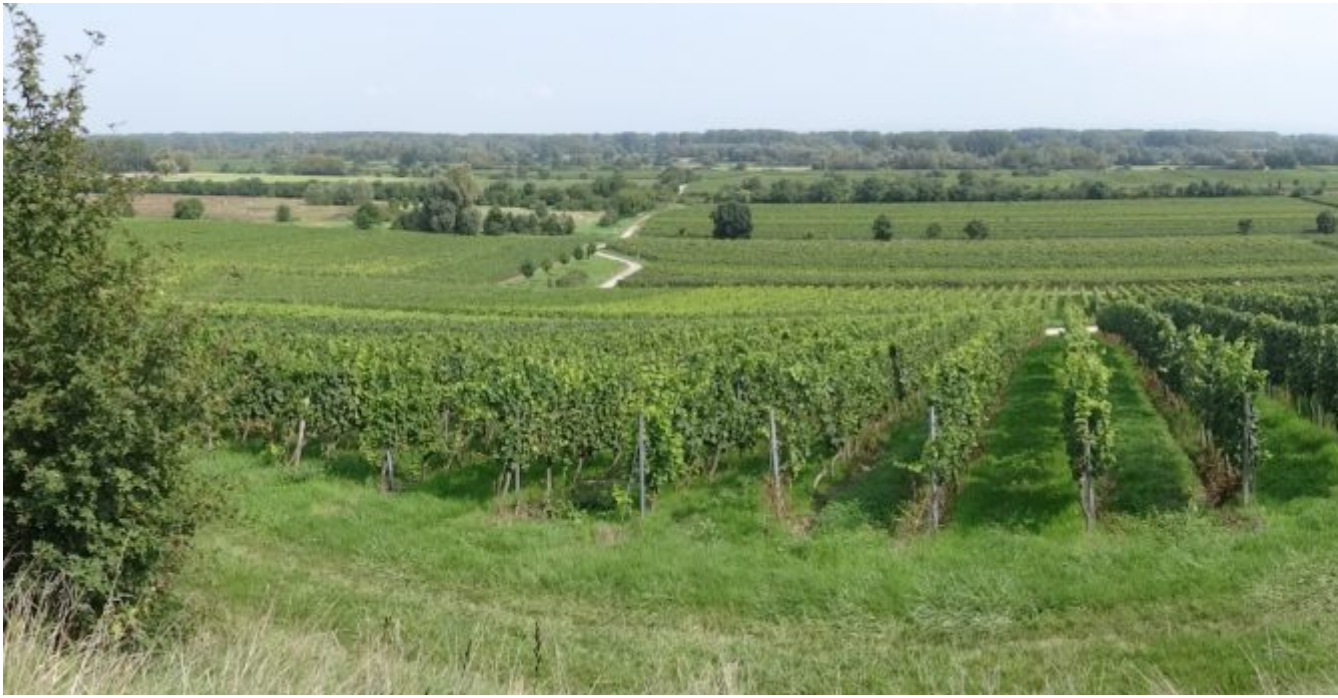
De wijnvelden van de Rheinland-Pfalz