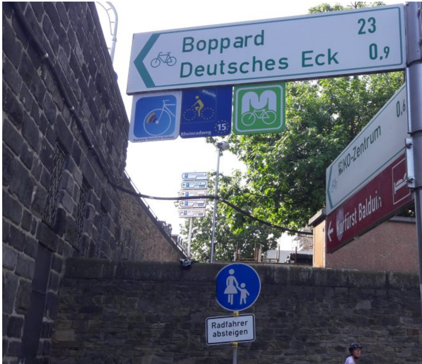
RadRheinWeg en Santiagoroute samen