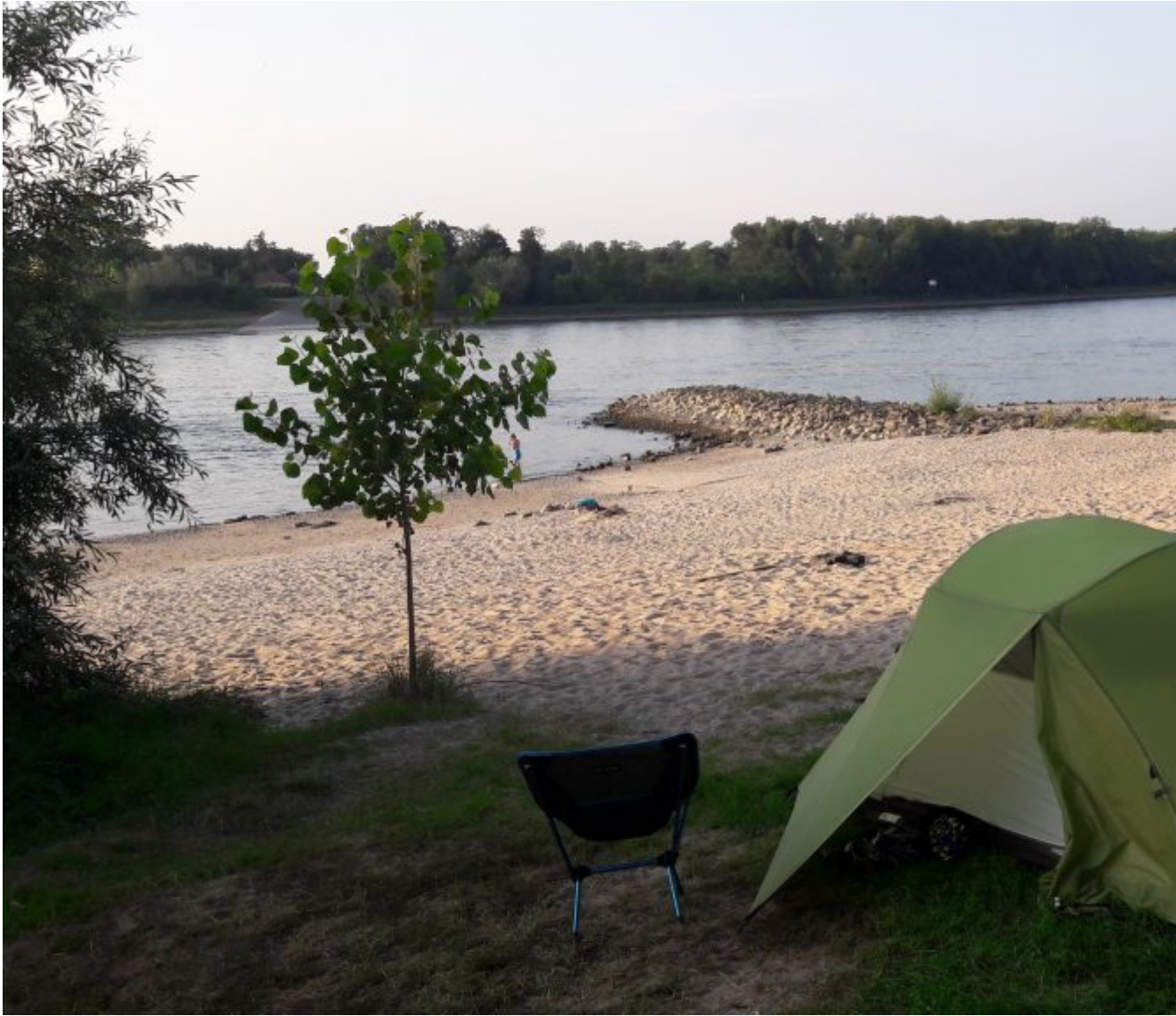
Uitzicht vanaf de camping op de Rijn