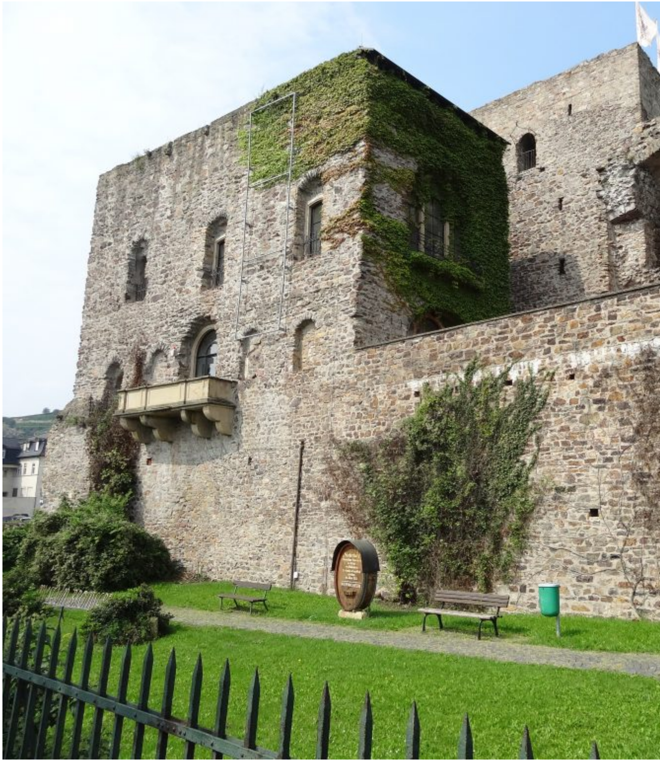
Niederburg, ook Brömserburg genoemd