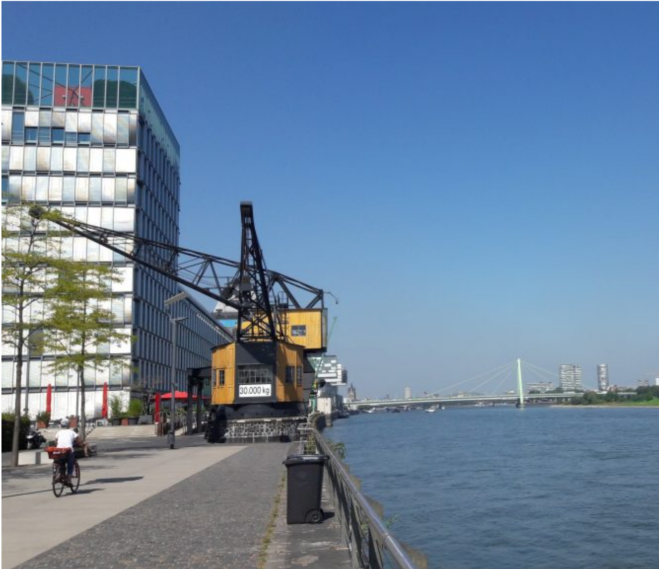
De Rijn bij Keulen