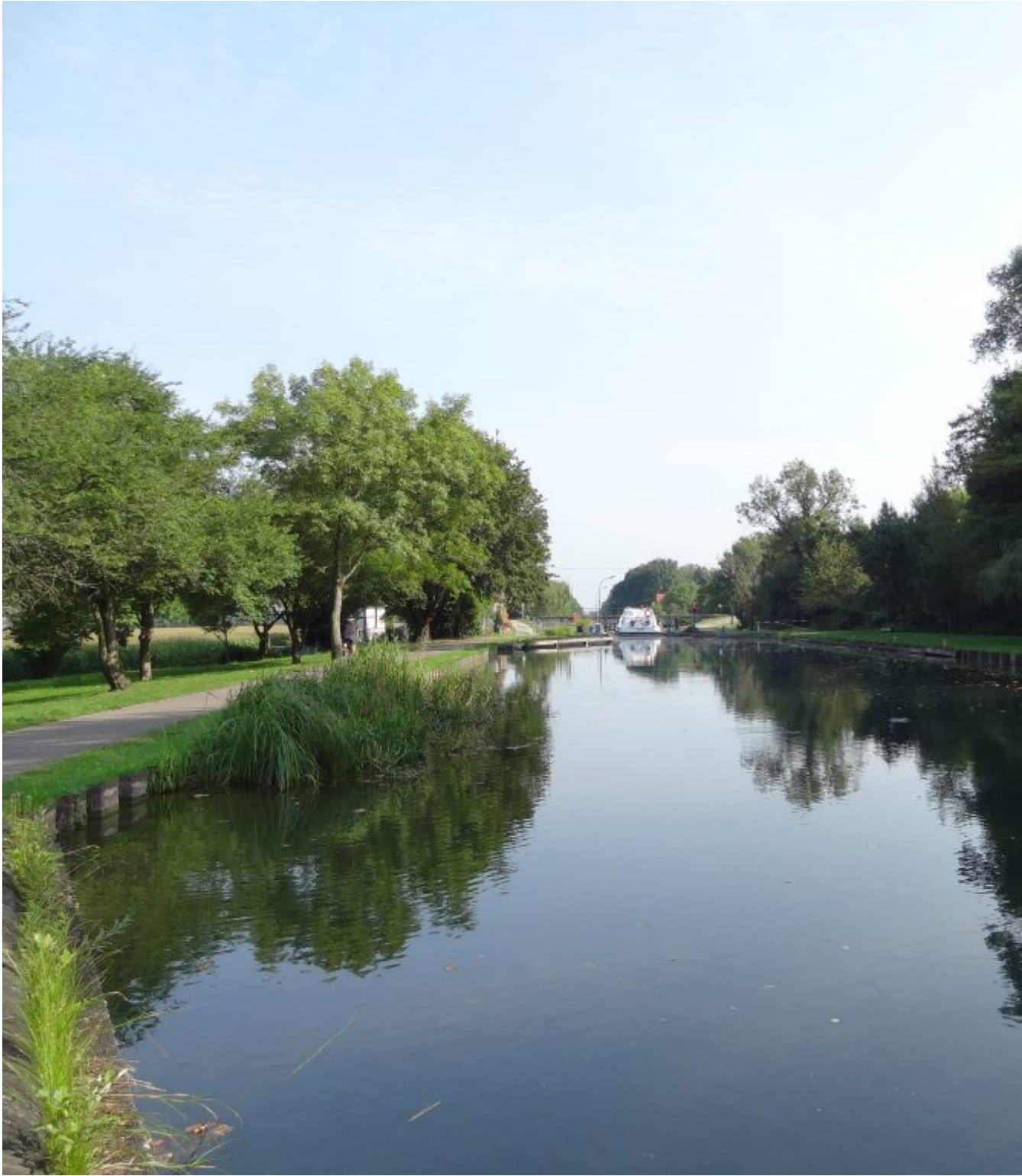
Canal du Rhone au Rhin