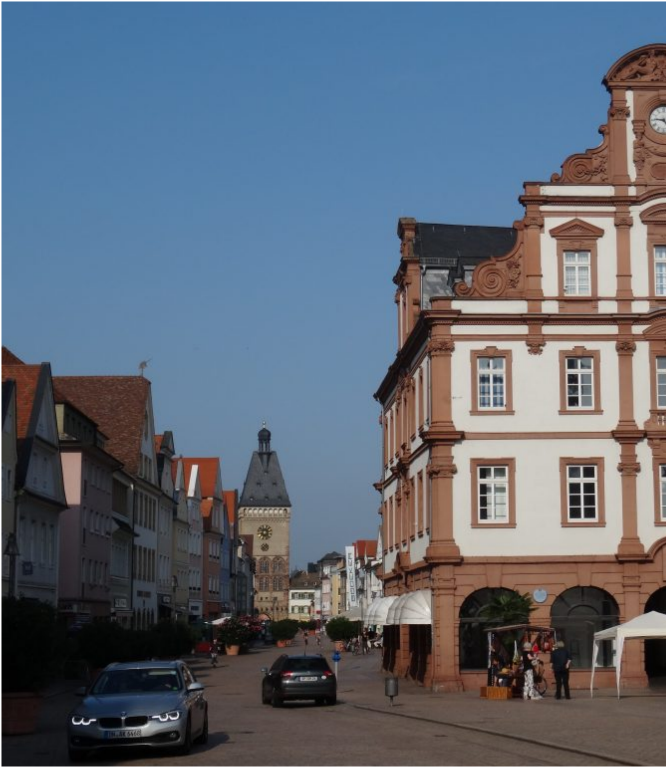
Alte Münze Speyer