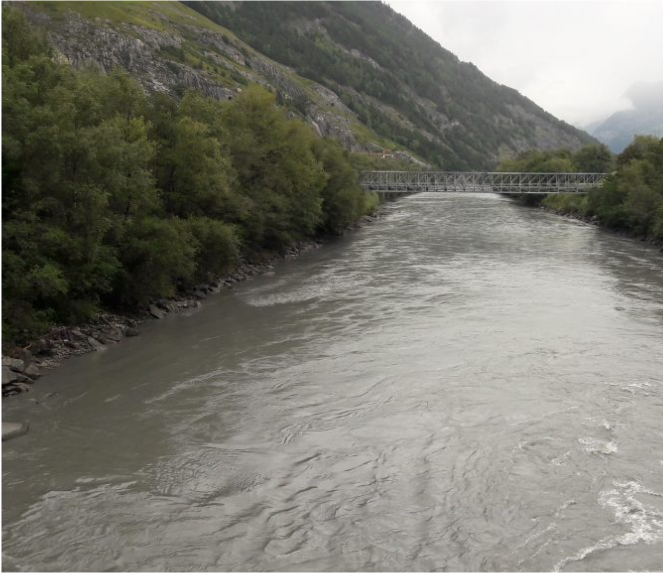
Inmiddels de Hinterrhein er ook bij