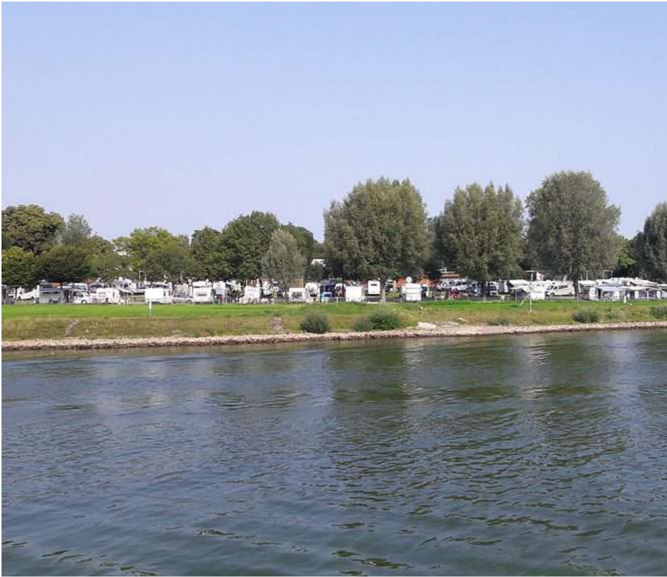
Camping Koblenz nog hetzelfde?