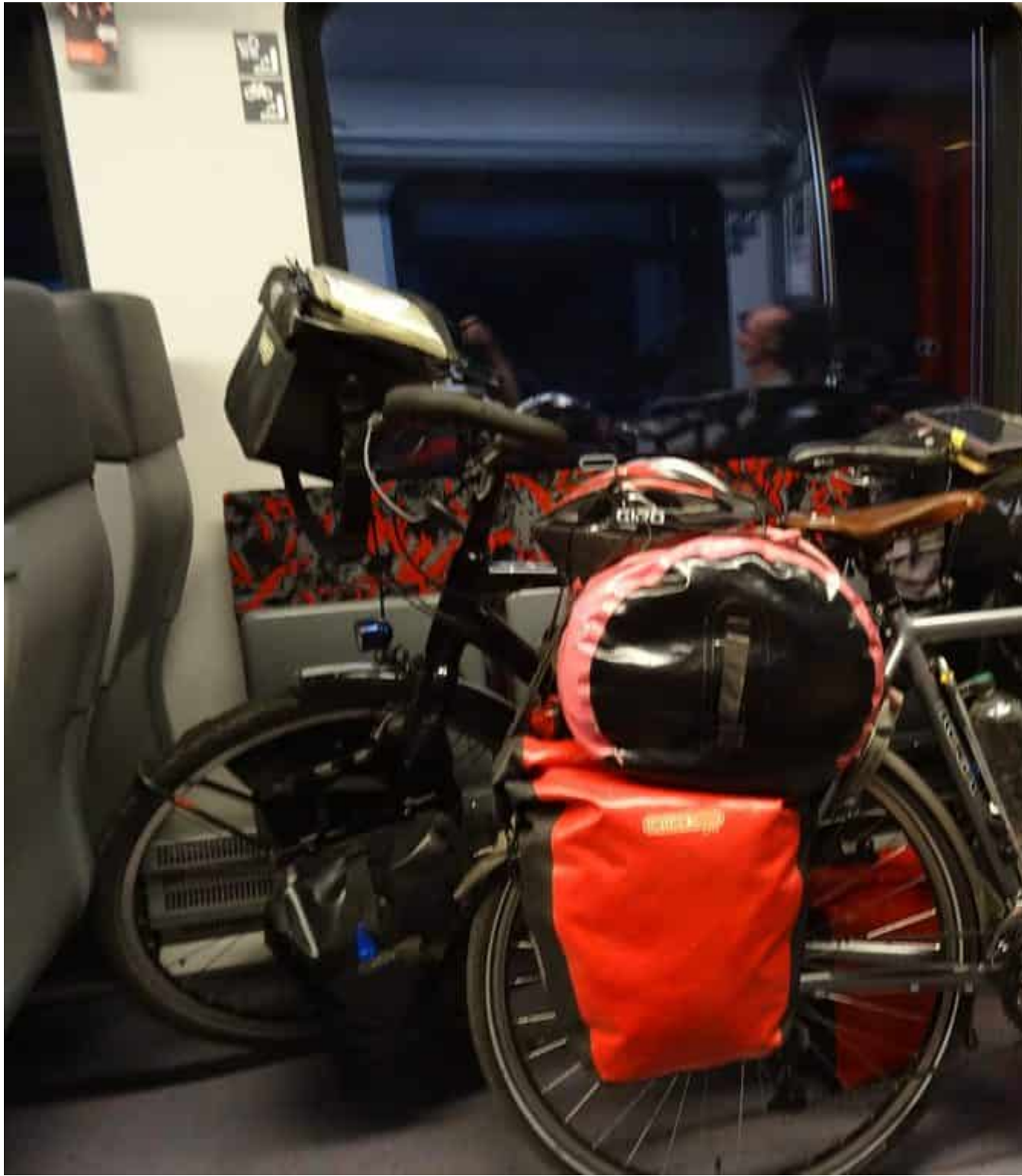
De eerste Duitse trein