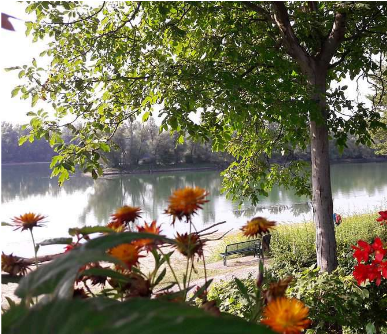
Een kopje koffie vanaf een terras met doorkijk naar de Rijn