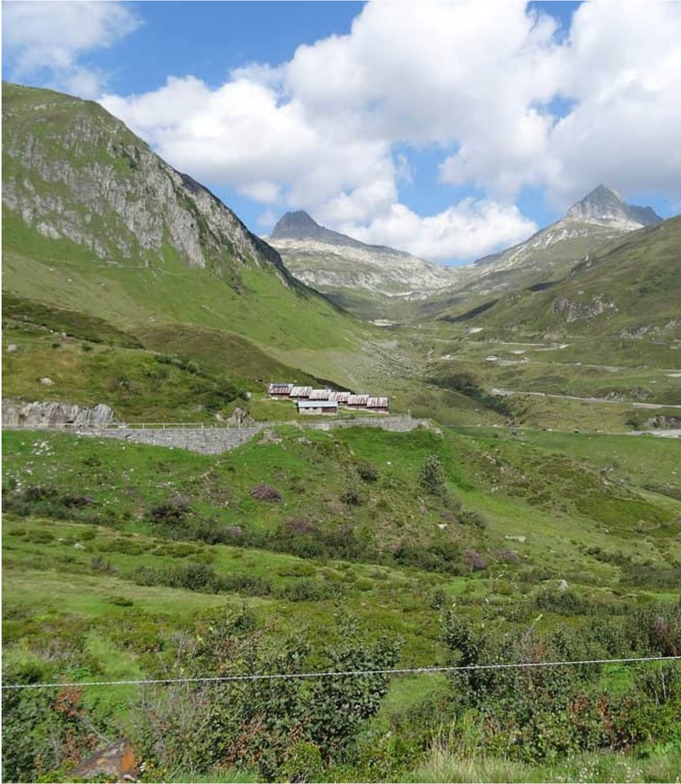
Tussen de Alpen