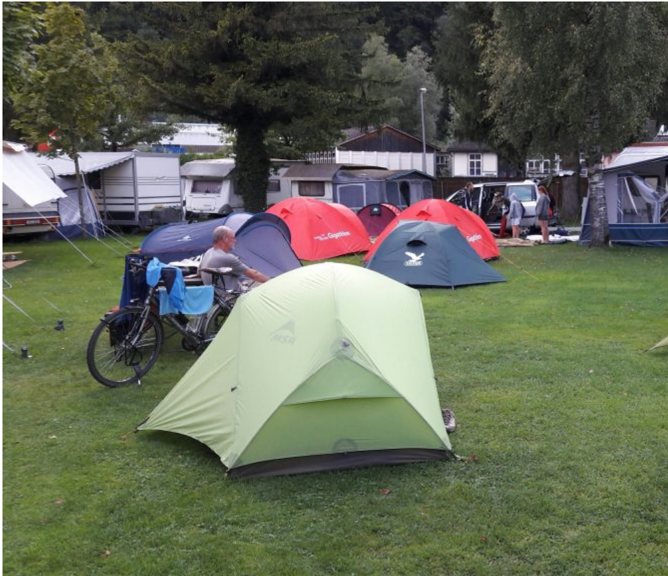
Camping Werdenberg in Buchs