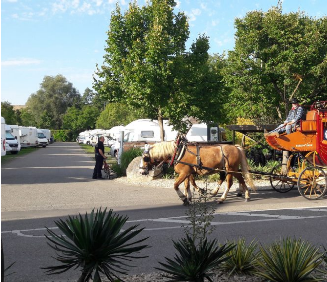
Tipi-camping in Rust