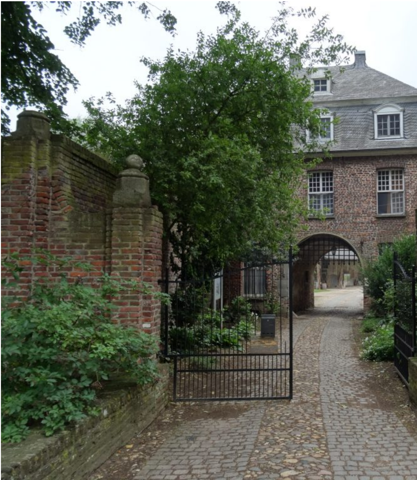
Landgoed Haus Gräfenthal