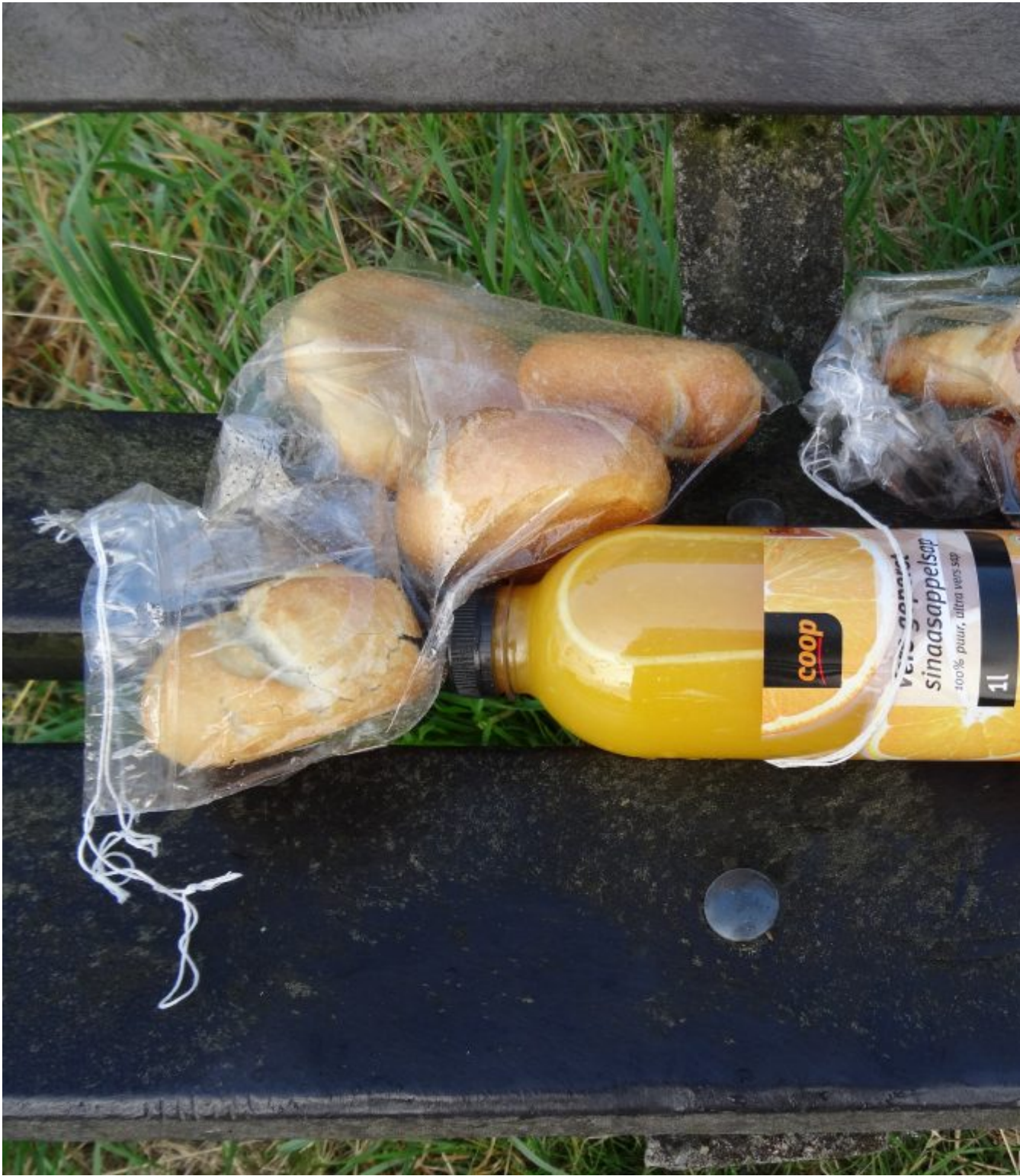
Het ontbijtje van de Coop