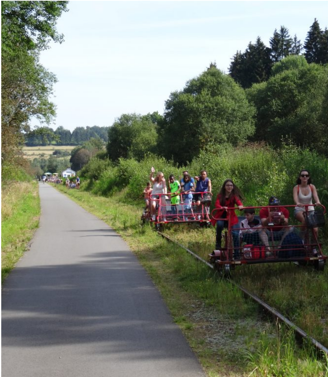
Fietstrolley op de Vennbahn