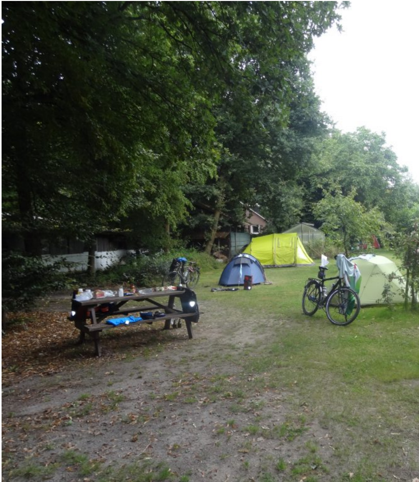
Camping Heiderust in Baarlo