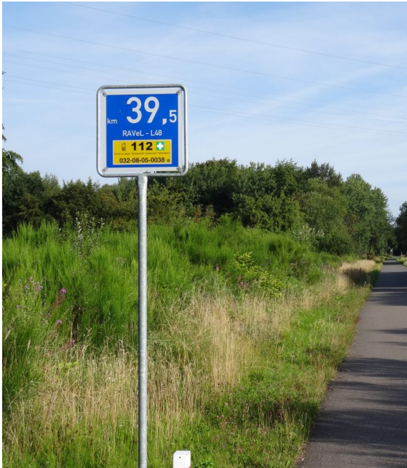
De lange beklimming vanaf Aken