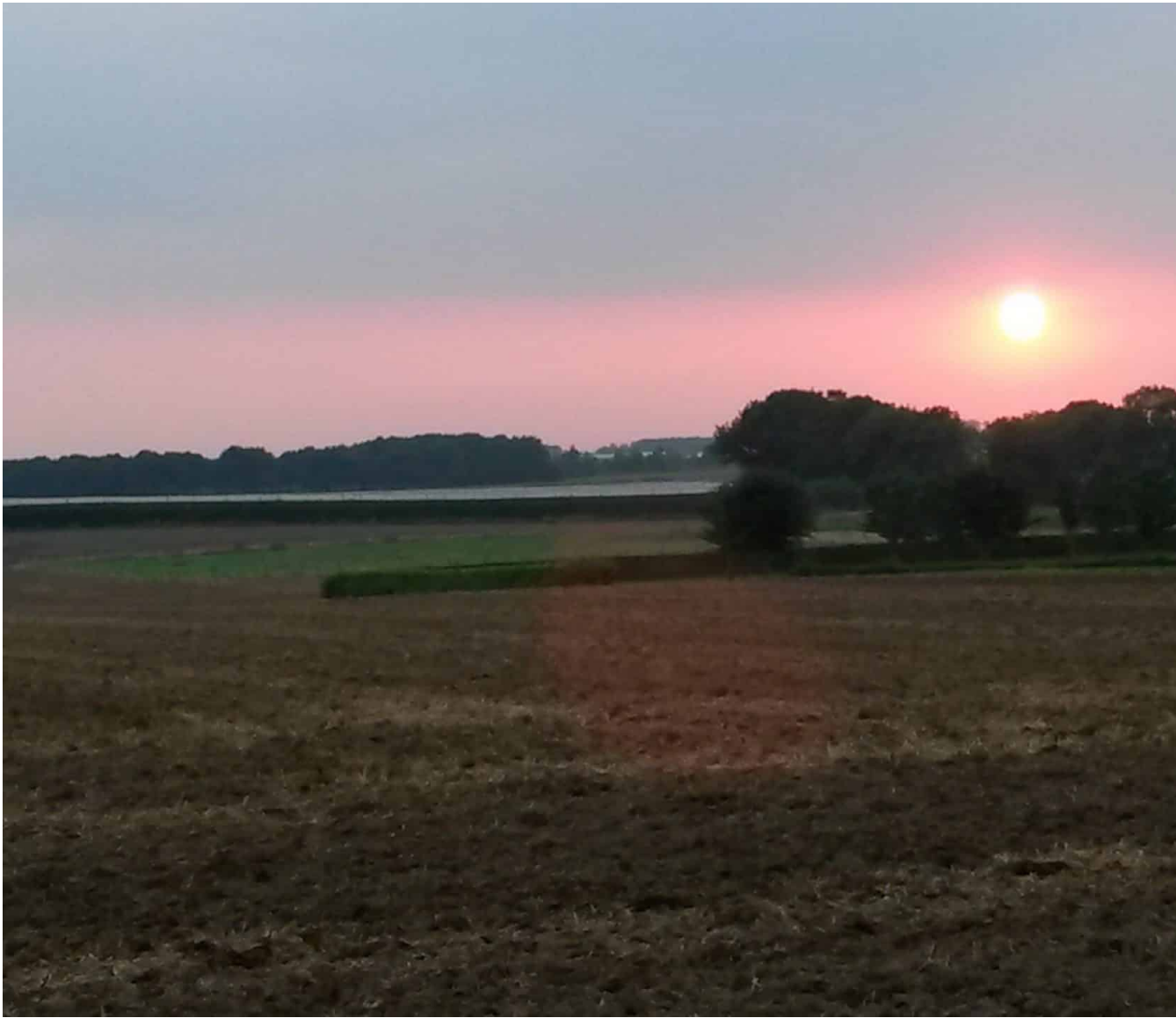
Zonsondergang op camping Oensels Fruitweike