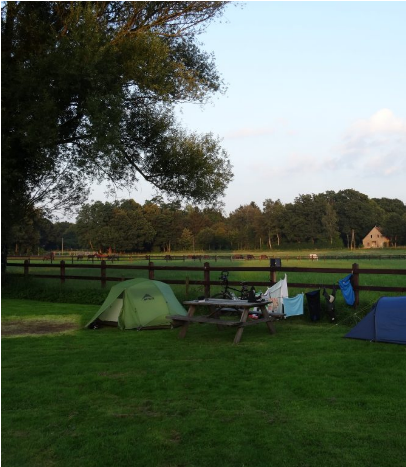
Camping het Smokkelpad in Horst