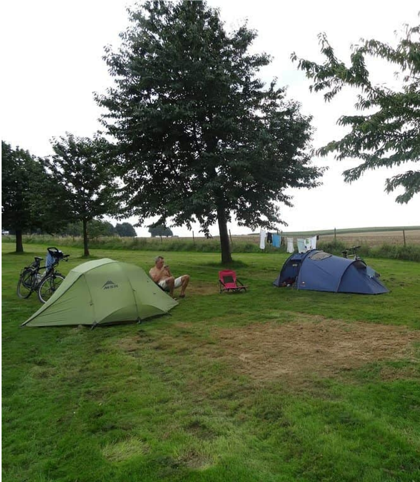
Minicamping Oensels Fruitweike