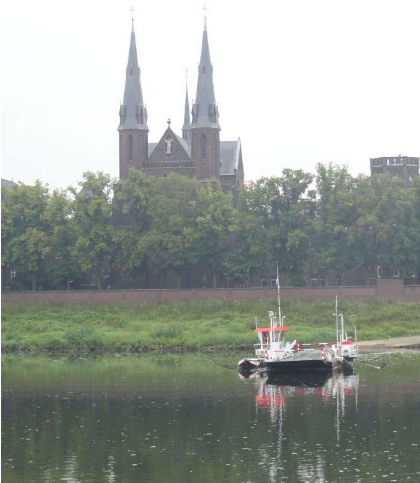
Pontje over de Maas