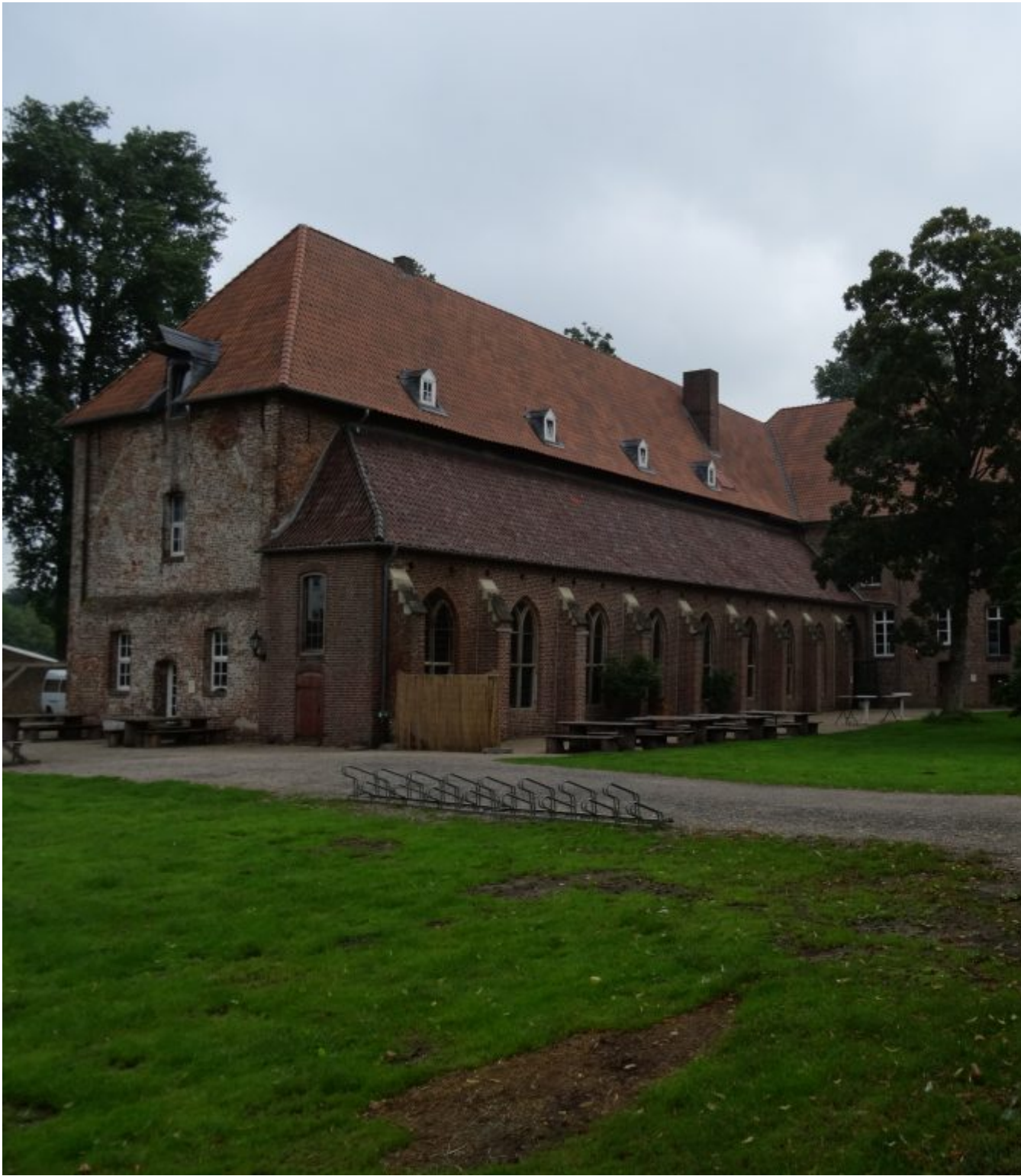
Landgoed Haus Gräfenthal