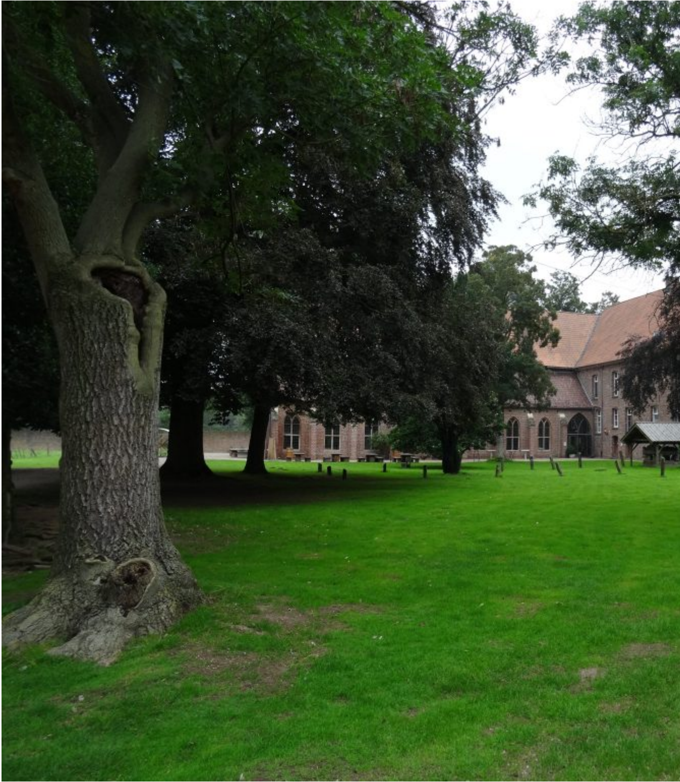
Landgoed Haus Gräfenthal