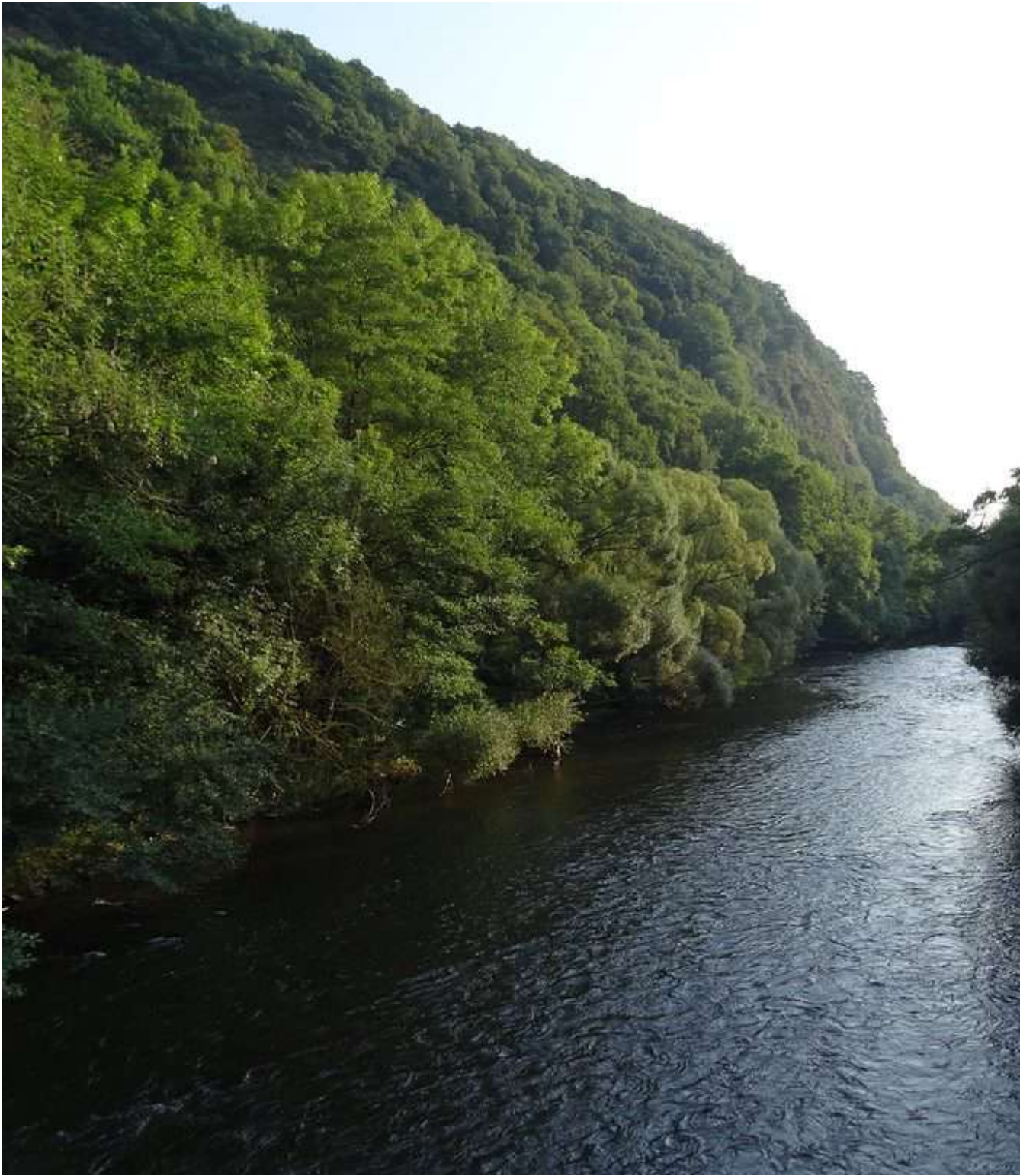
De Ambleve bij de camping