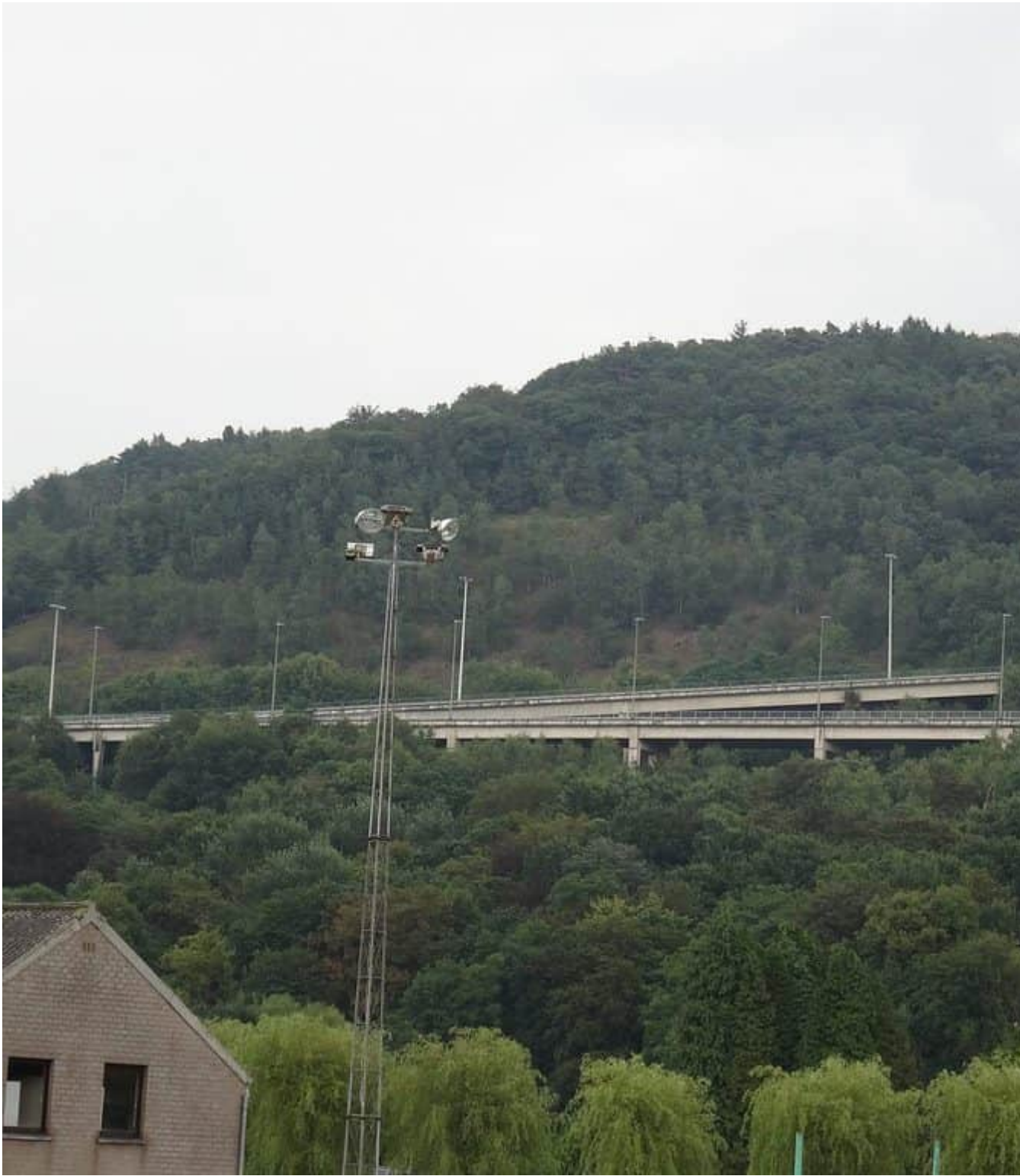
Route du Soleil