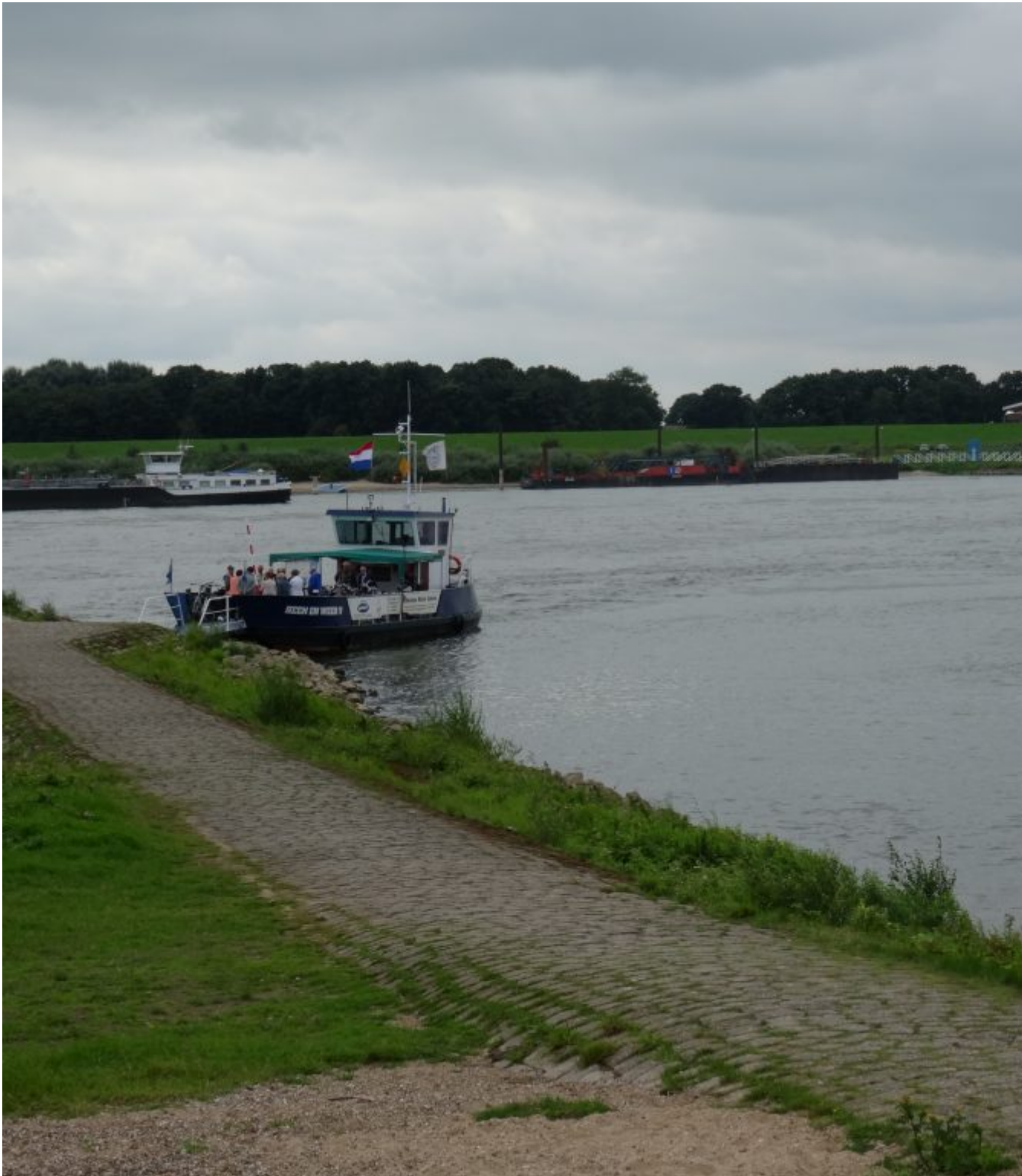
Het pontje naar Millingen