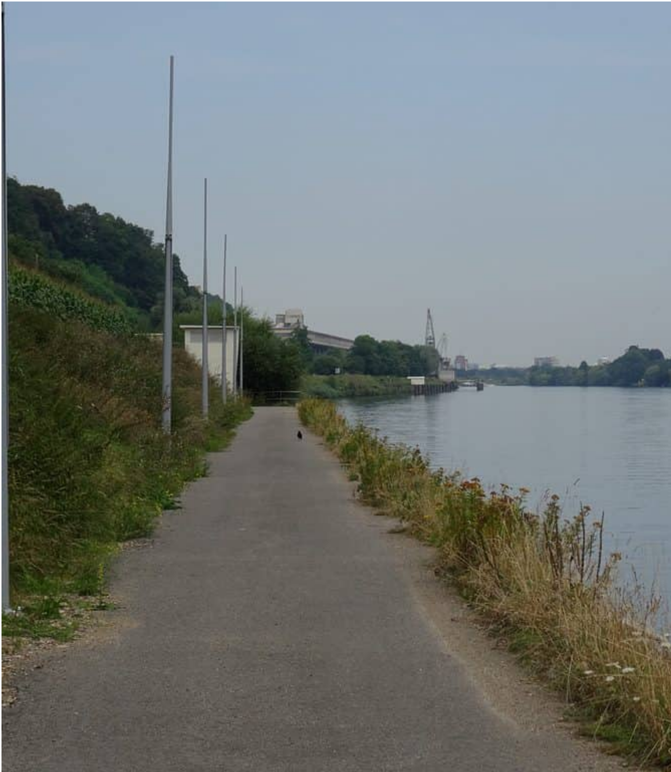
Bij de Pietersberg langs de Maas weer in Nederland