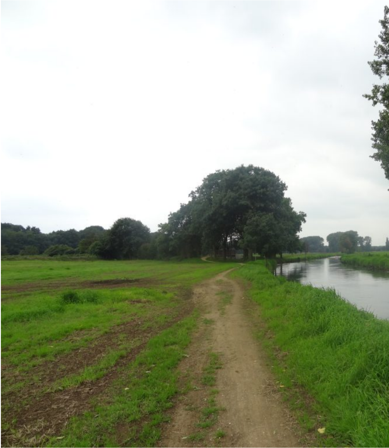
Jaagpad langs de Niers