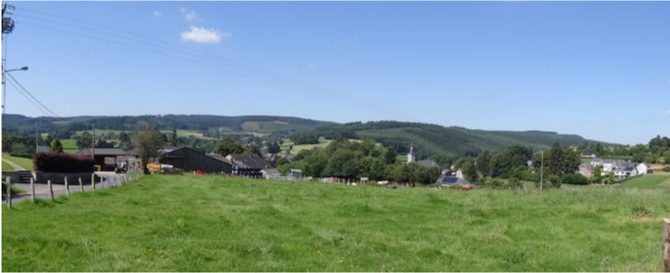
Weer een mooi plaatje in de Ardennen bij de Wanne