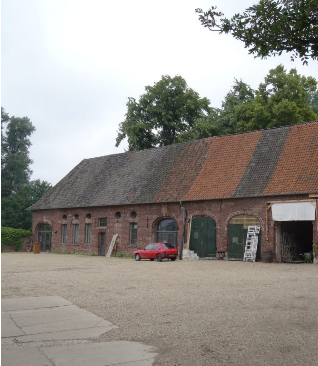
Landgoed Haus Gräfenthal