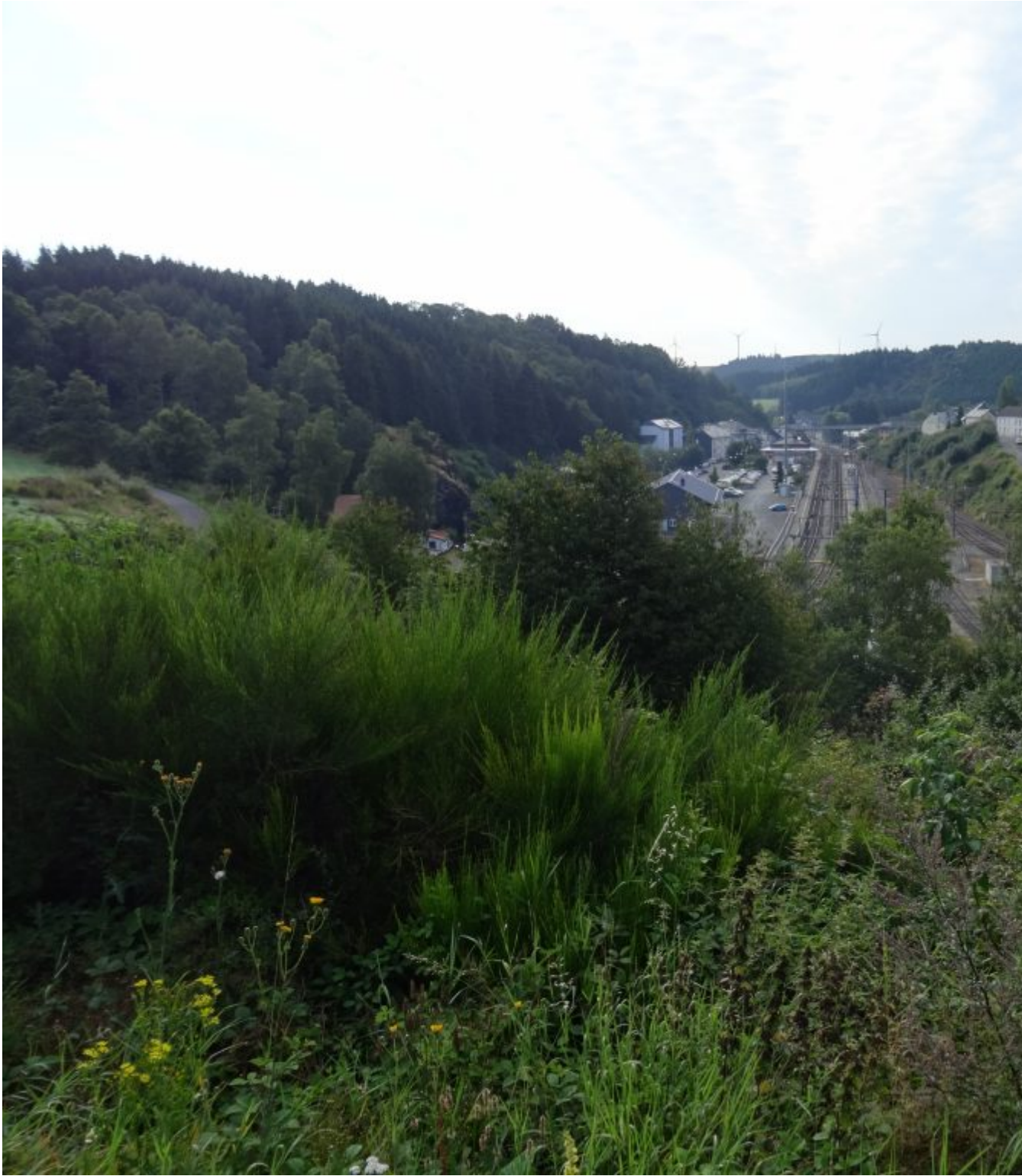
Station van Troisvierges