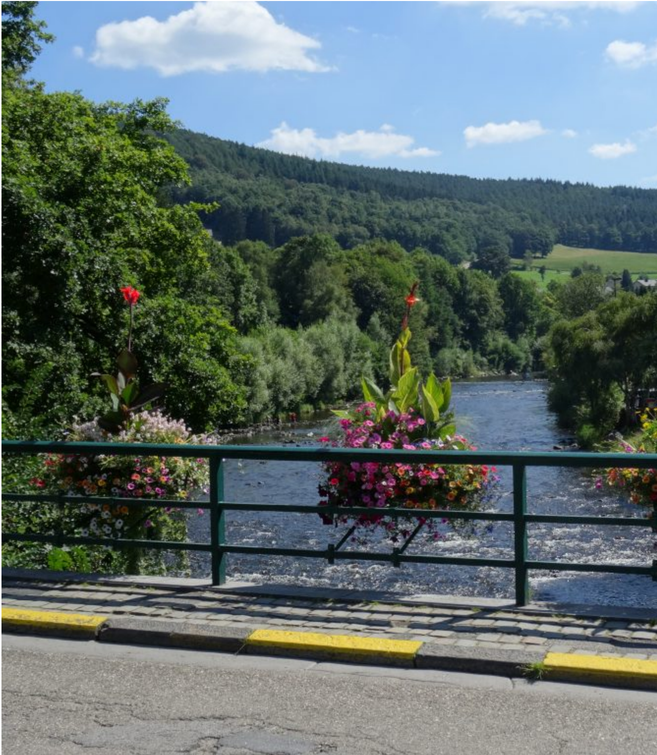
Rivier de Ambleve