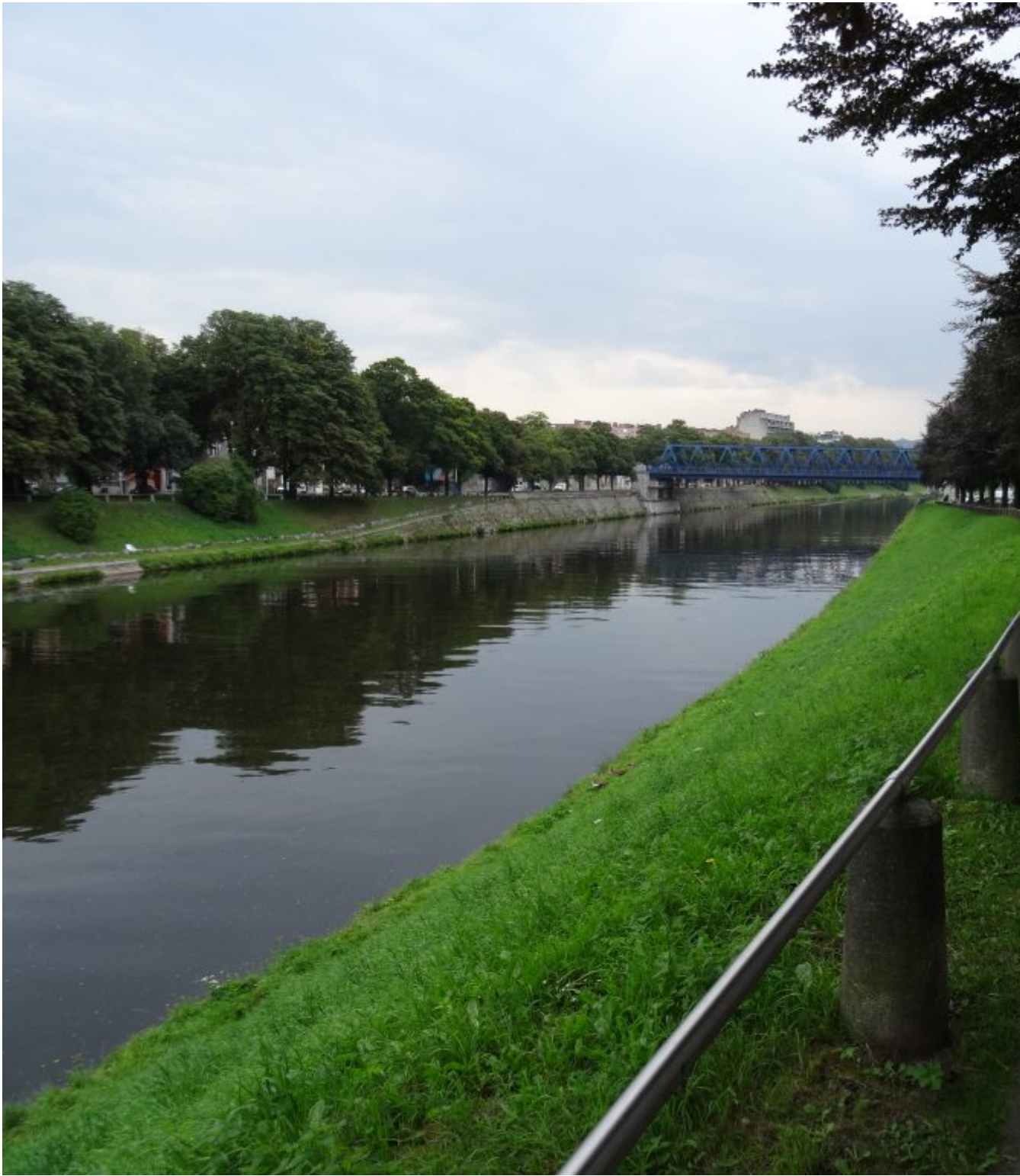
De Maas in Luik