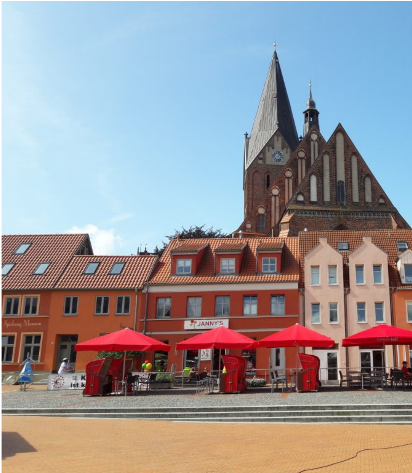
Marktplein van Barth