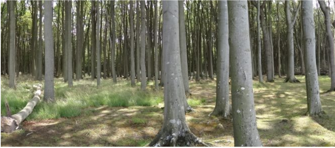
Der Gespenserwald von Nienhagen