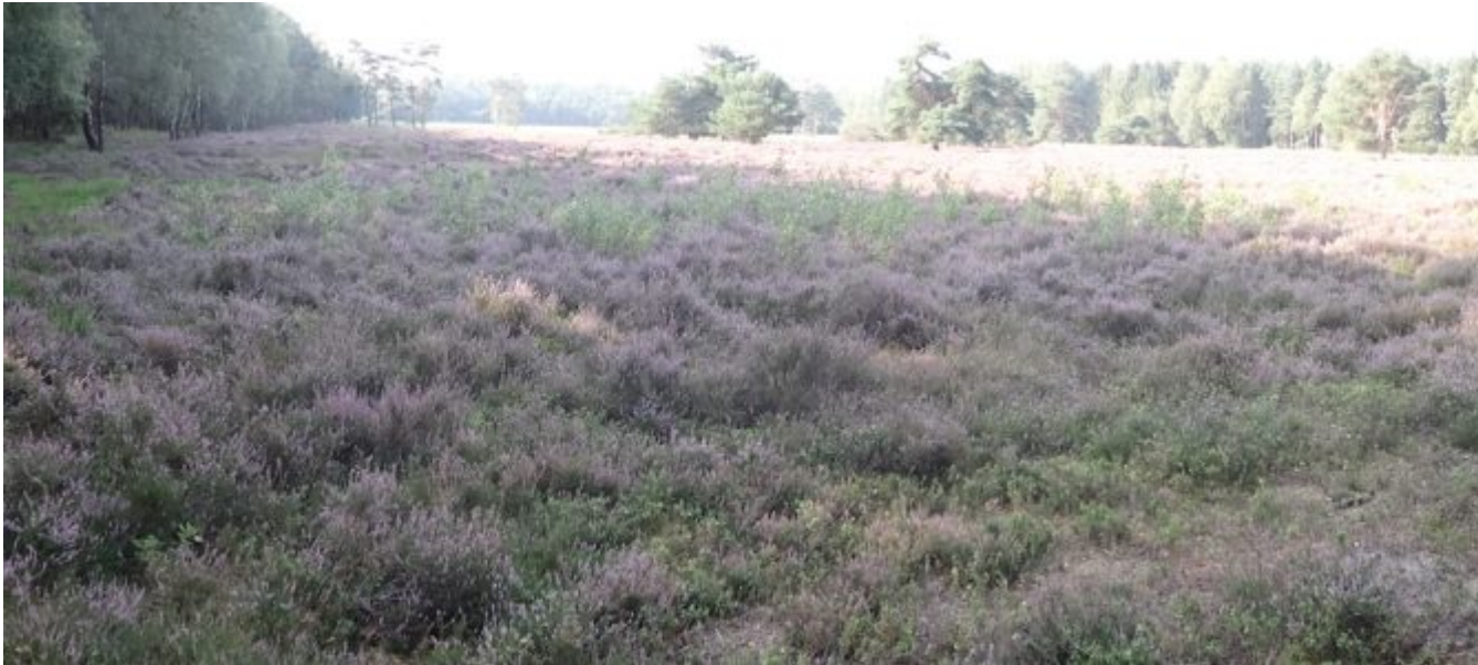
Heide Ahltorner Fischteichen