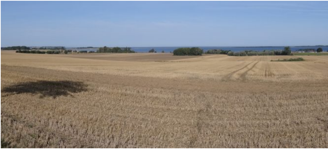
Prachtig uitzicht over de Oostzee