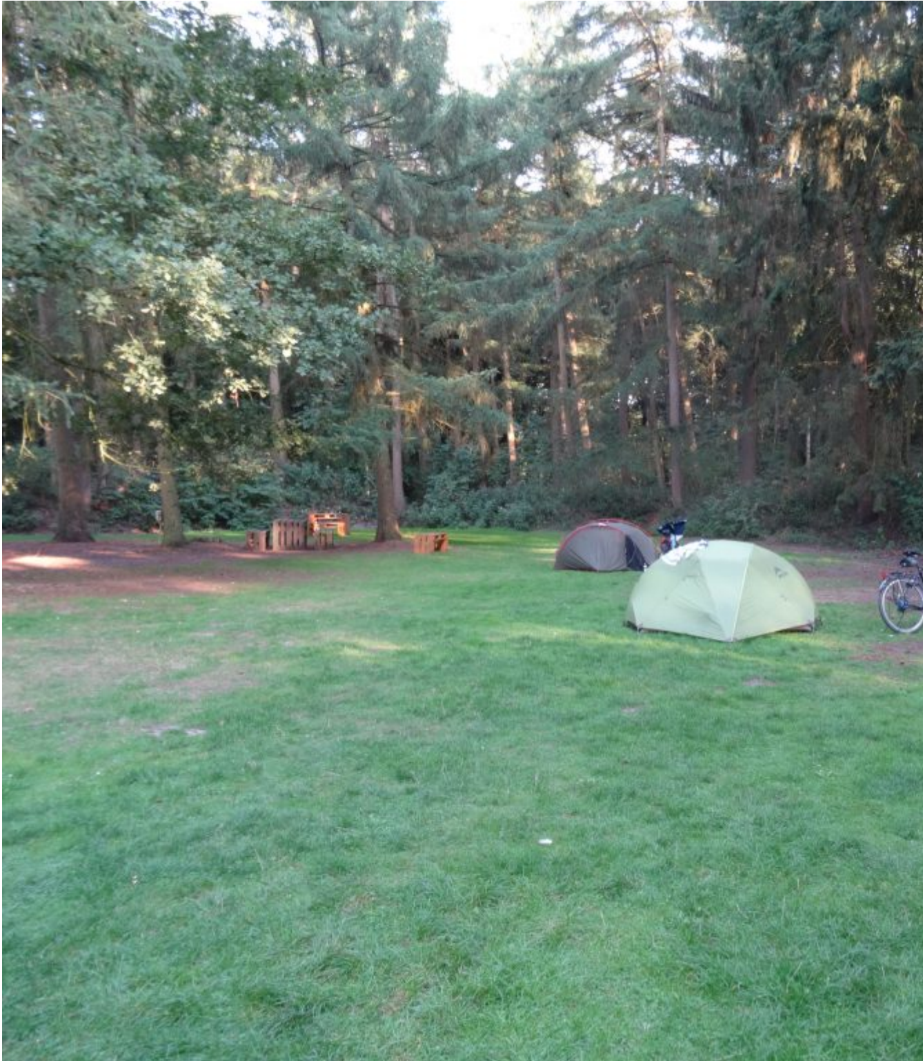
Camping in Dötlingen