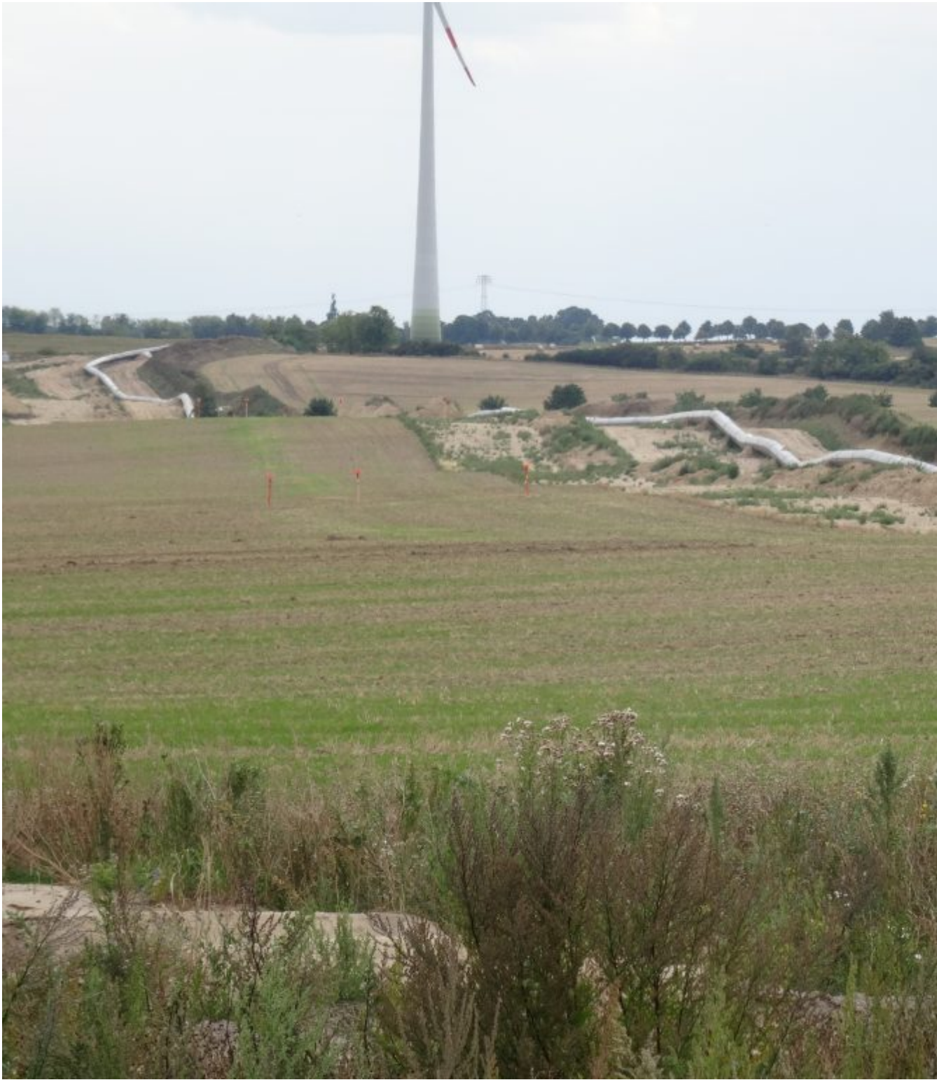
Gas uit Rusland