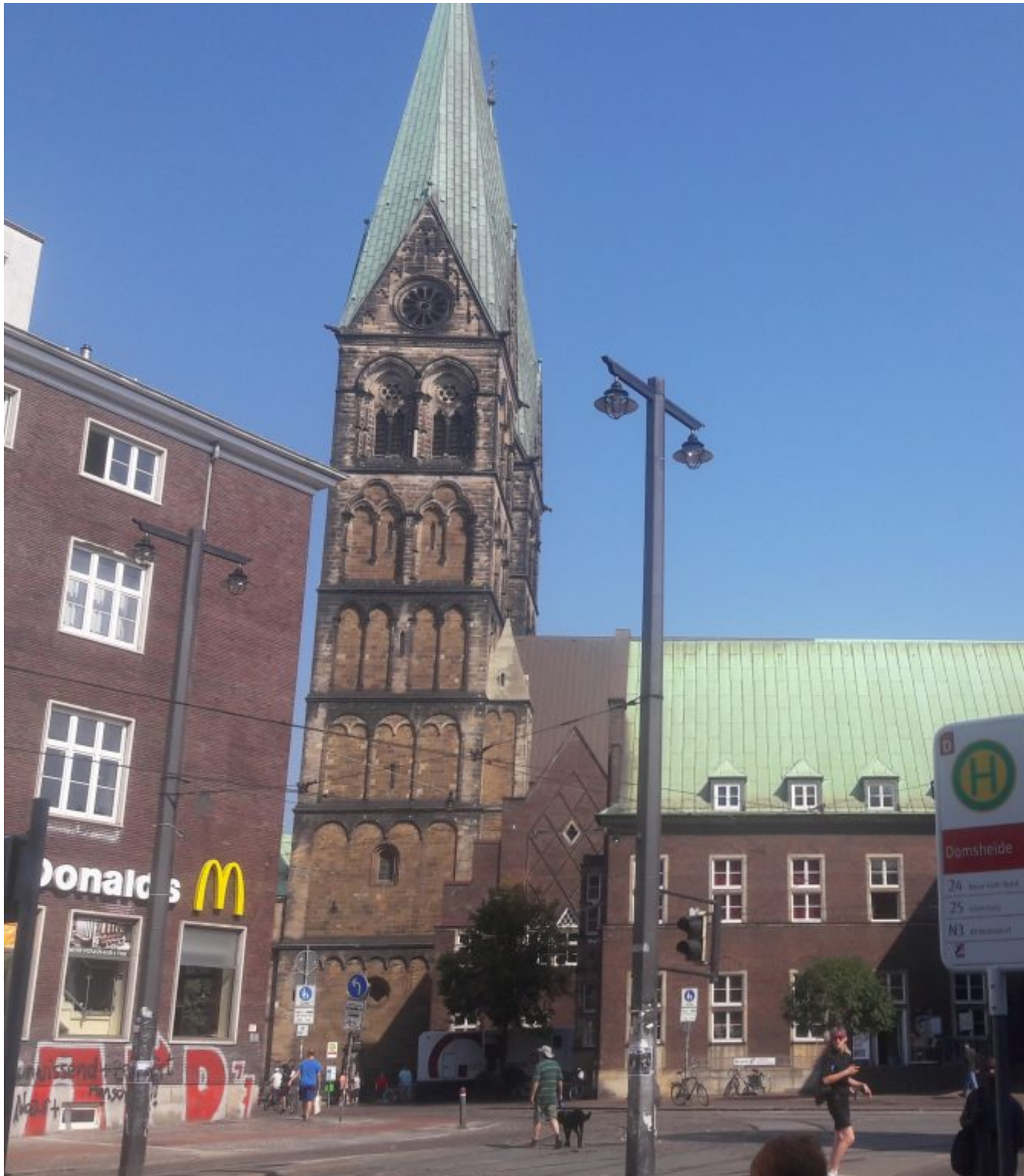
Dom St. Petri