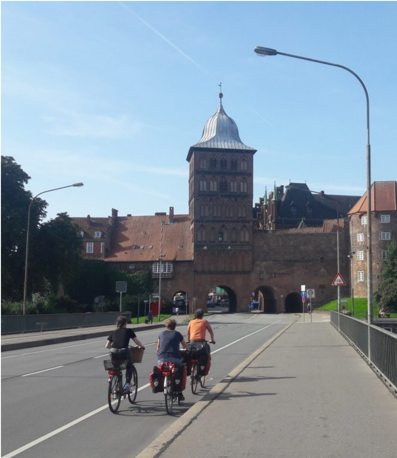
13de eeuwse Burgtor