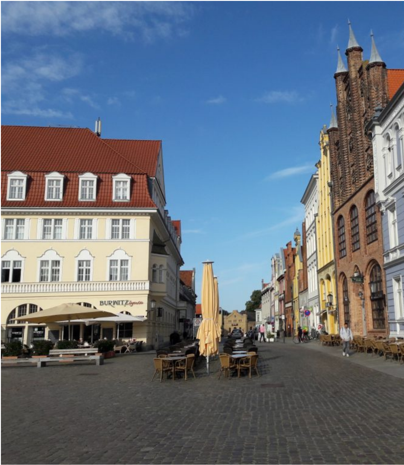
Marktplaats van Barth