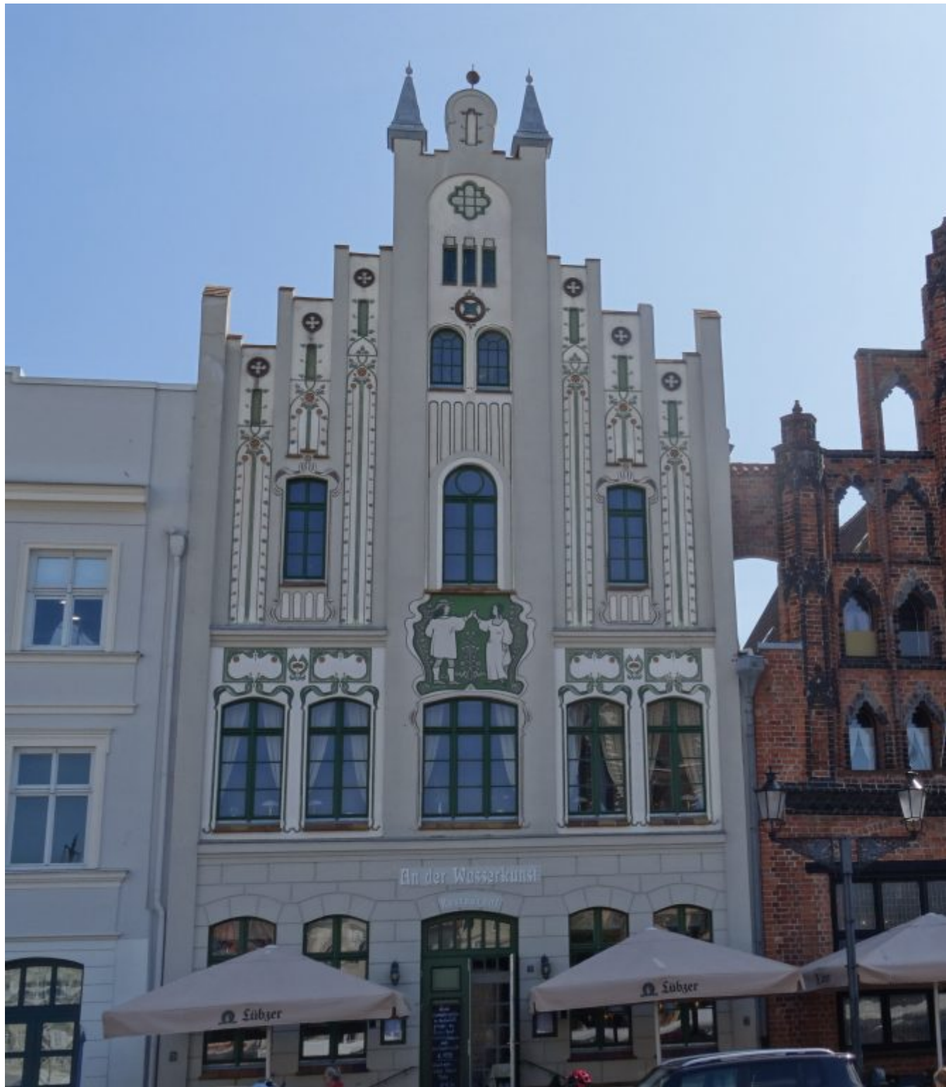
Alte Schwede uit 1380