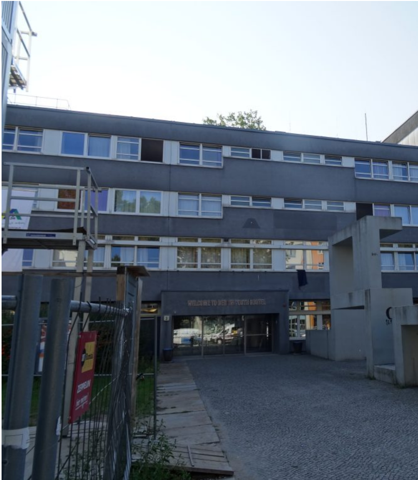
Jugendherberg Berlin City