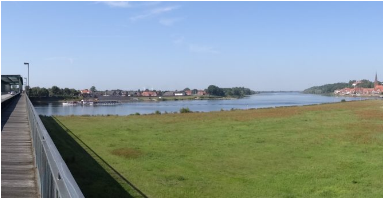
Elbe en Elbe-Lubeck kanaal