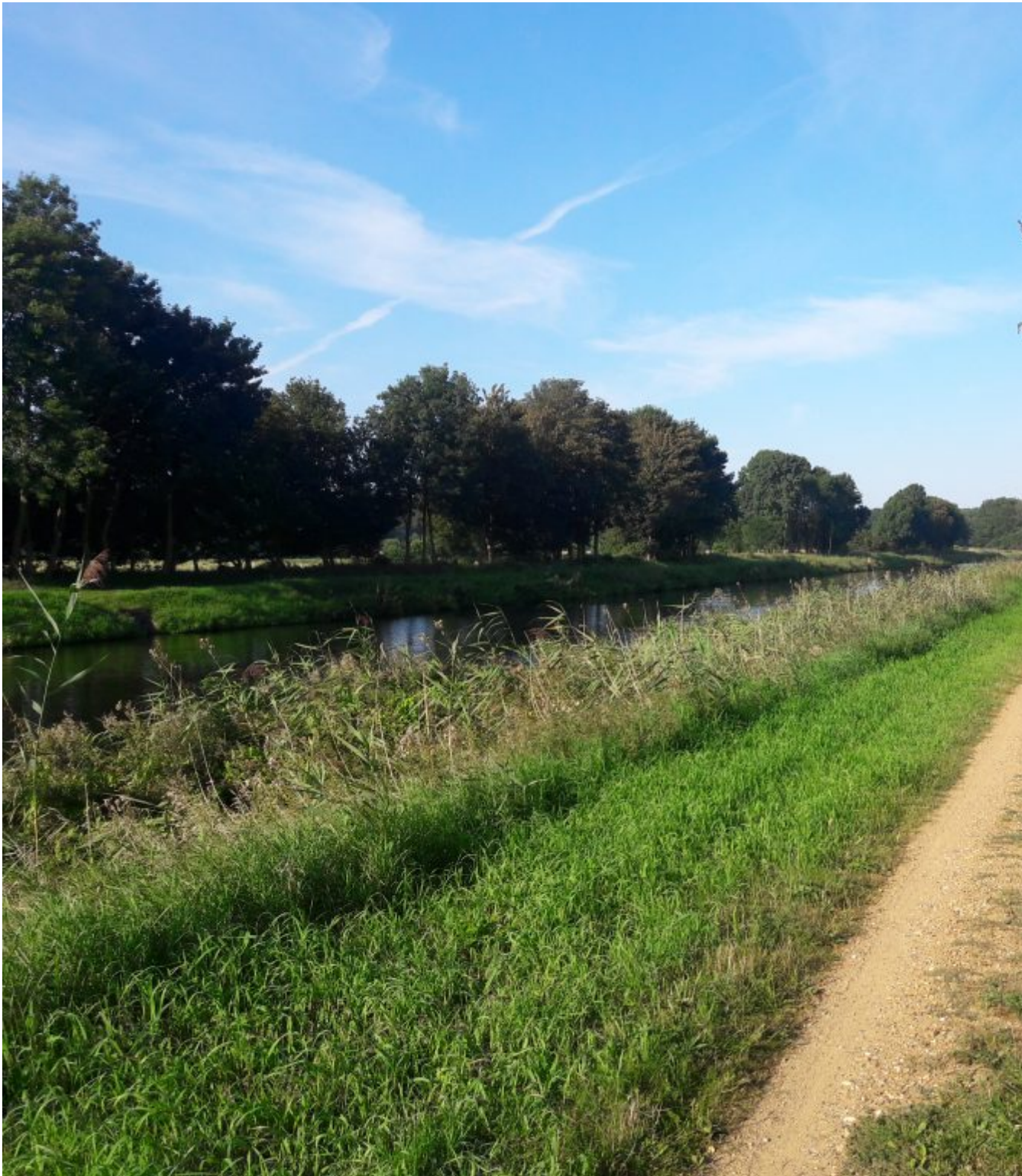
Langs Elbe-Lübeck kanaal