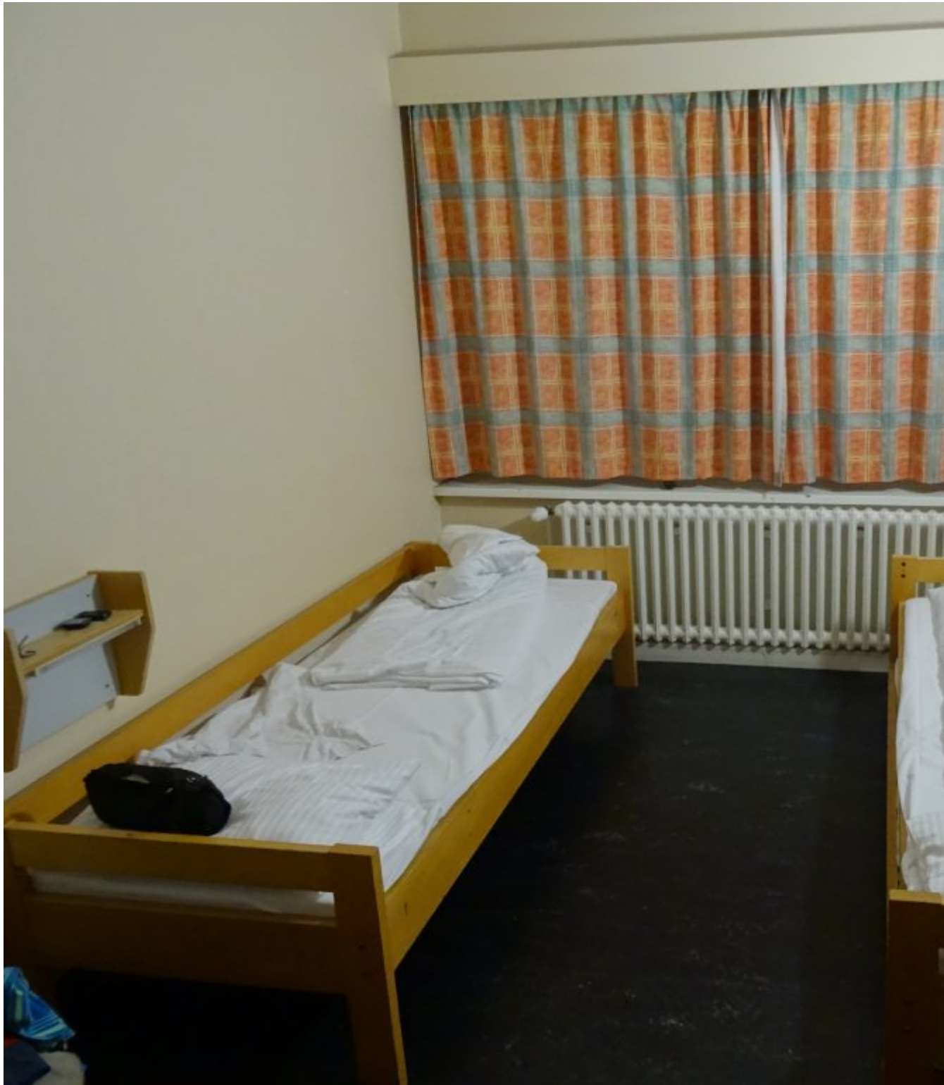
Het laatste echte bed