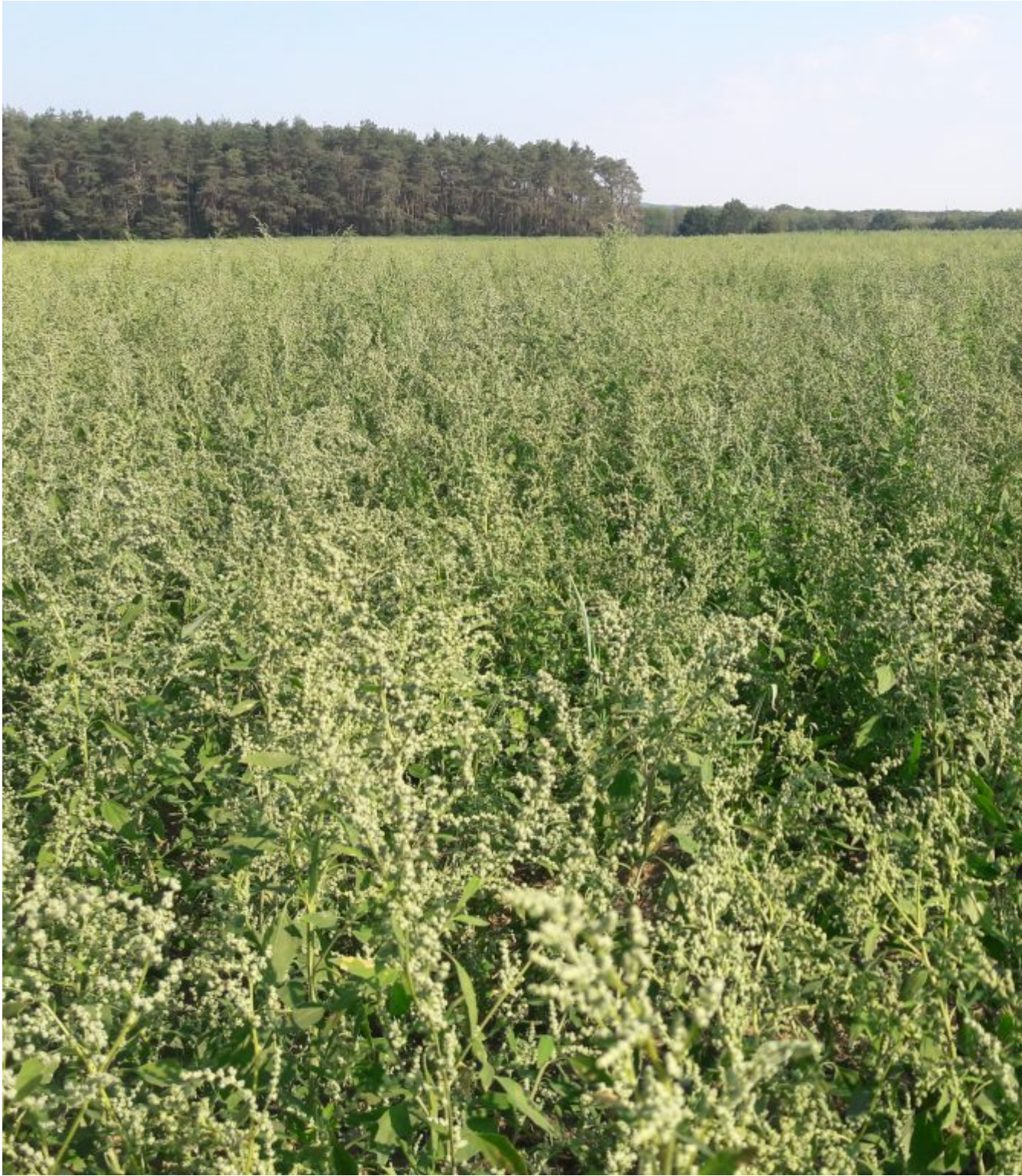
Veld met zuring