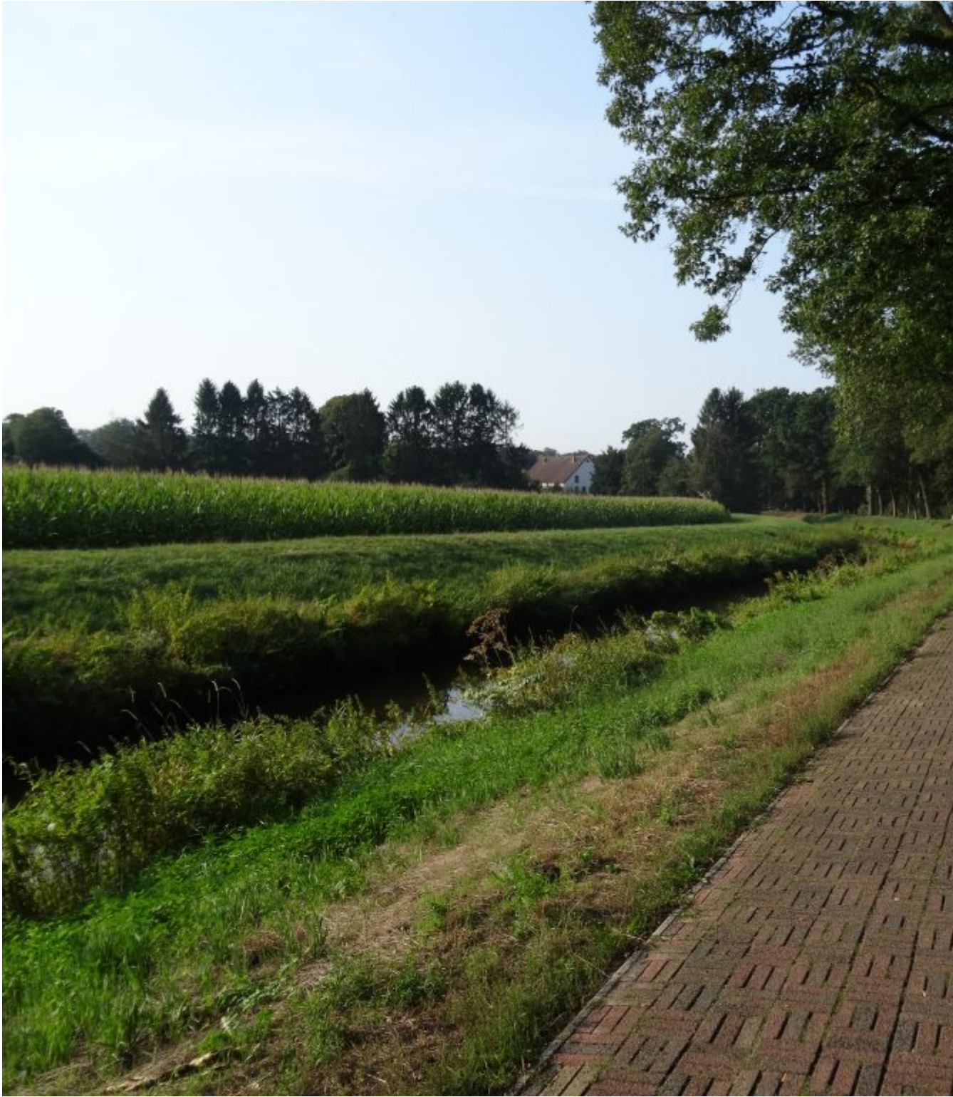
Langs rivier de Wörpe