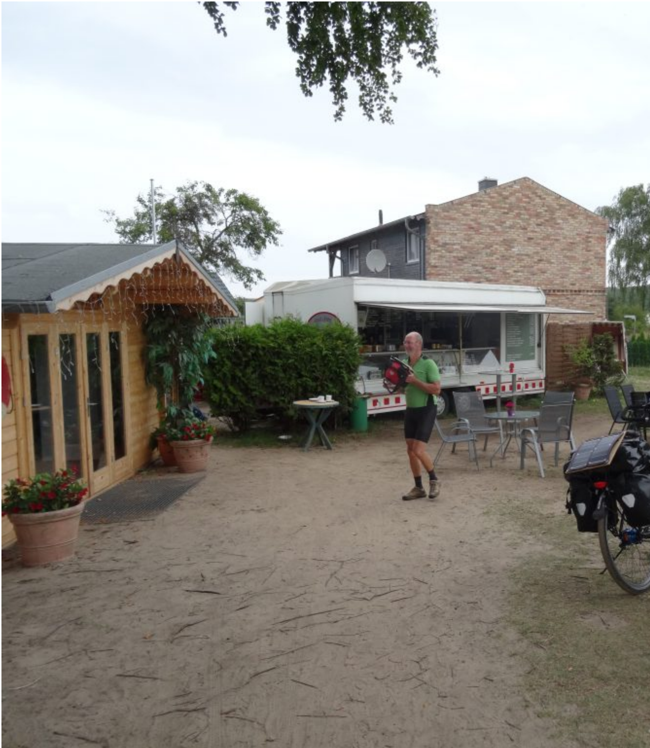
koffie met käsekuche