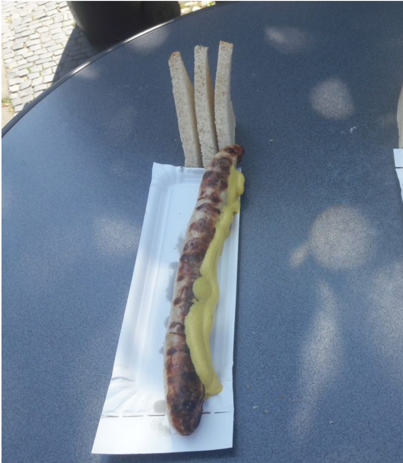
Eindelijk weer braadworst