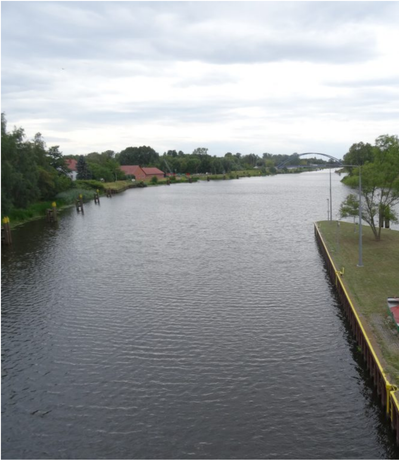
Oude en nieuwe Oder