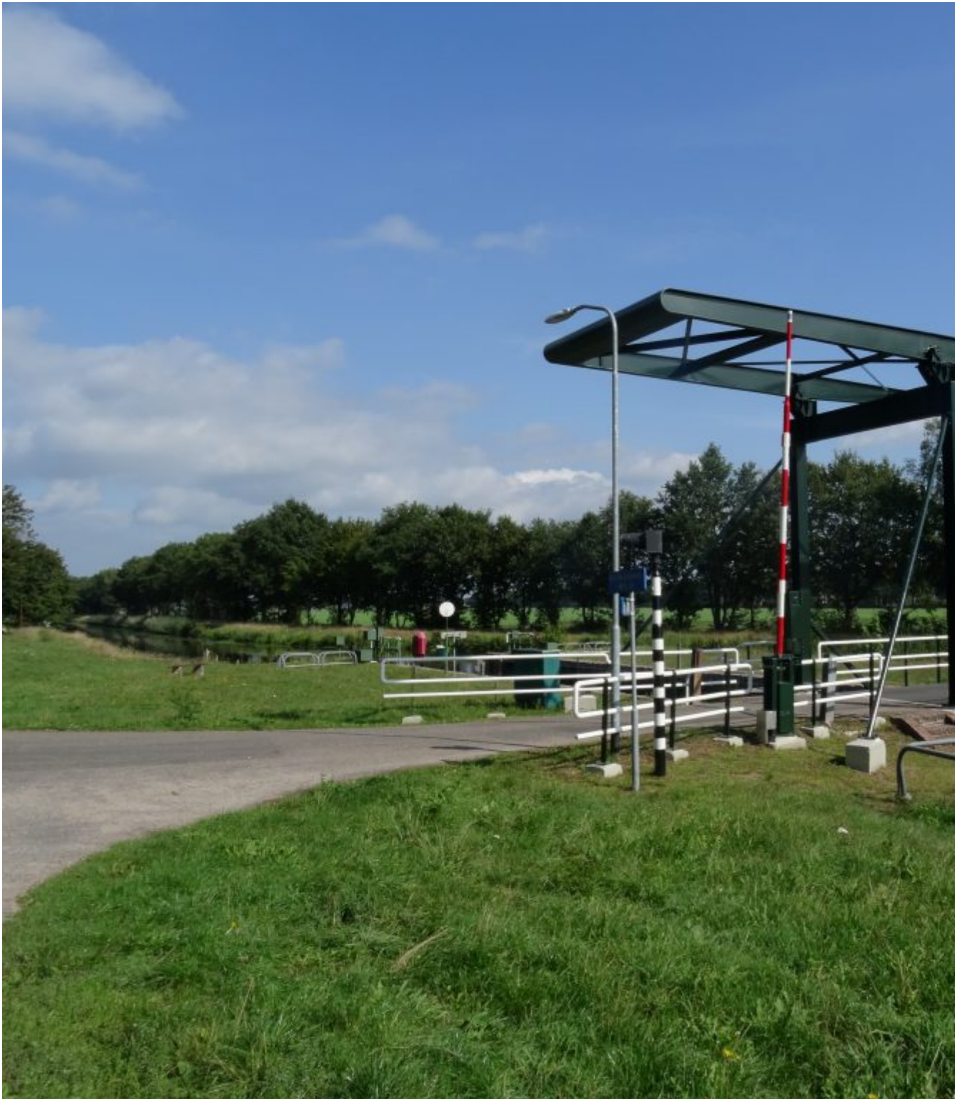
Brug over Ruiten-A