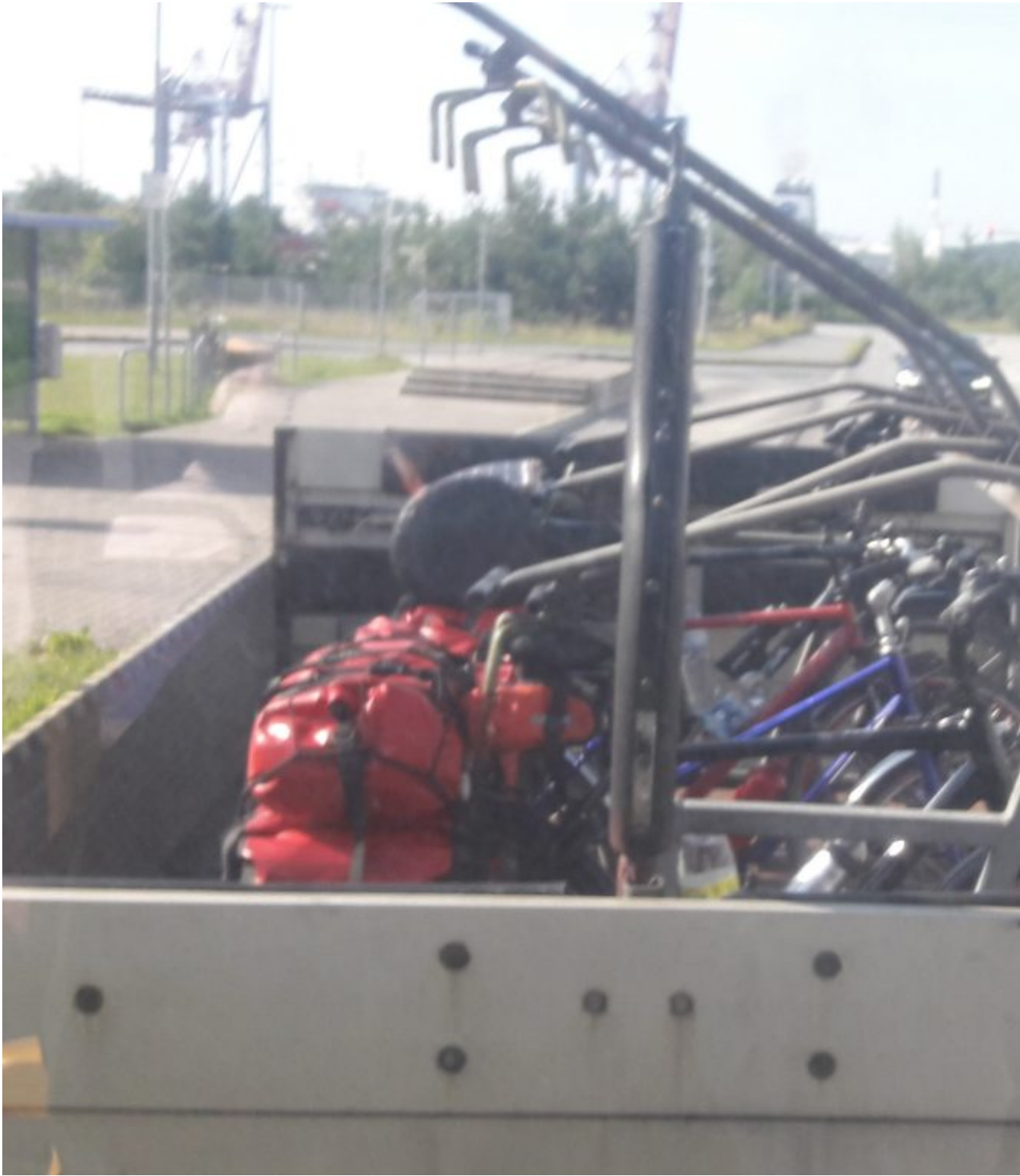
Gratis shuttle bus