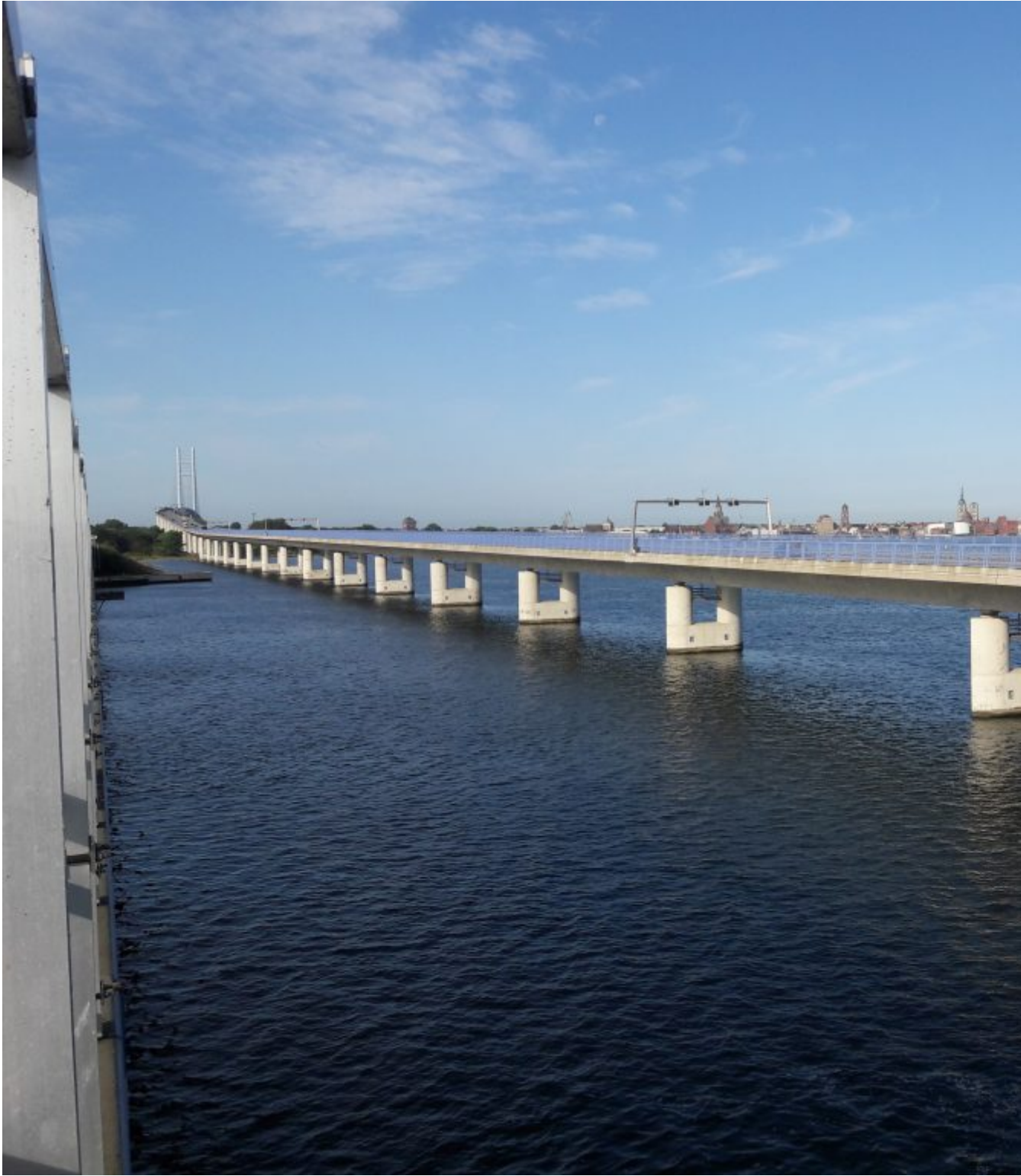
Rugenbrug 2830 m