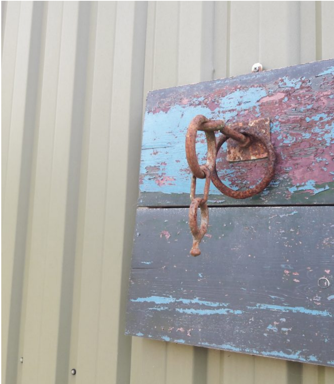
De koeienhaak van opa