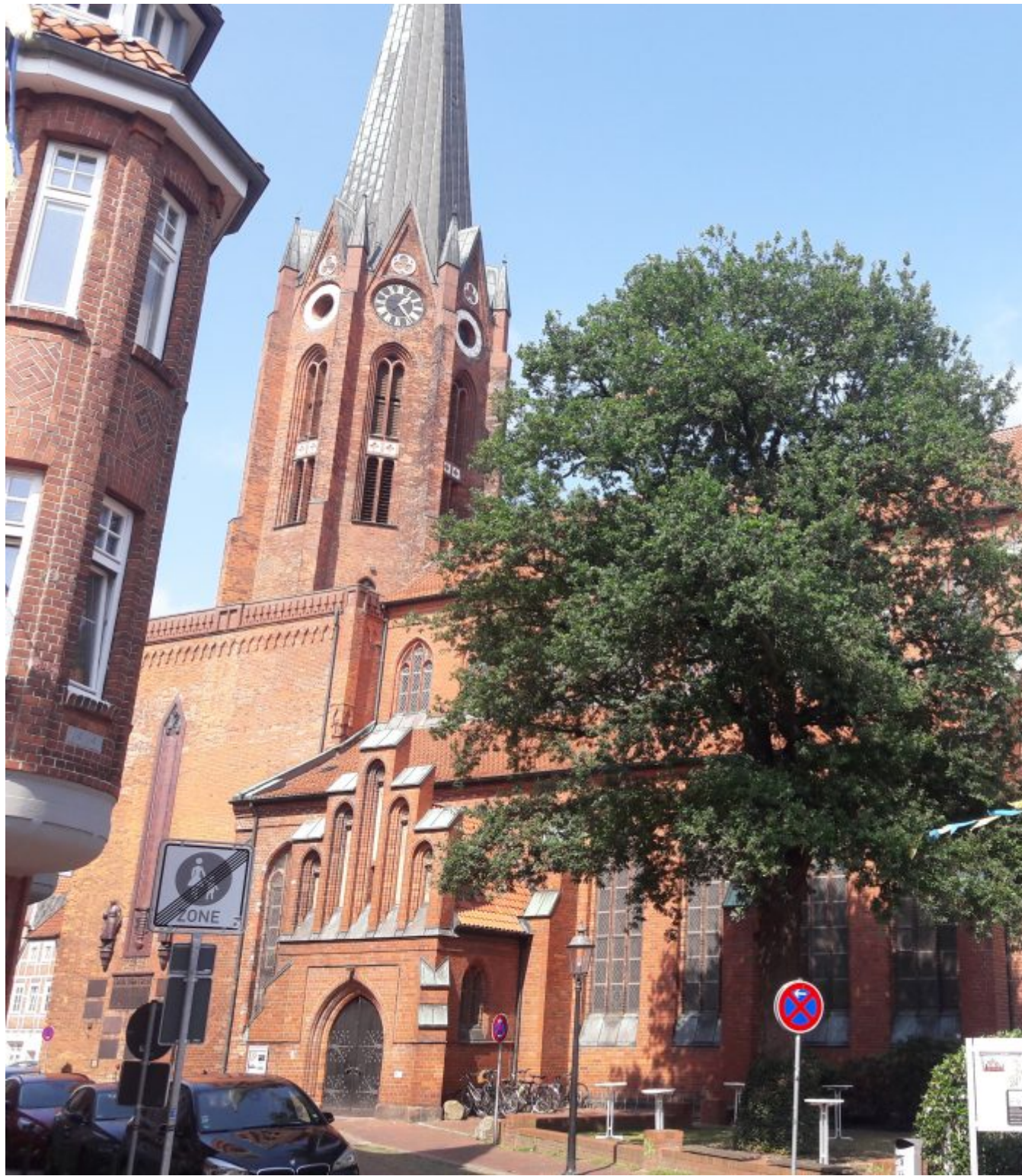
Gotische Petrikerk Buxtehude