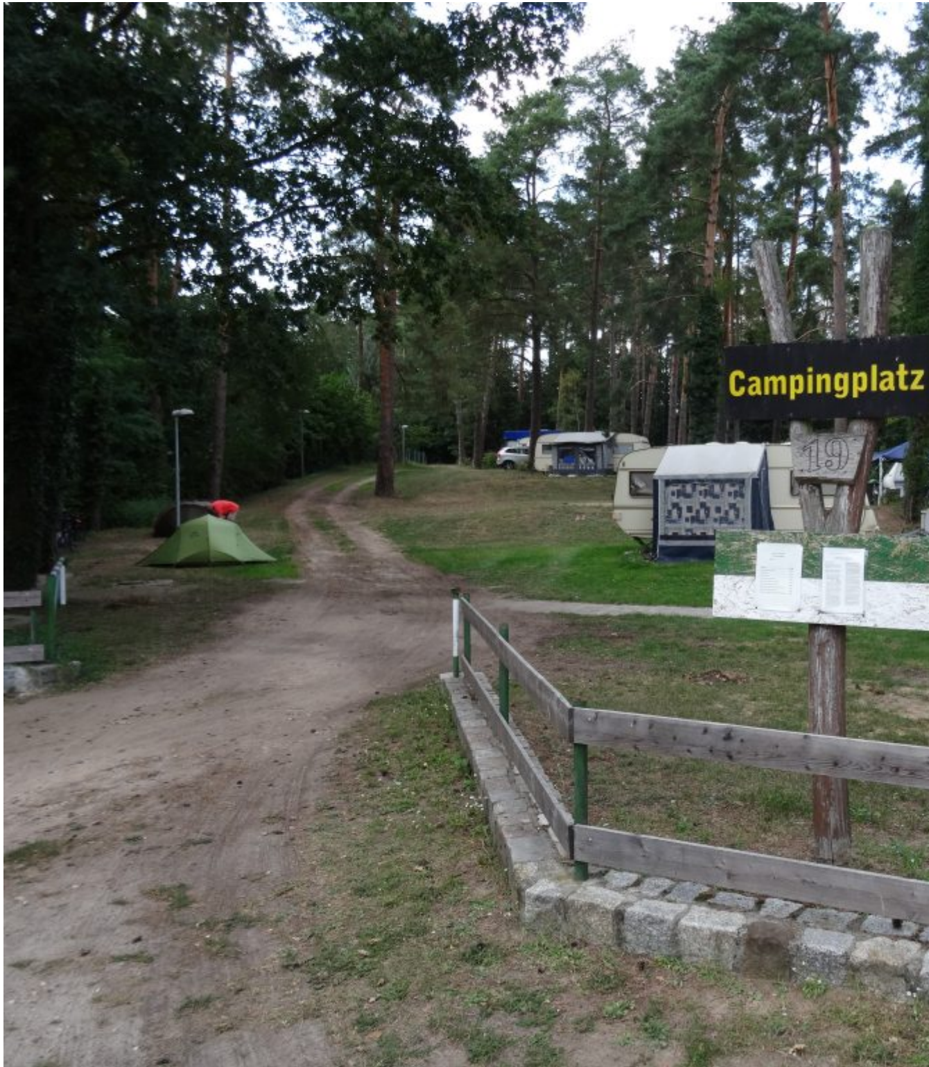
Camping in Waldsiefersdorf