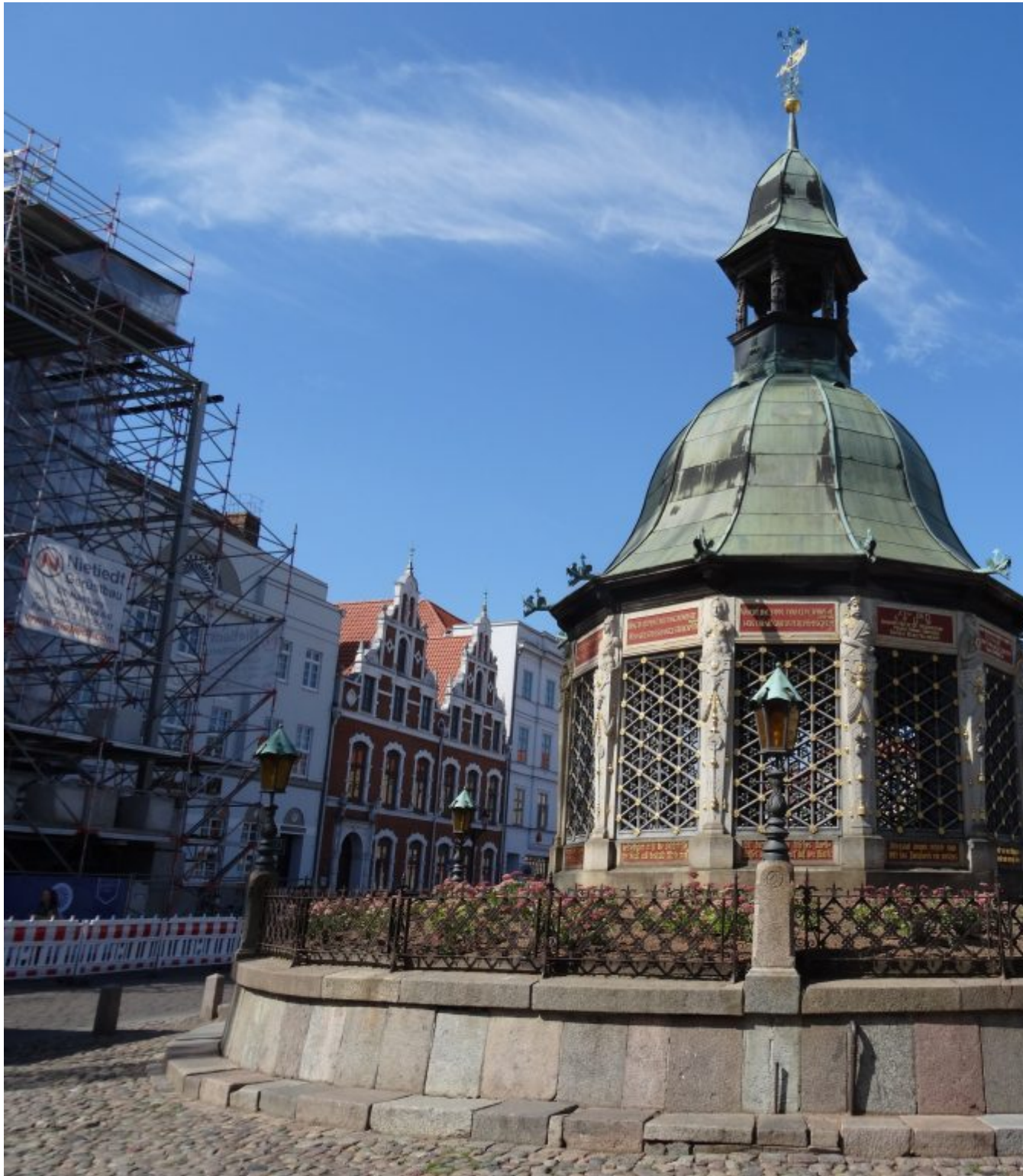
Pompstation uit 1602