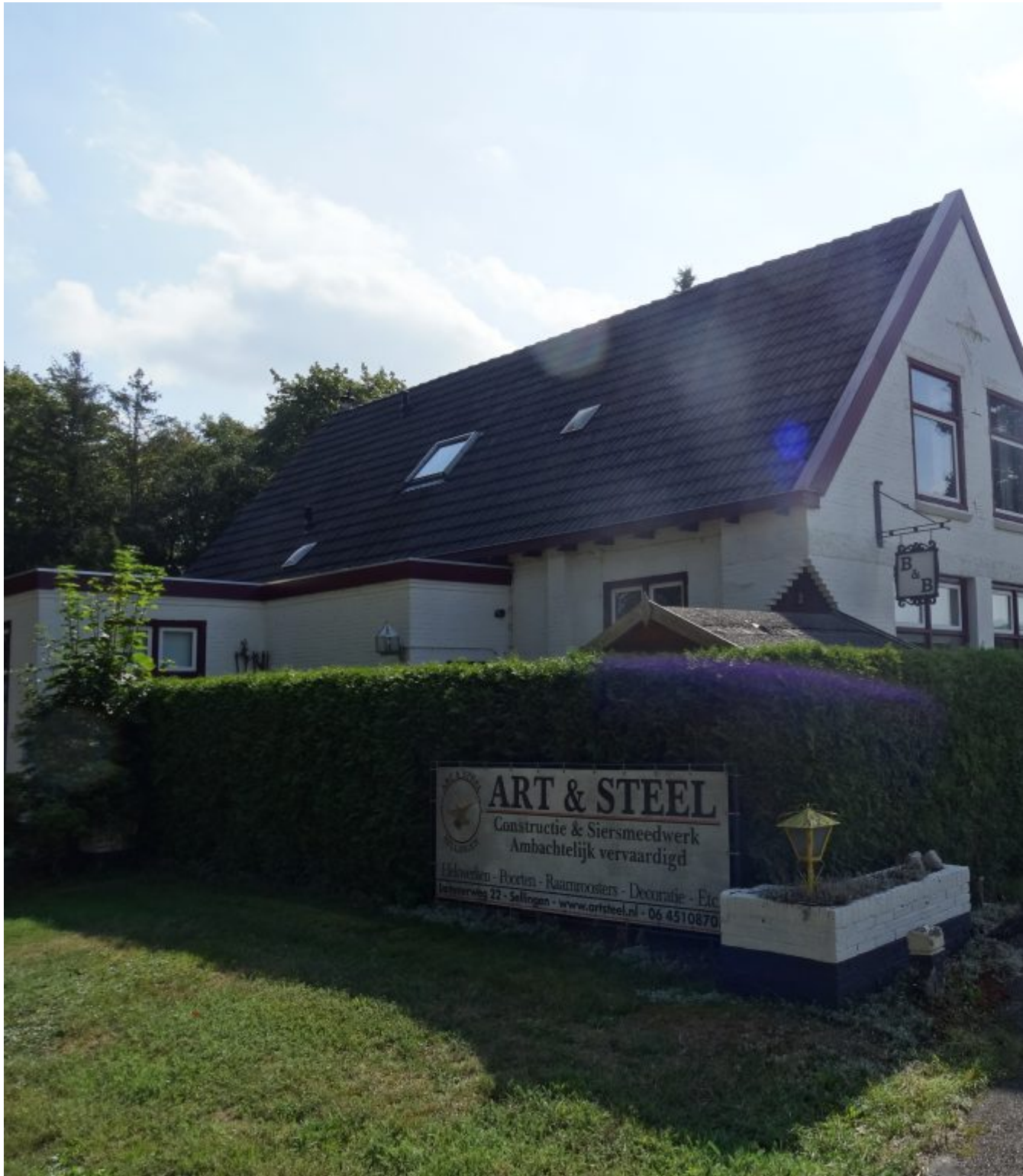
Café van de Wal