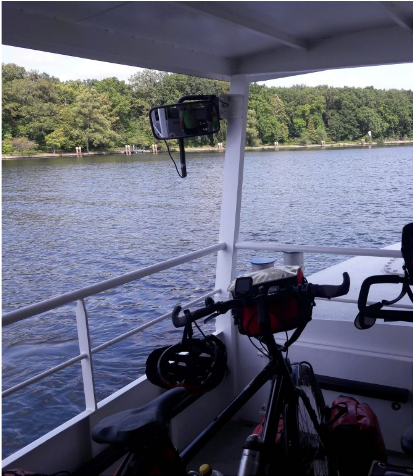
fietspontje over de Spree