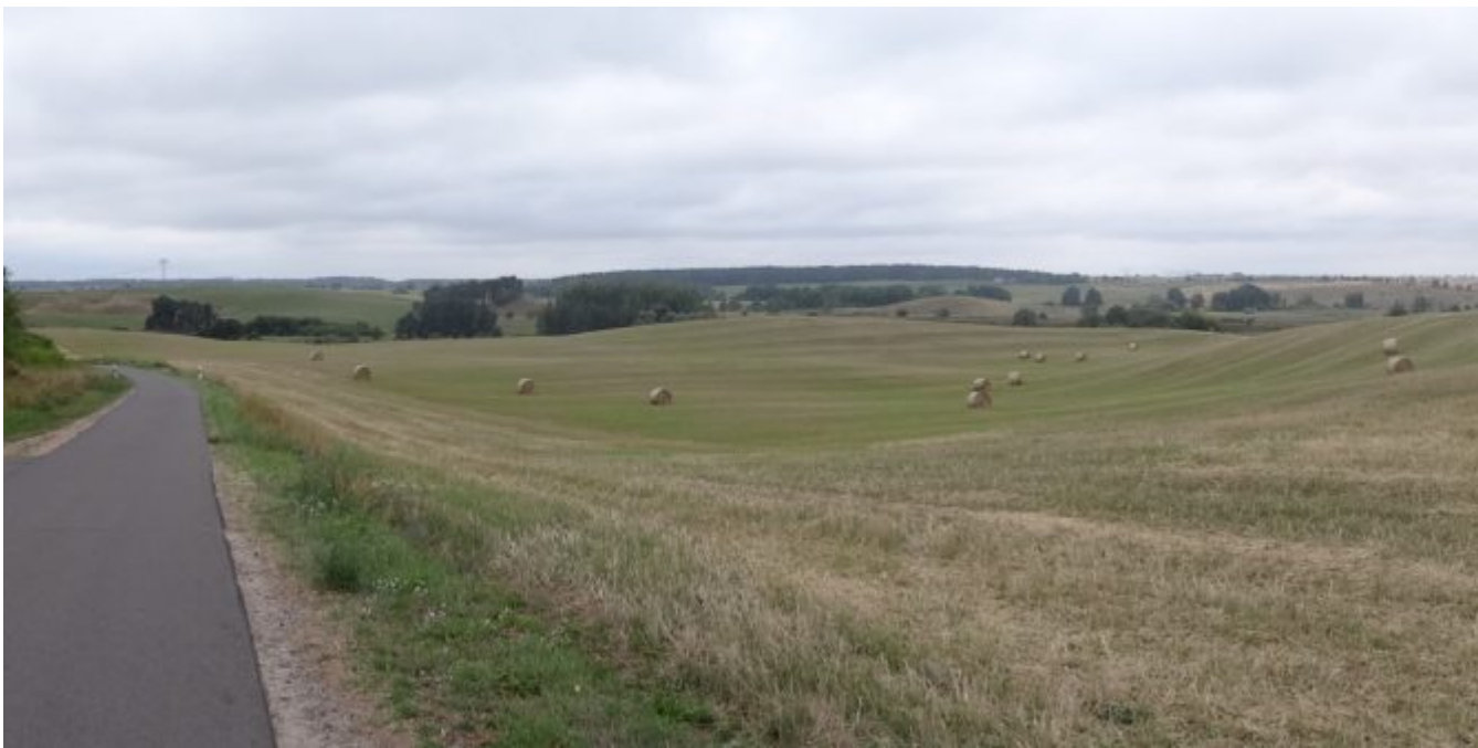
Heel veel landbouw