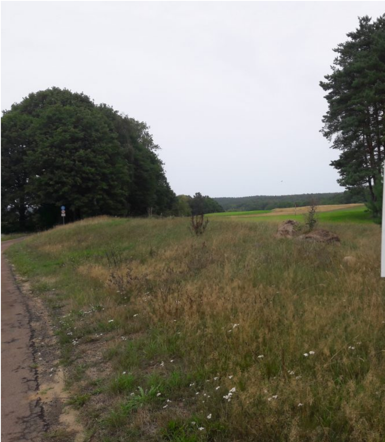
De eerste golfbaan