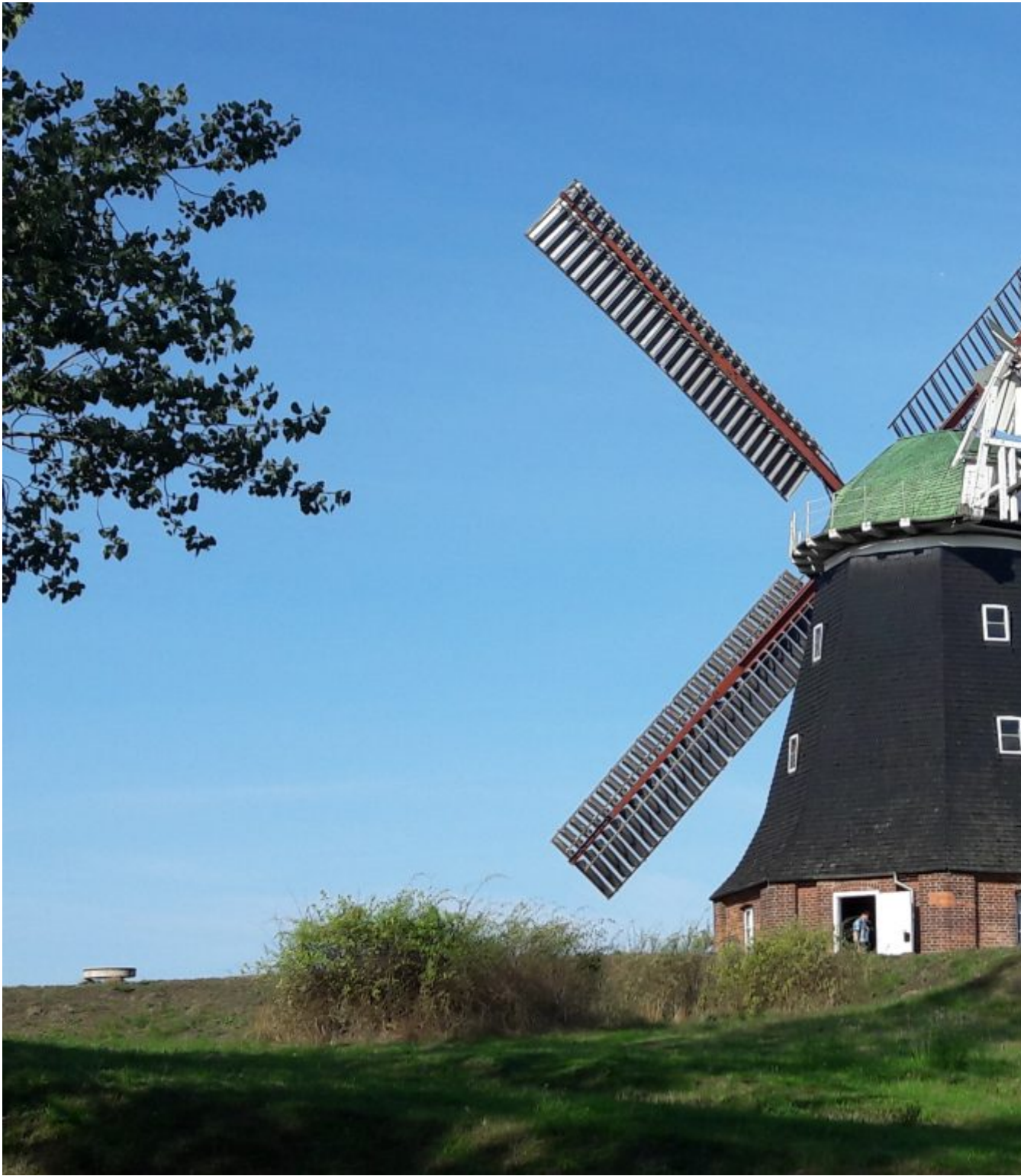
Holländermühle uit 1889