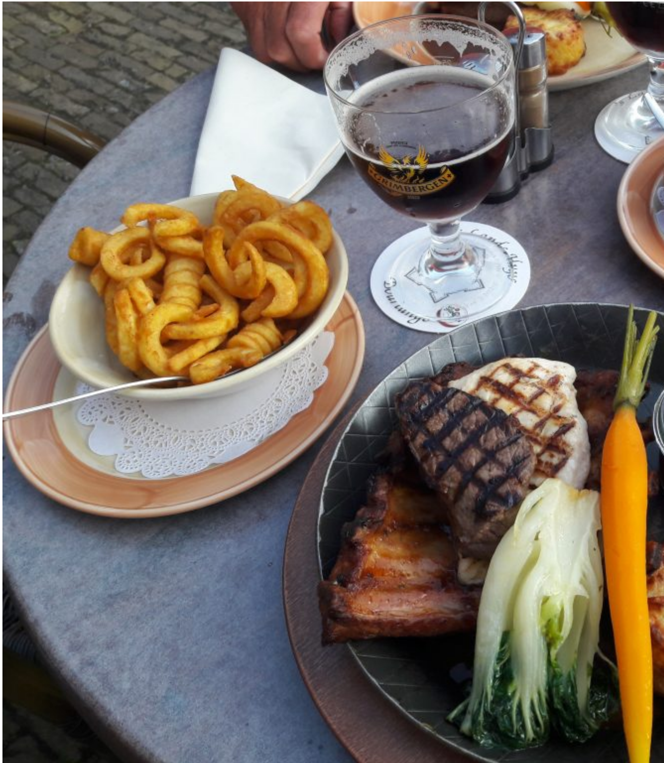
Het laatste maal