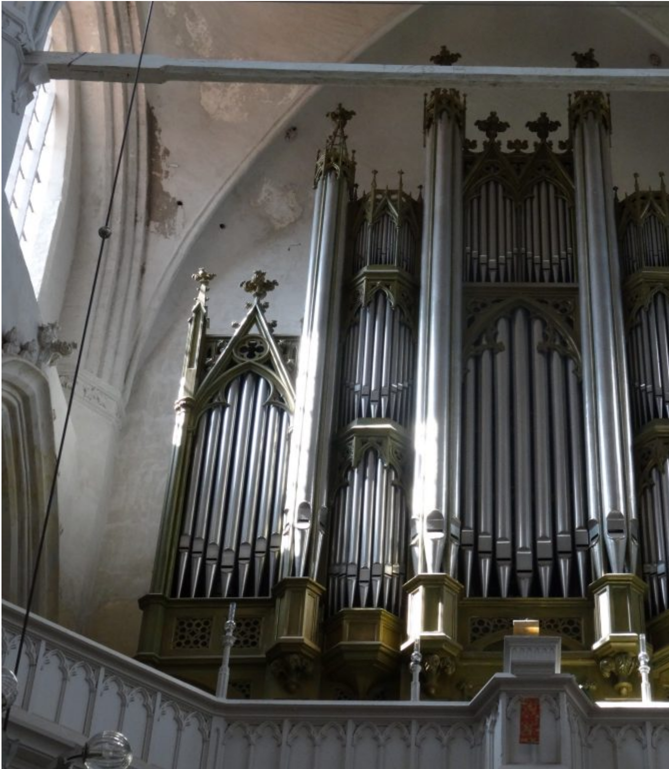
Dom St. Nicolai