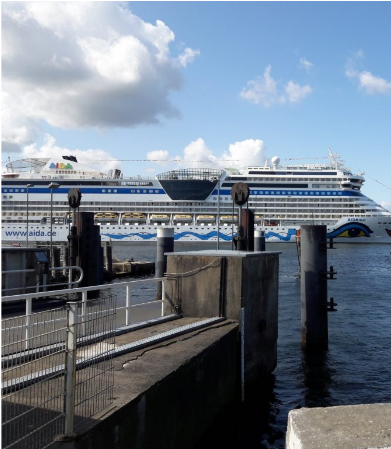
Pont over de Warne