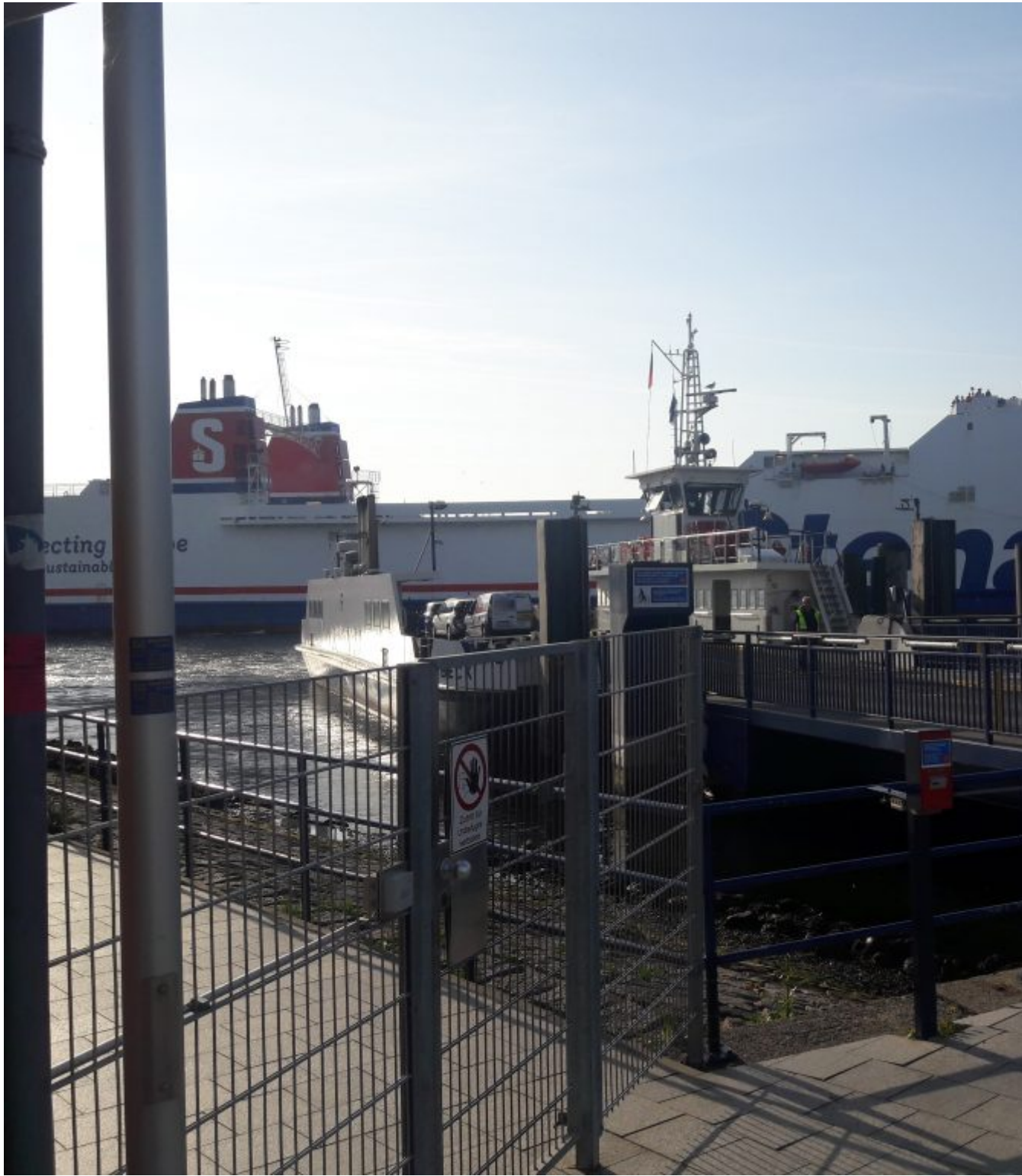
Pont naar Travemunde