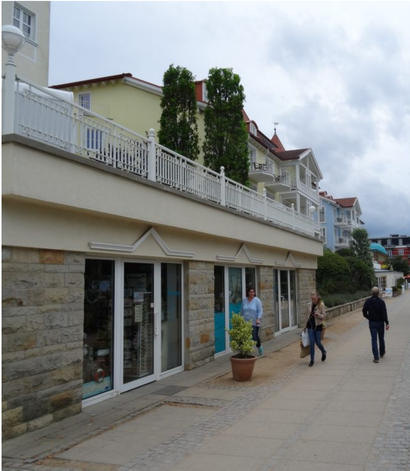
Boulevard van Zinnowitch