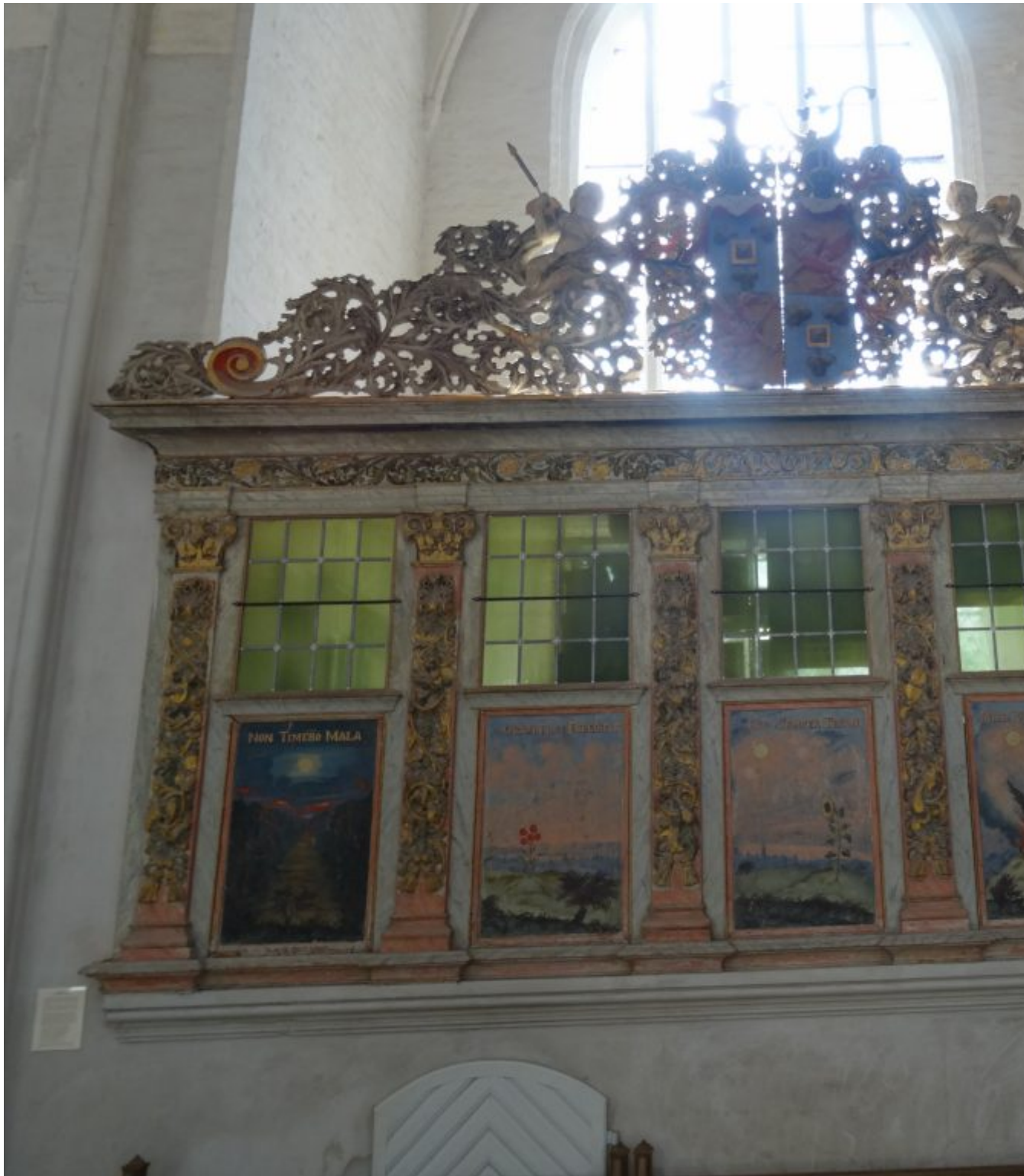
Dom St. Nicolai