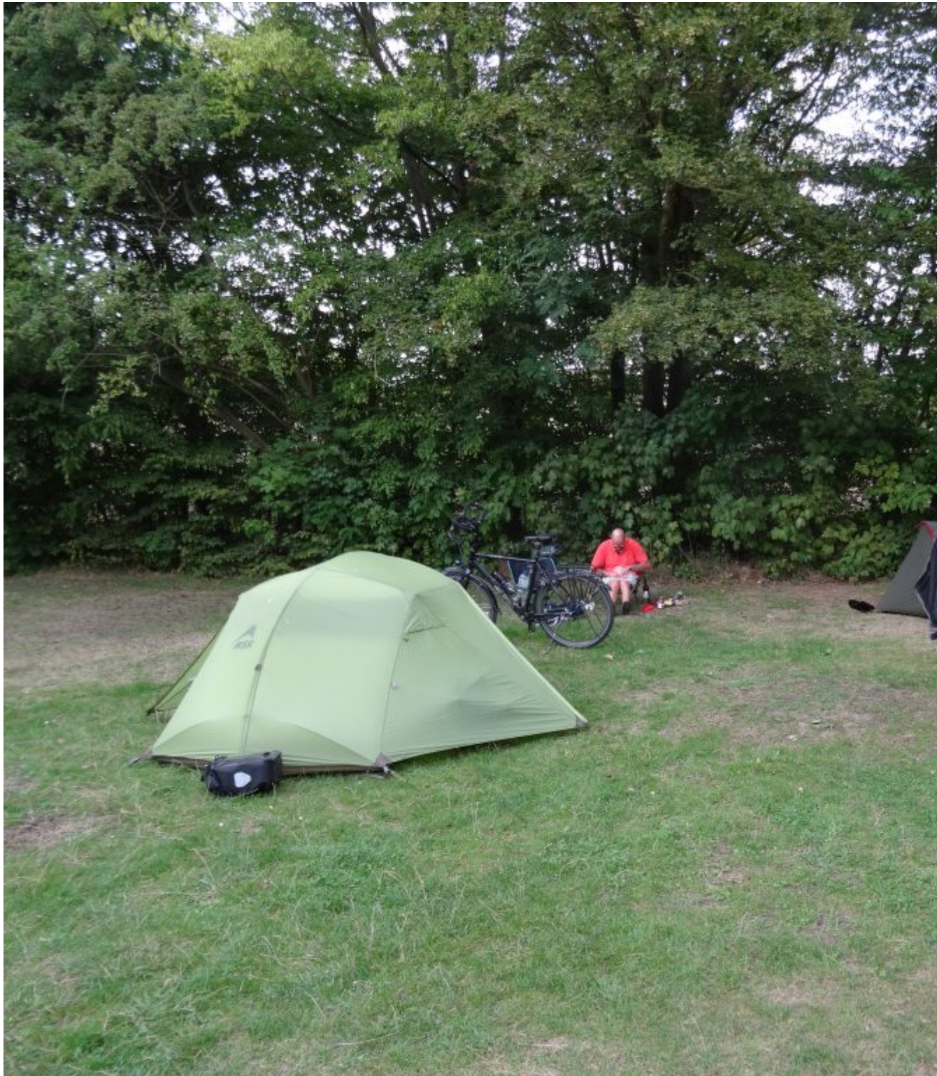
Camping Sund-Camp in Altefähr