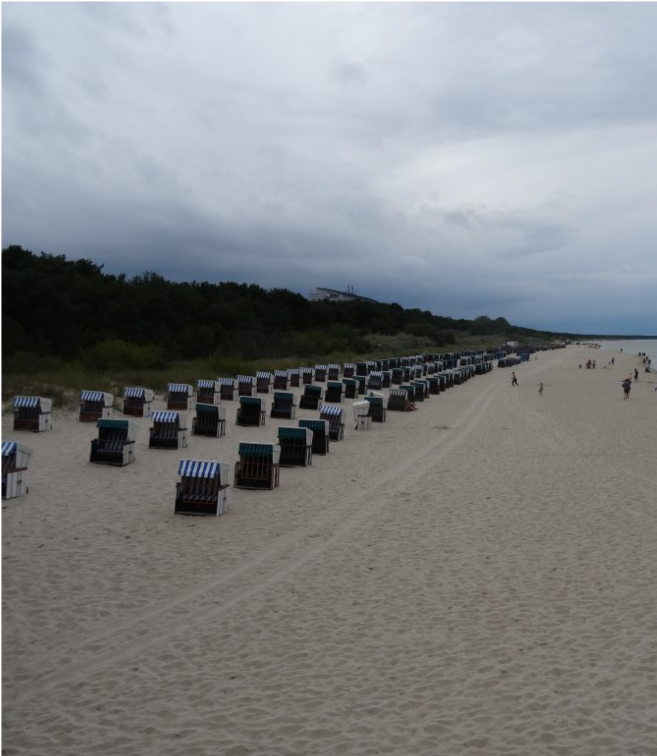
Strand bij Zinnowitz