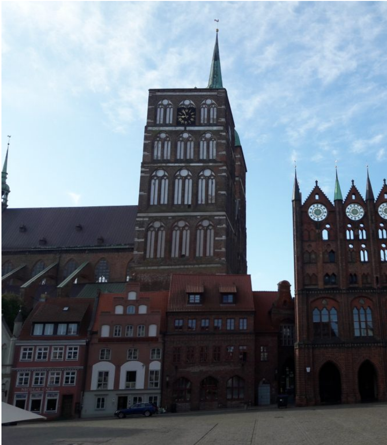
13de eeuwse raadhuis