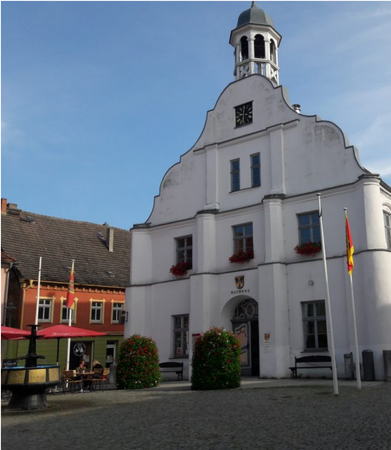
Barokke raadhuis 1718