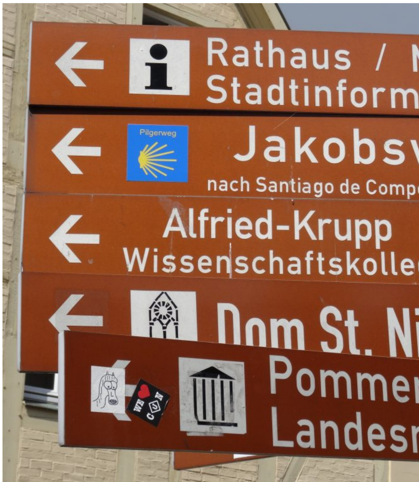
Jacobsweg 3400 km