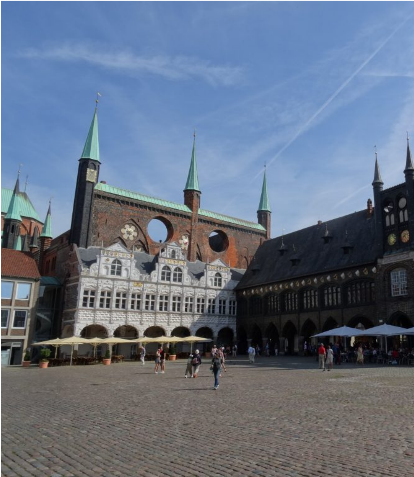
Raadhuis uit 1484