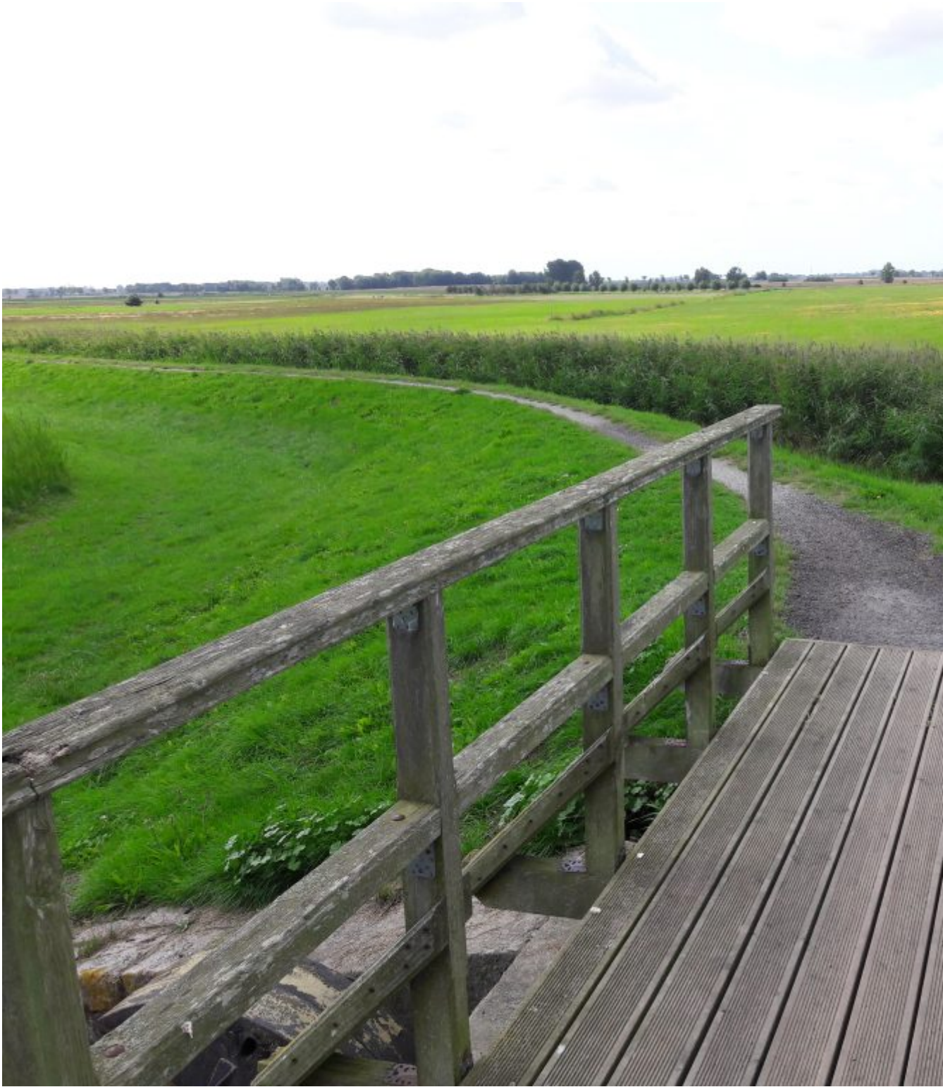
Langs Barther Bodden