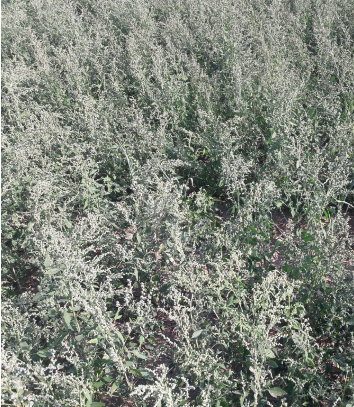
Veld met zuring