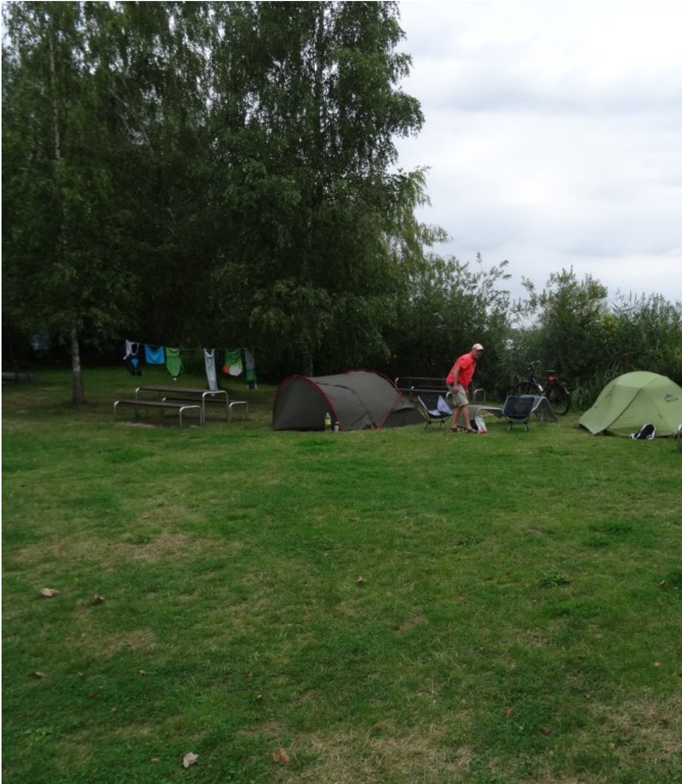
Havencamping aan de Peene