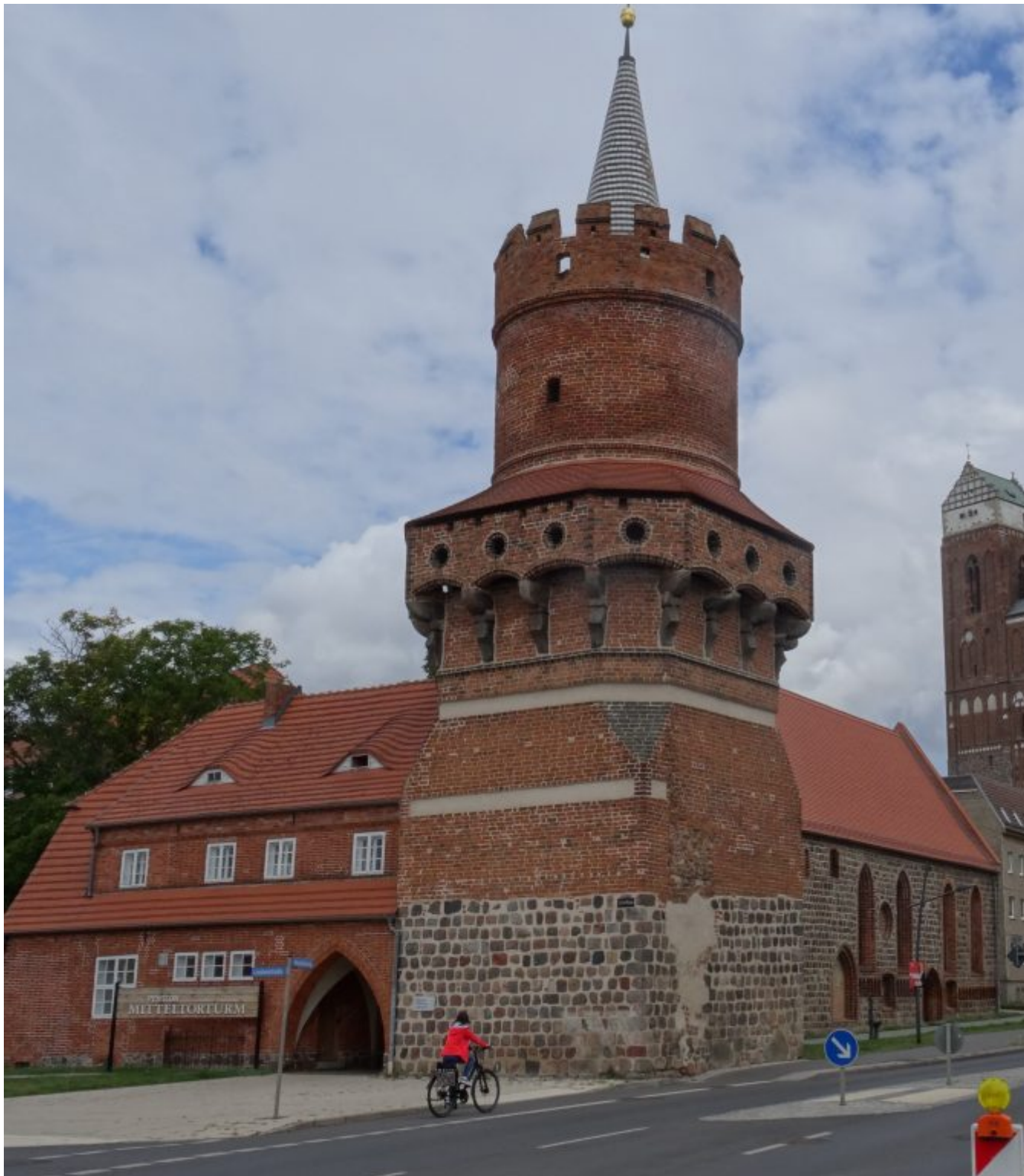
Prenzlau met Mittelorturm