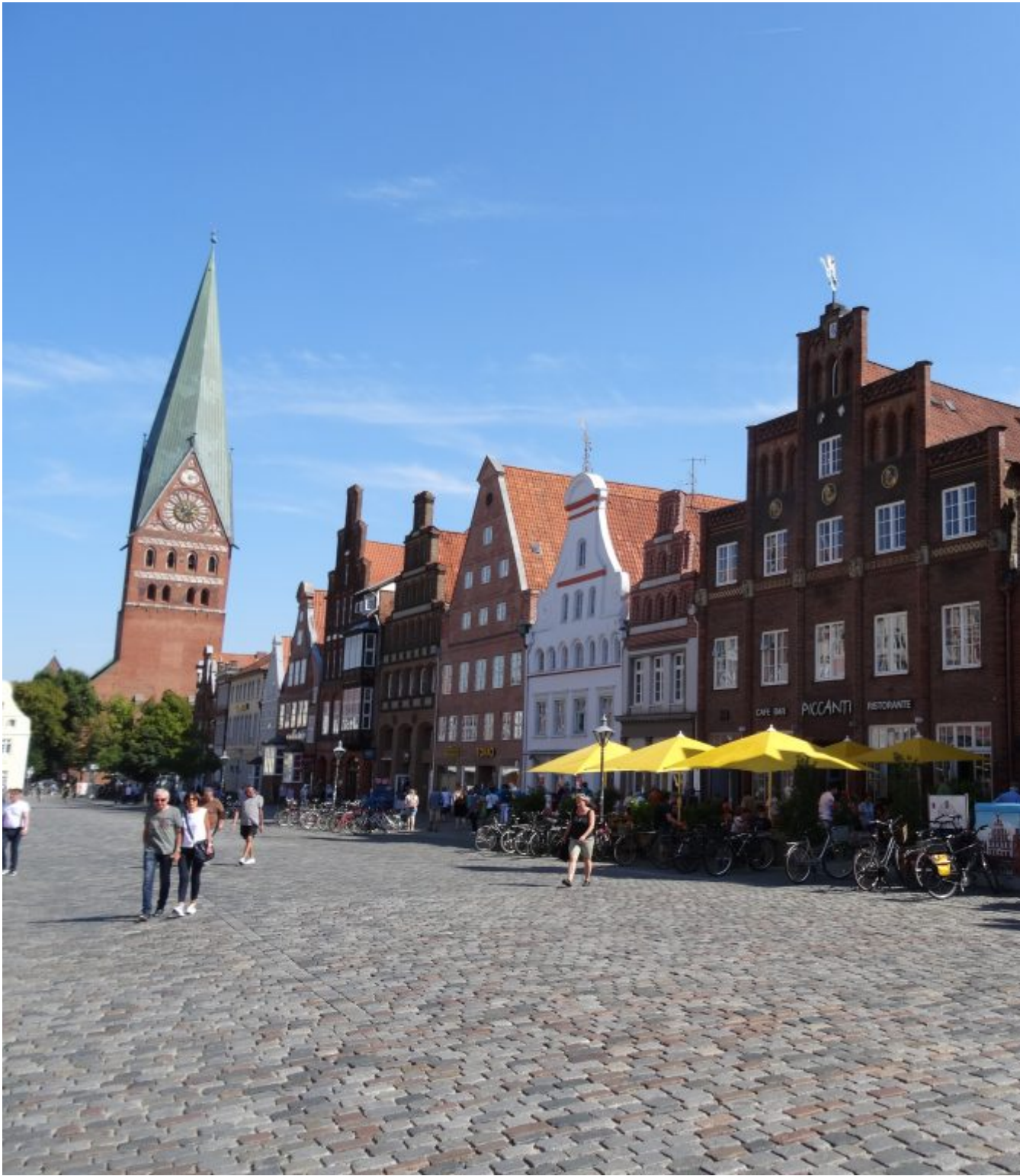
Plein Am Sande