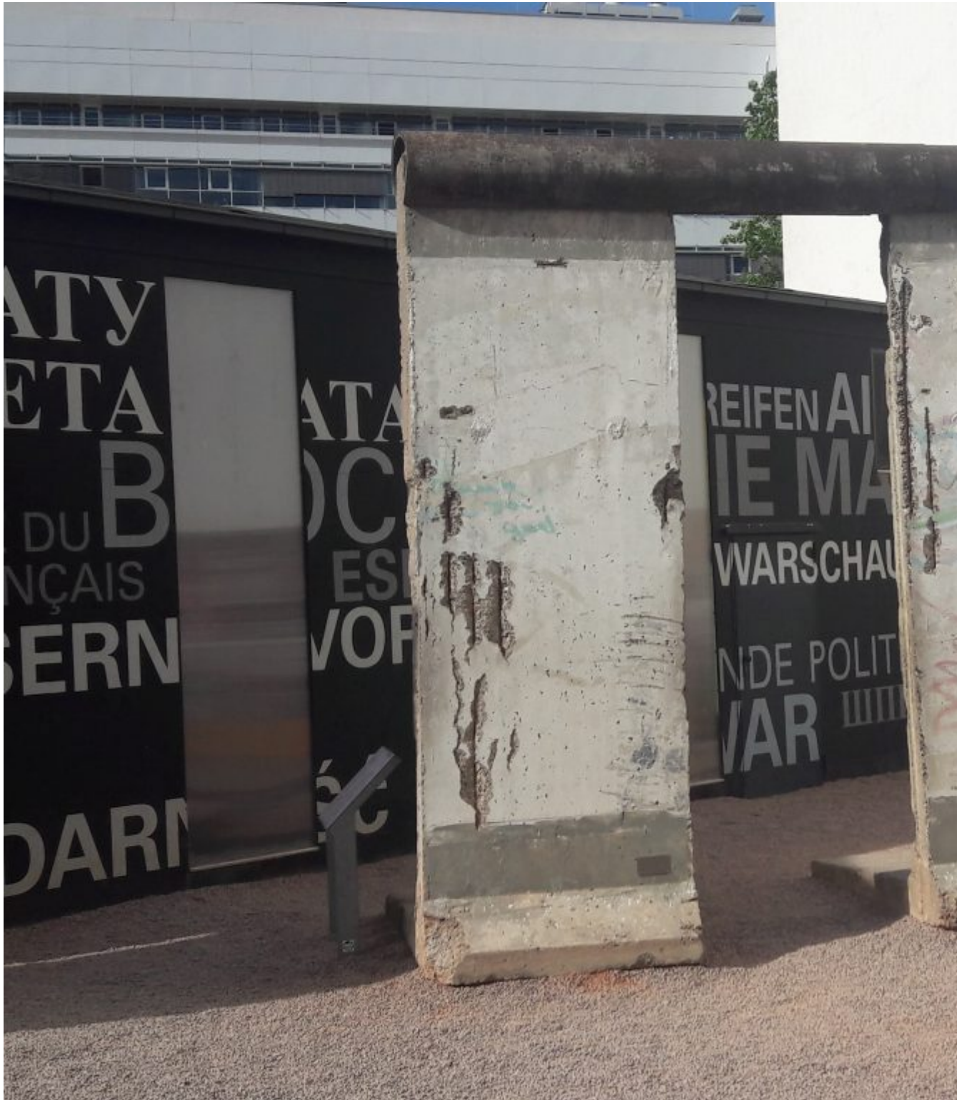
De Berlijnse muur