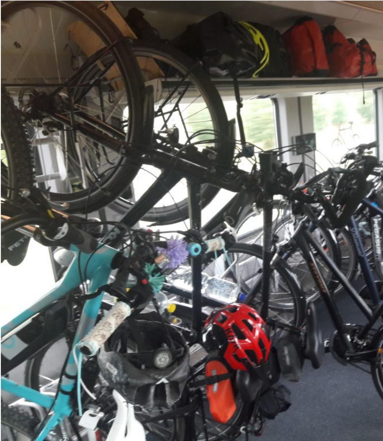
In de Duitse trein