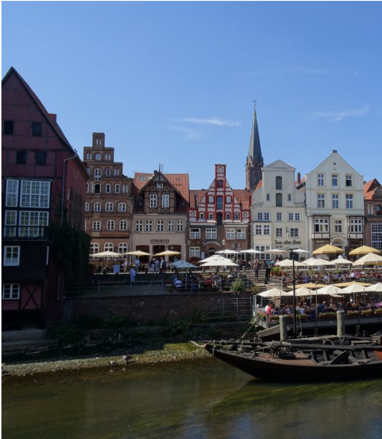
Lüneberg langs de rivier