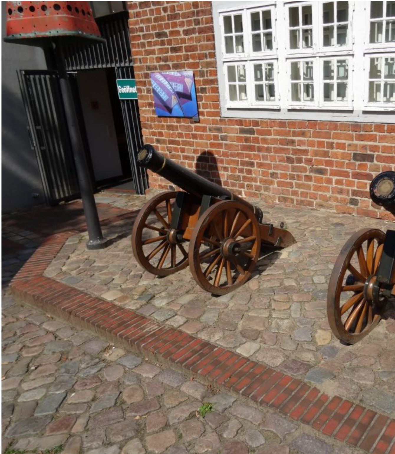
Kanonnen bij de Zwinger