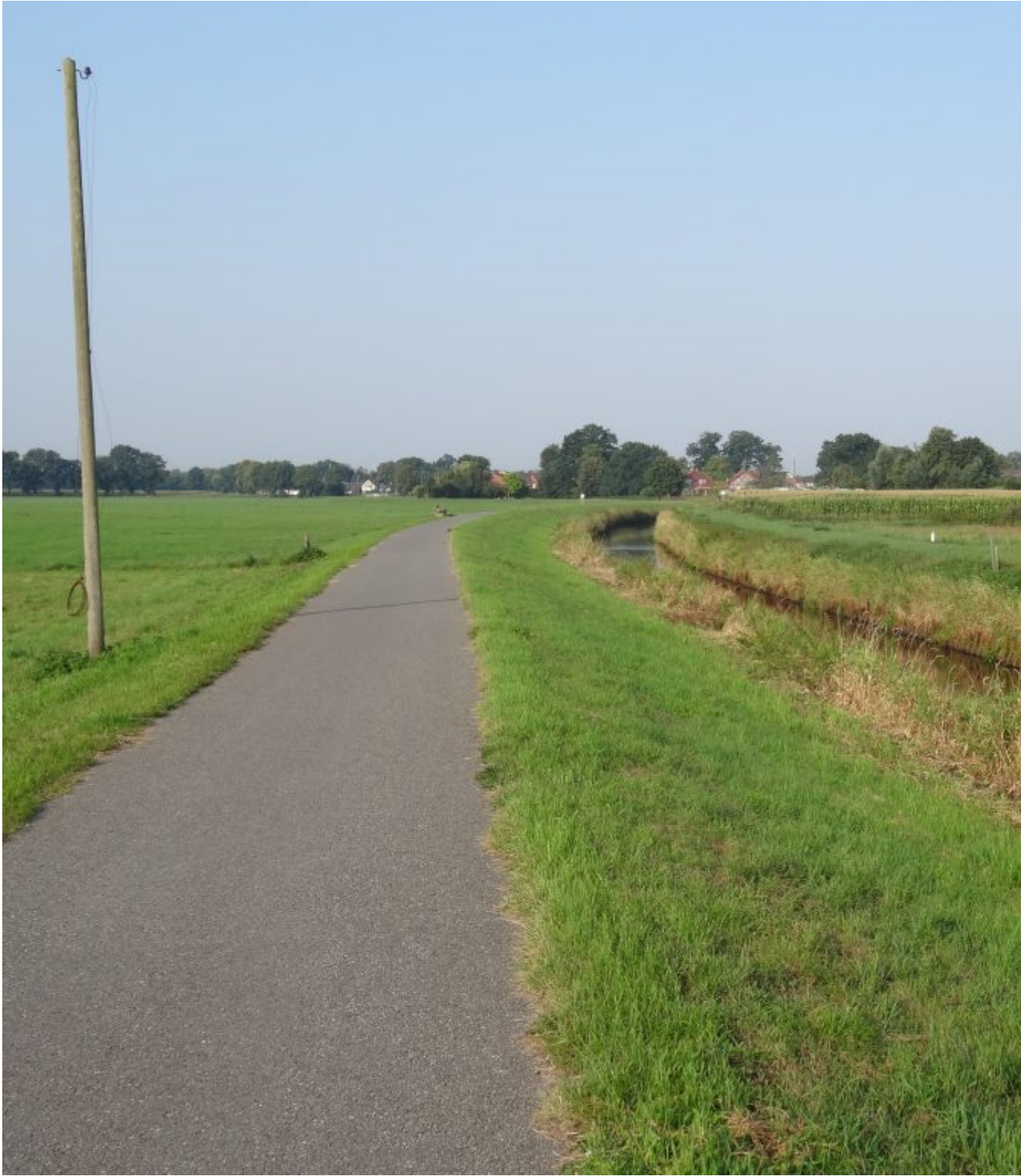
Langs rivier de Wörpe