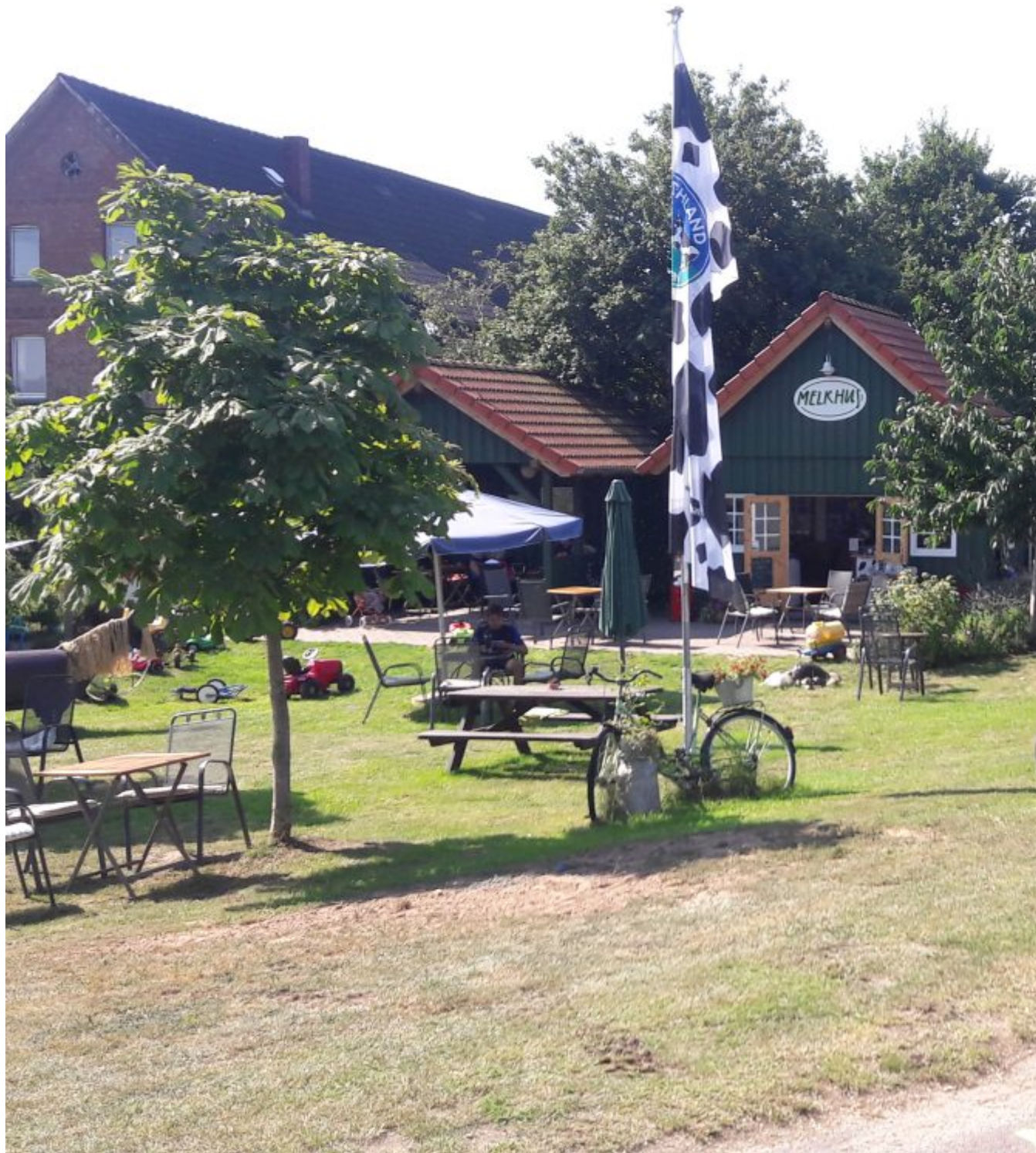
Koffie langs Elbe-radweg