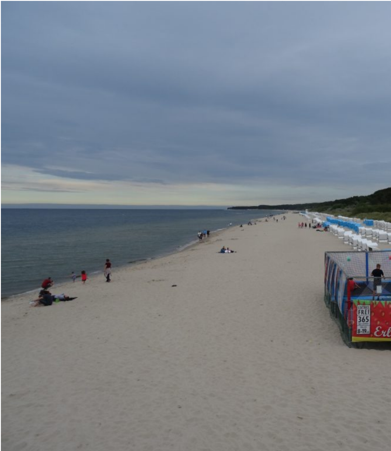
Strand bij Zinnowitch