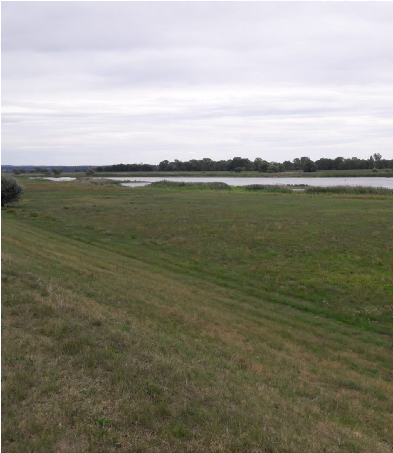
Grensrivier de Oder