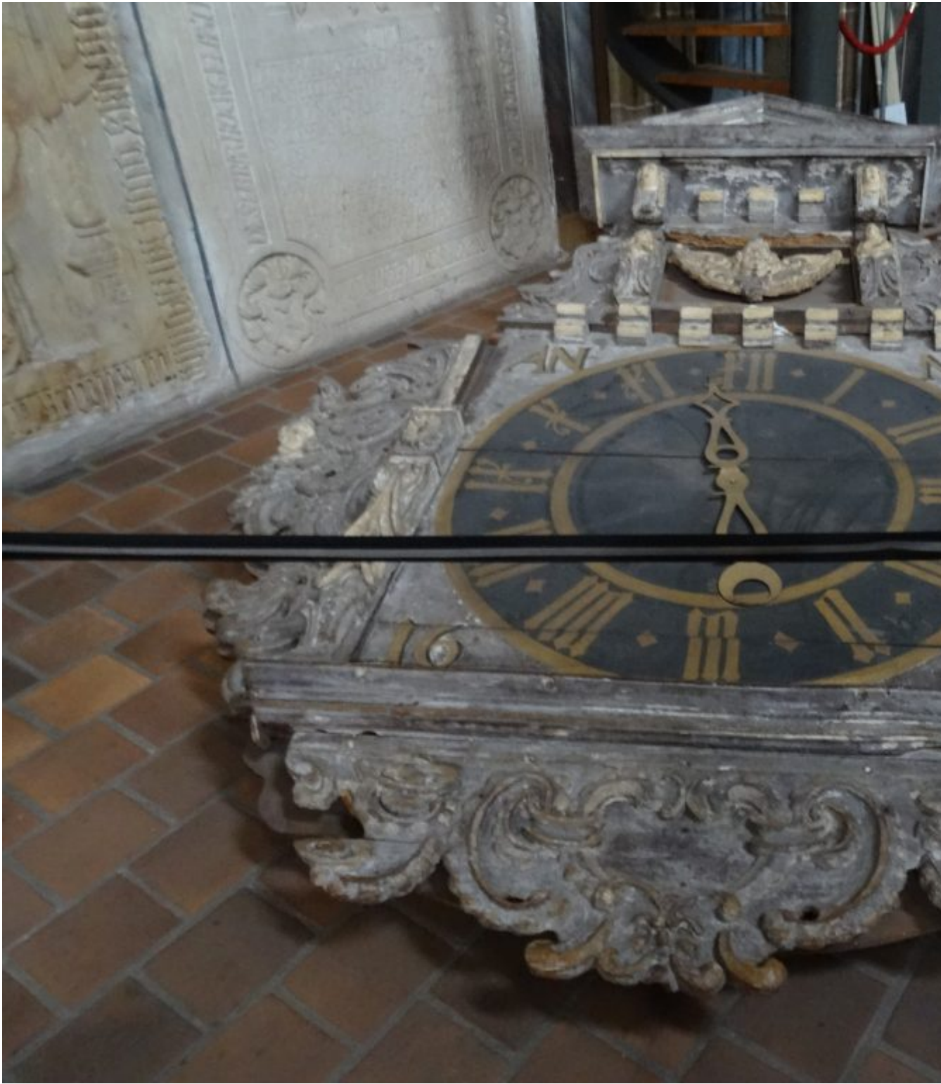
Dom St. Petri