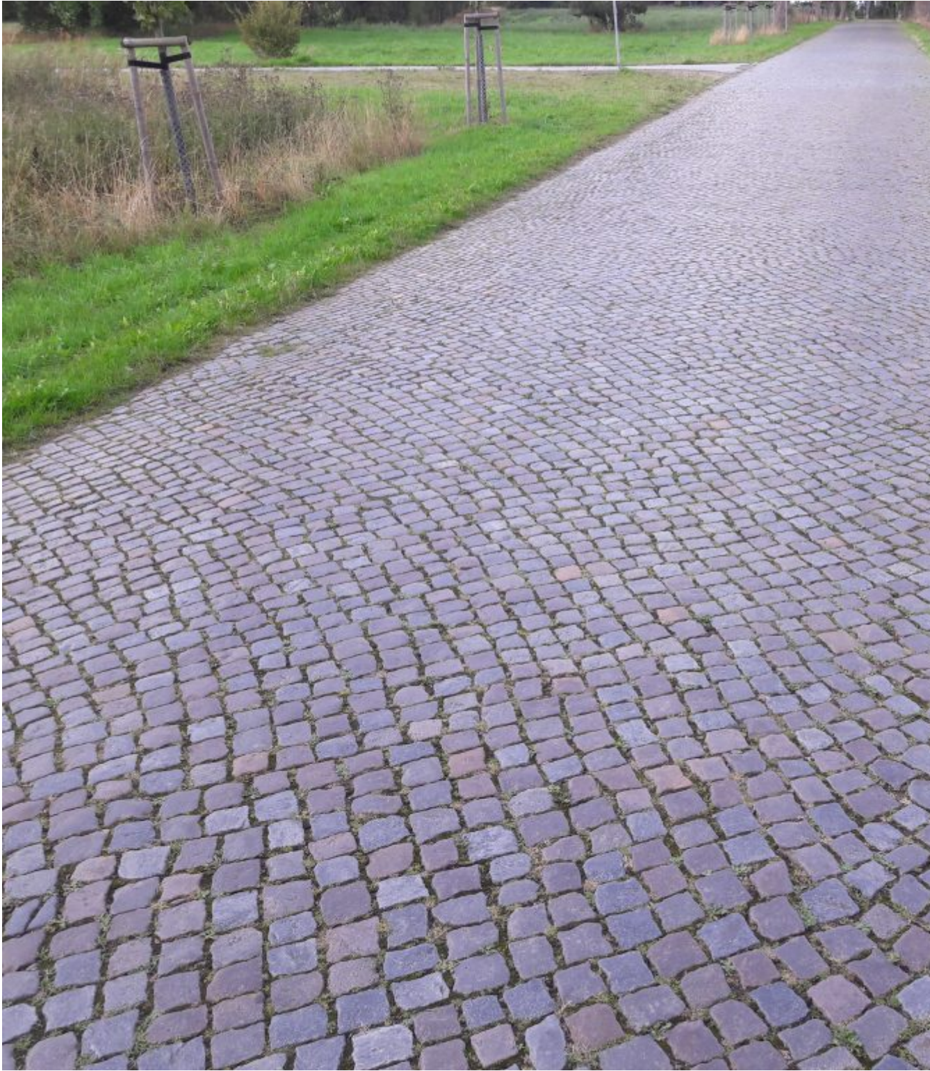
26 km kinderkopjes