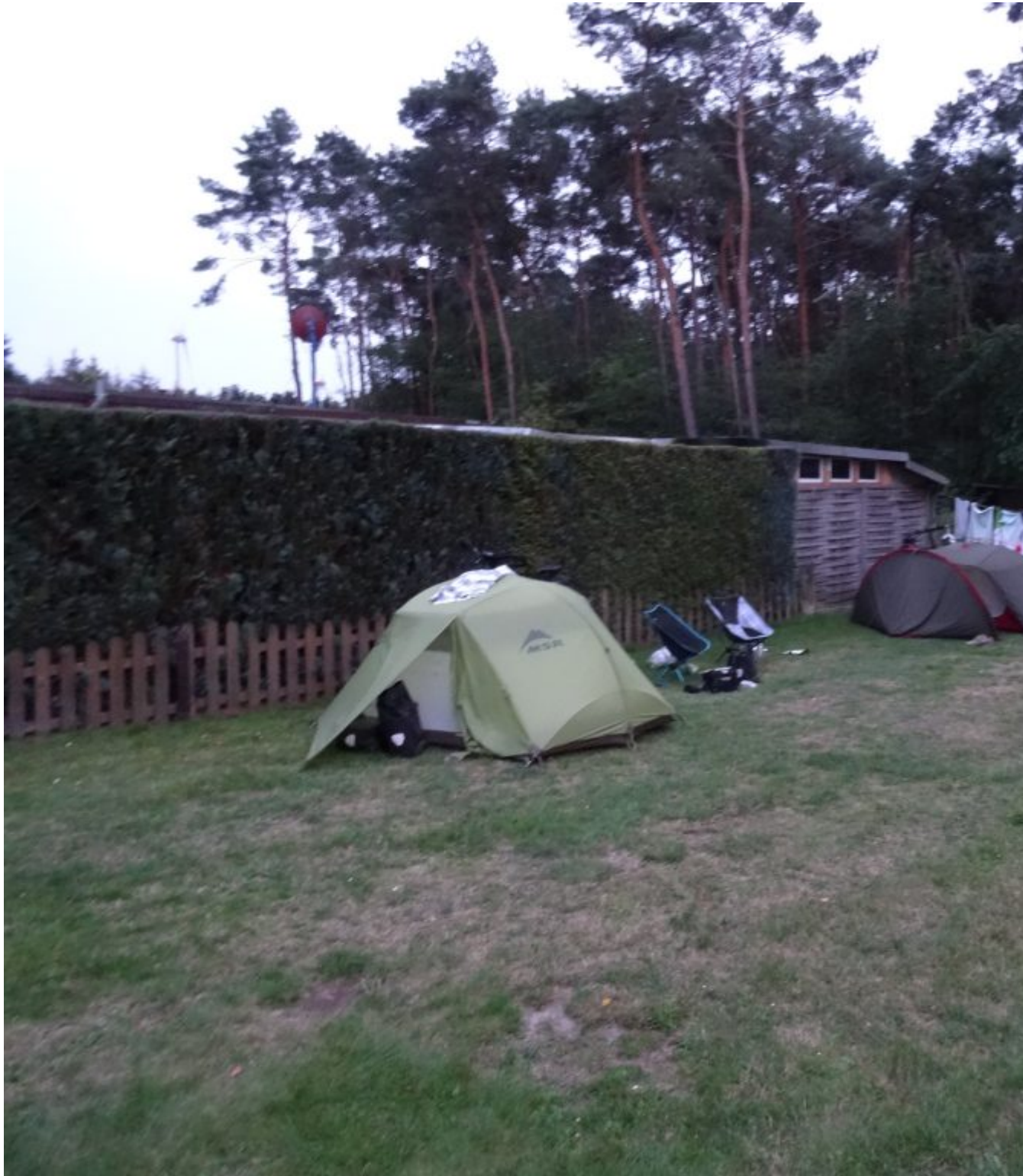
Camping "Zum Naturpark"