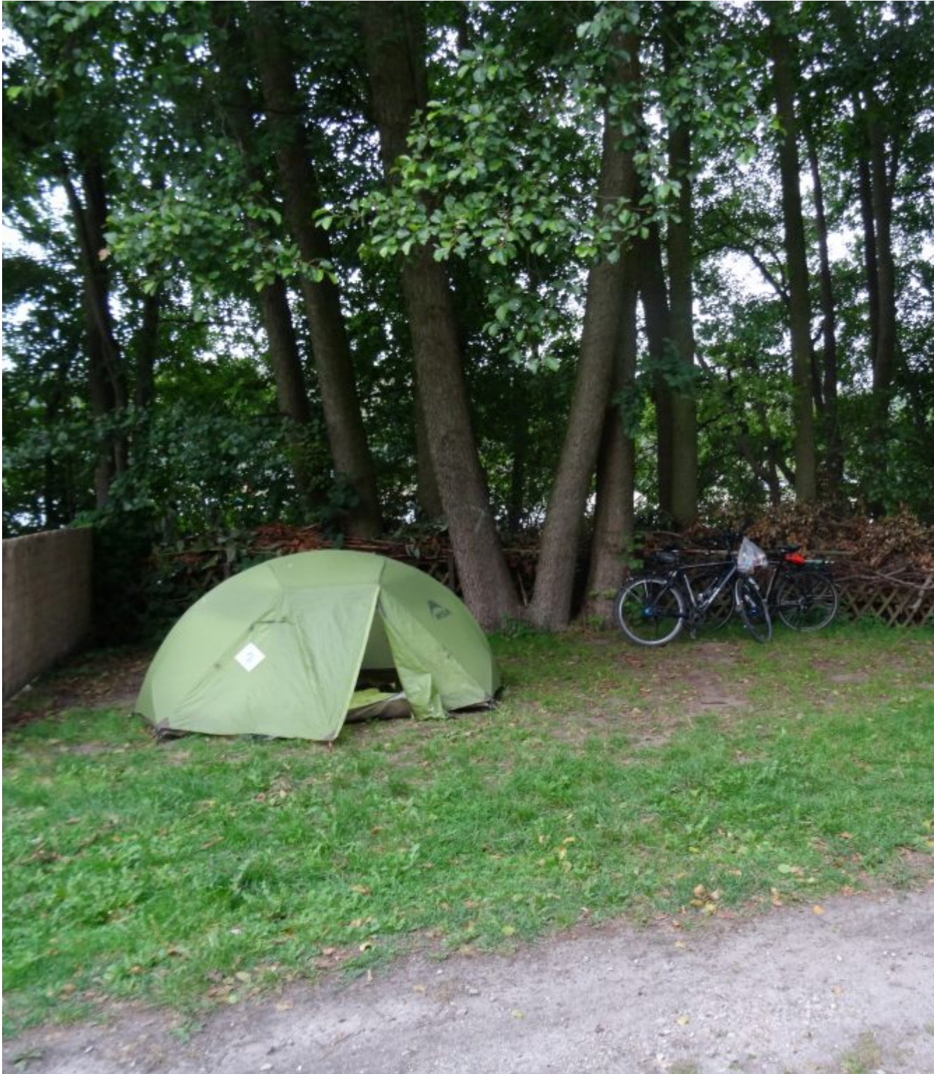
Camping Am Wolletzsee