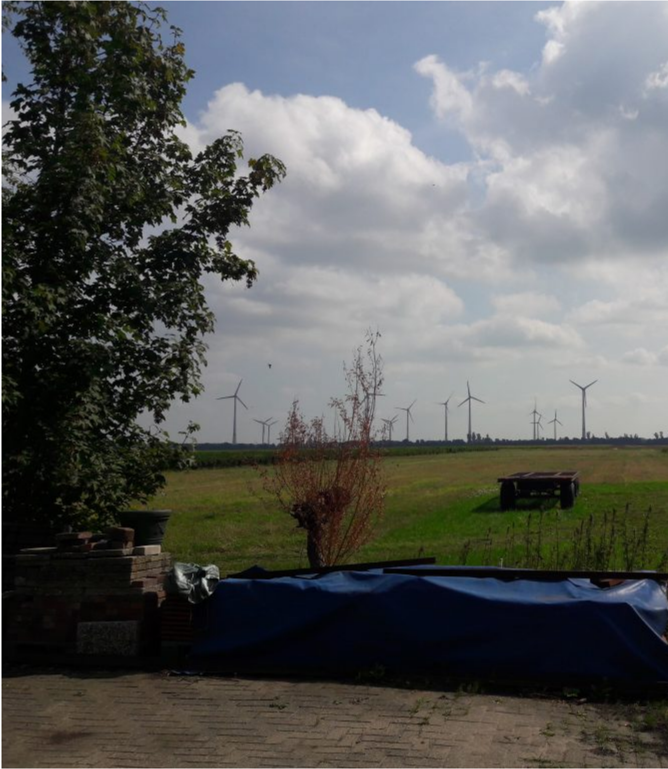
Het achterland van TooVanDiek