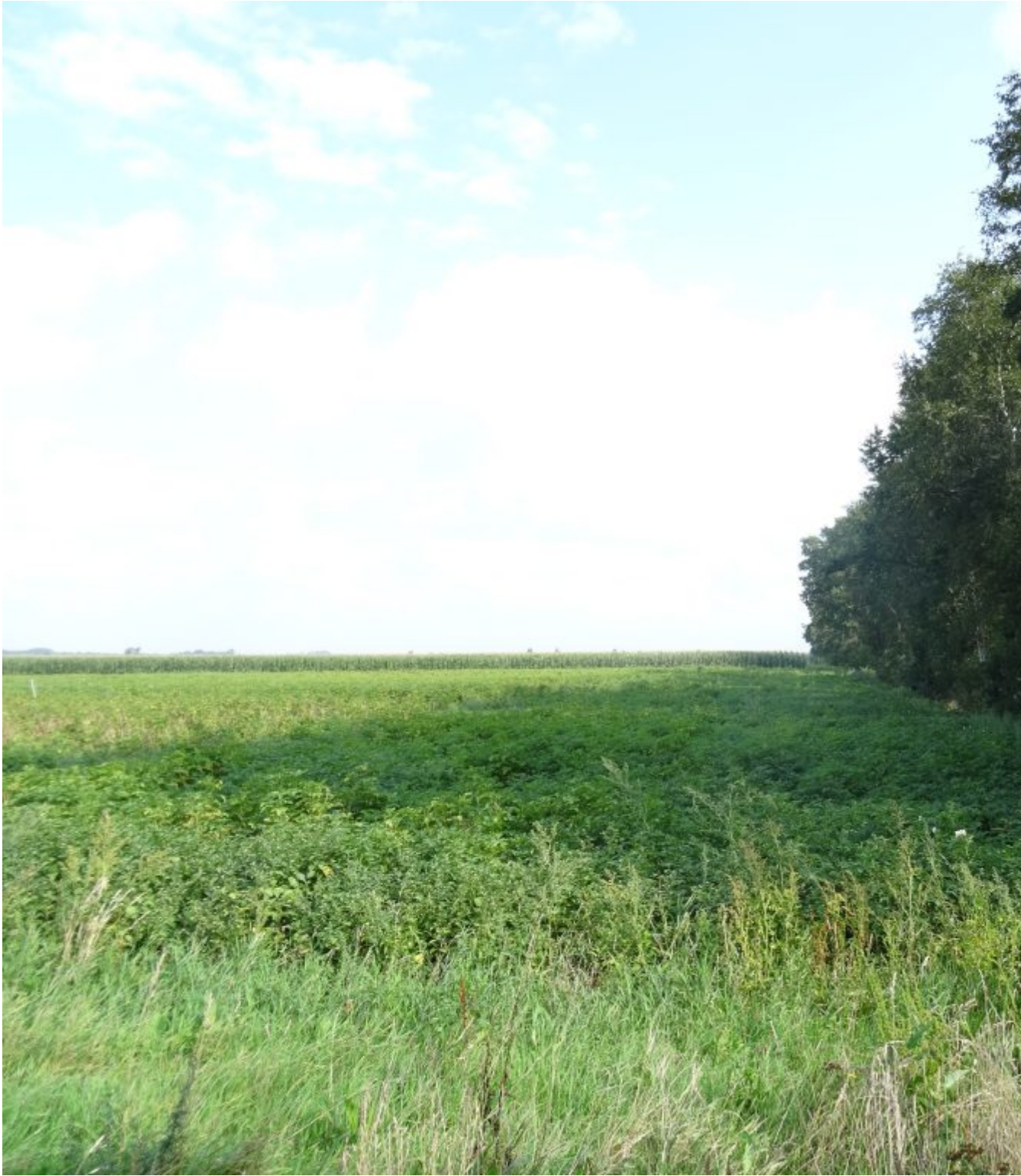
De grens met Duitsland