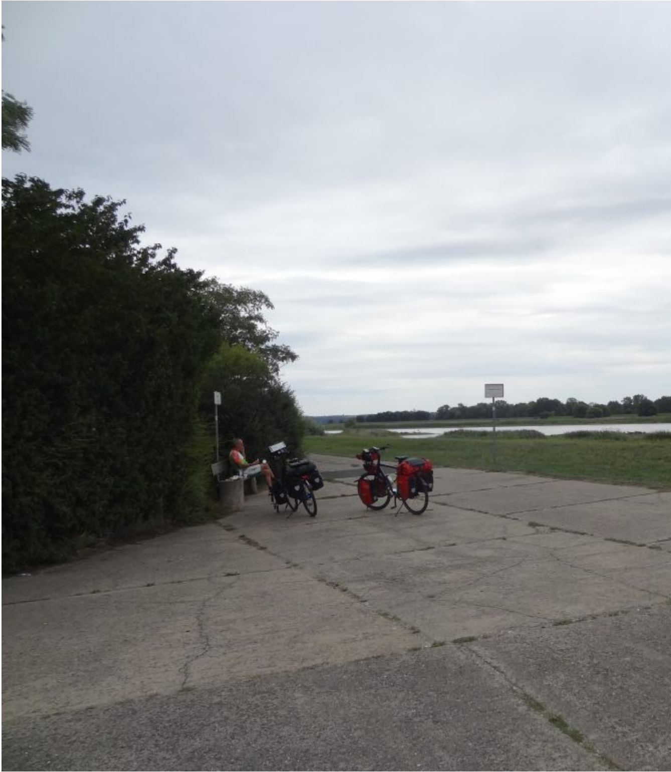
Lunchen en contact met Greefhorst