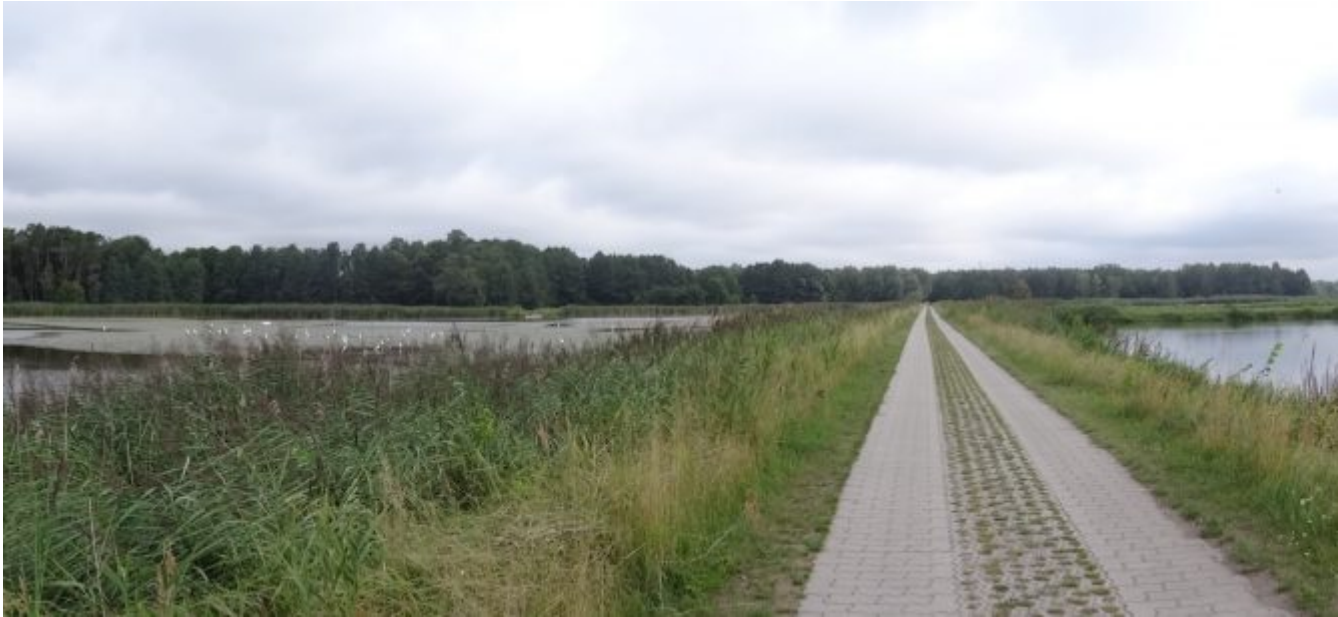
Grote groep zilverreigers