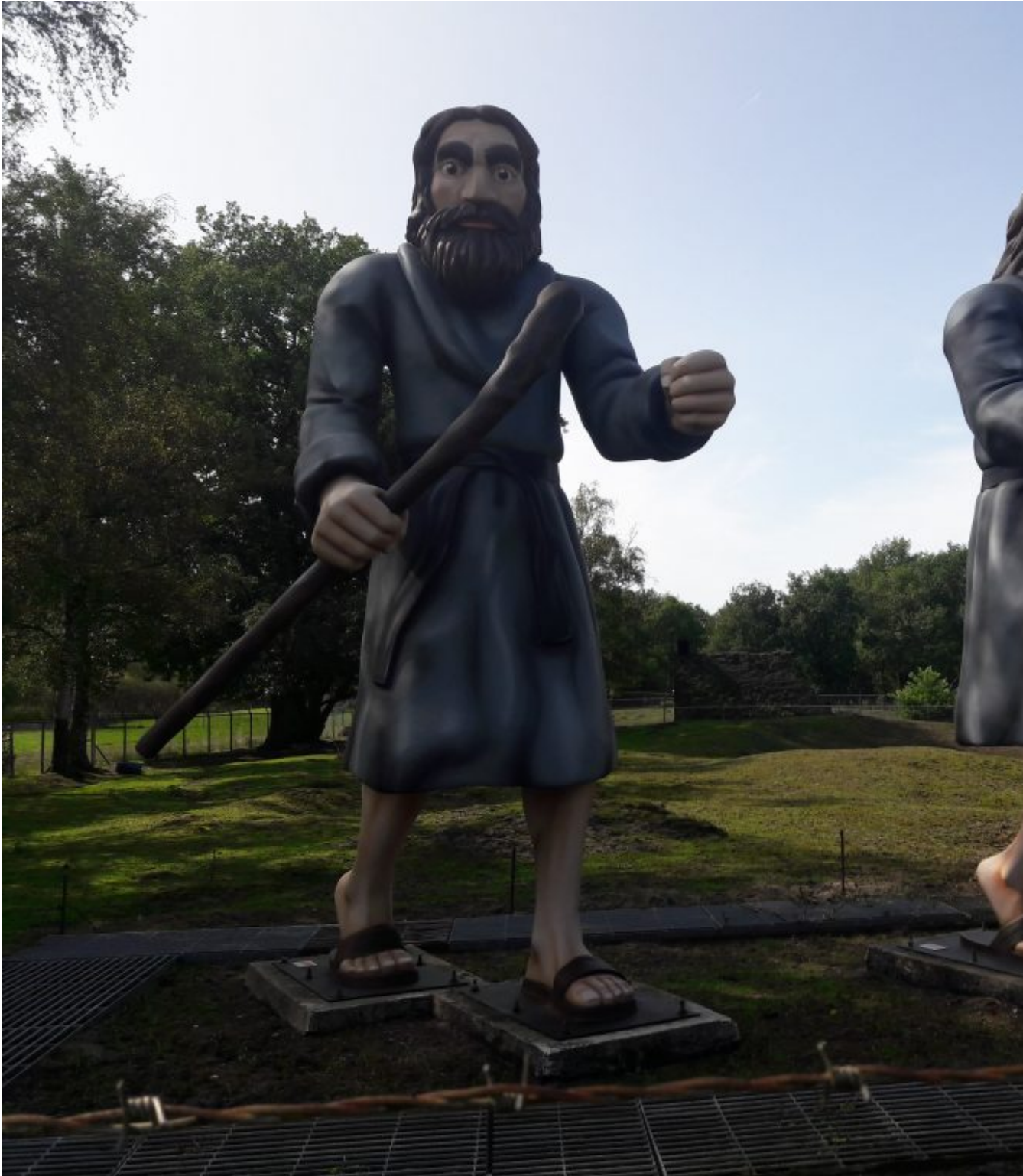
Ellert en Brammert