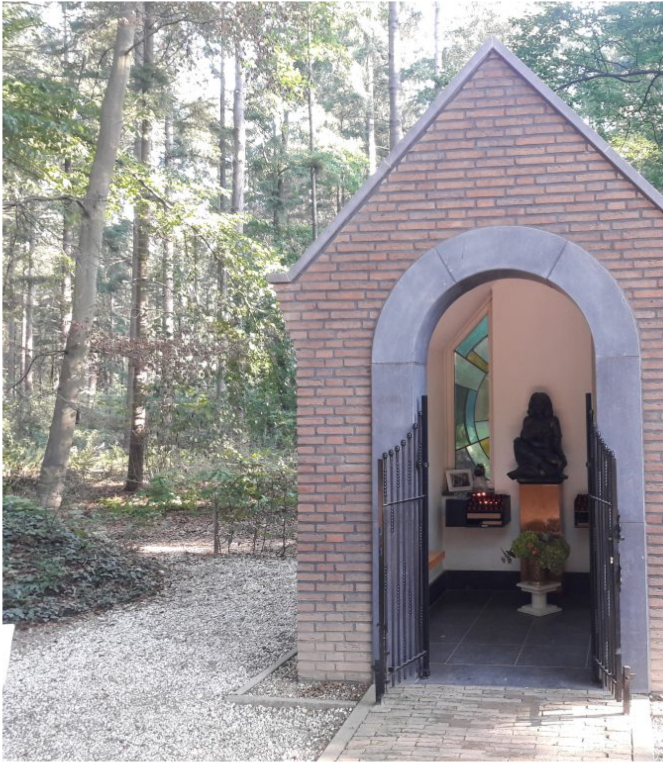
Boskapel de Biesselt