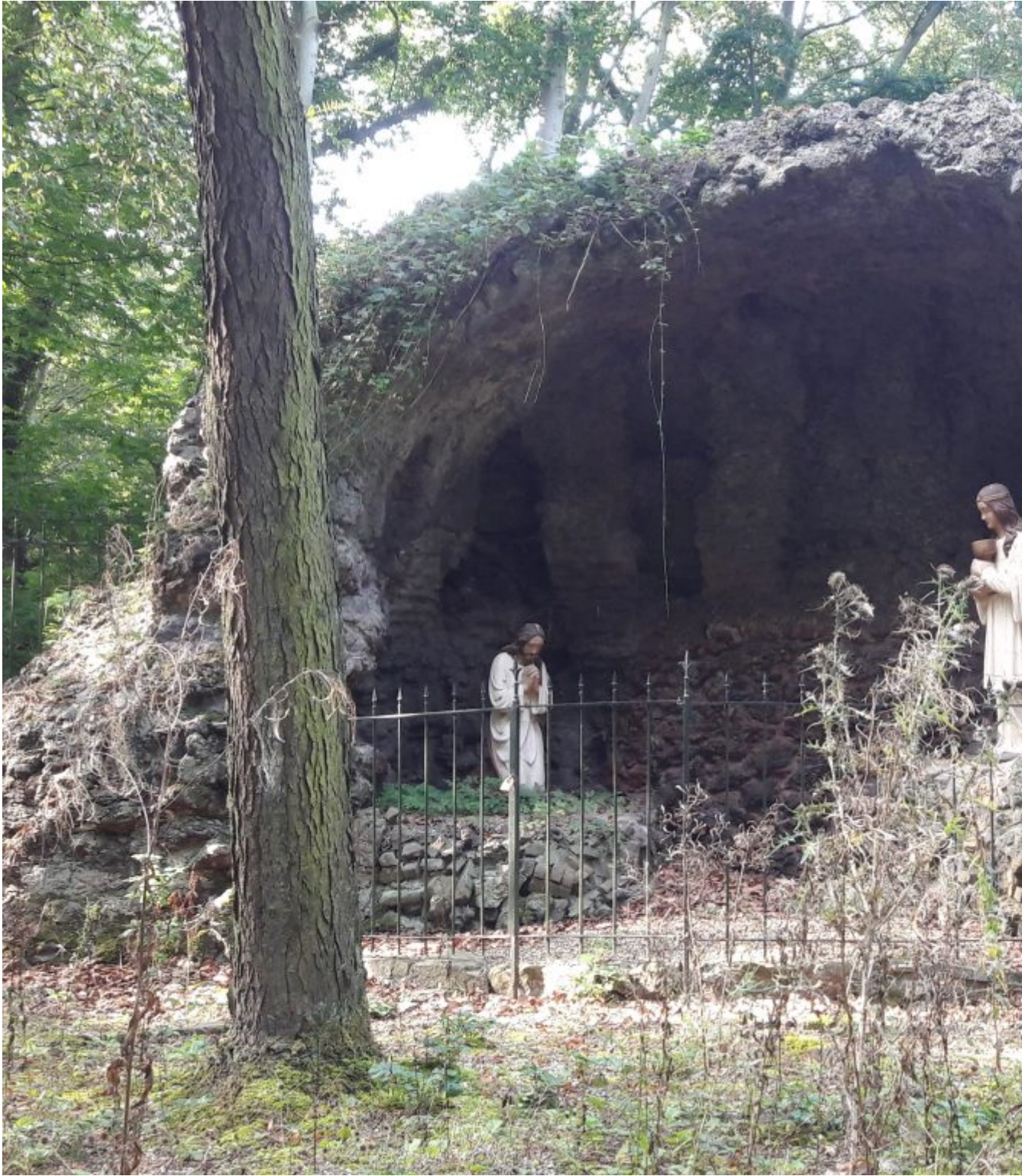
Prachtig uitgegraven weggetjes