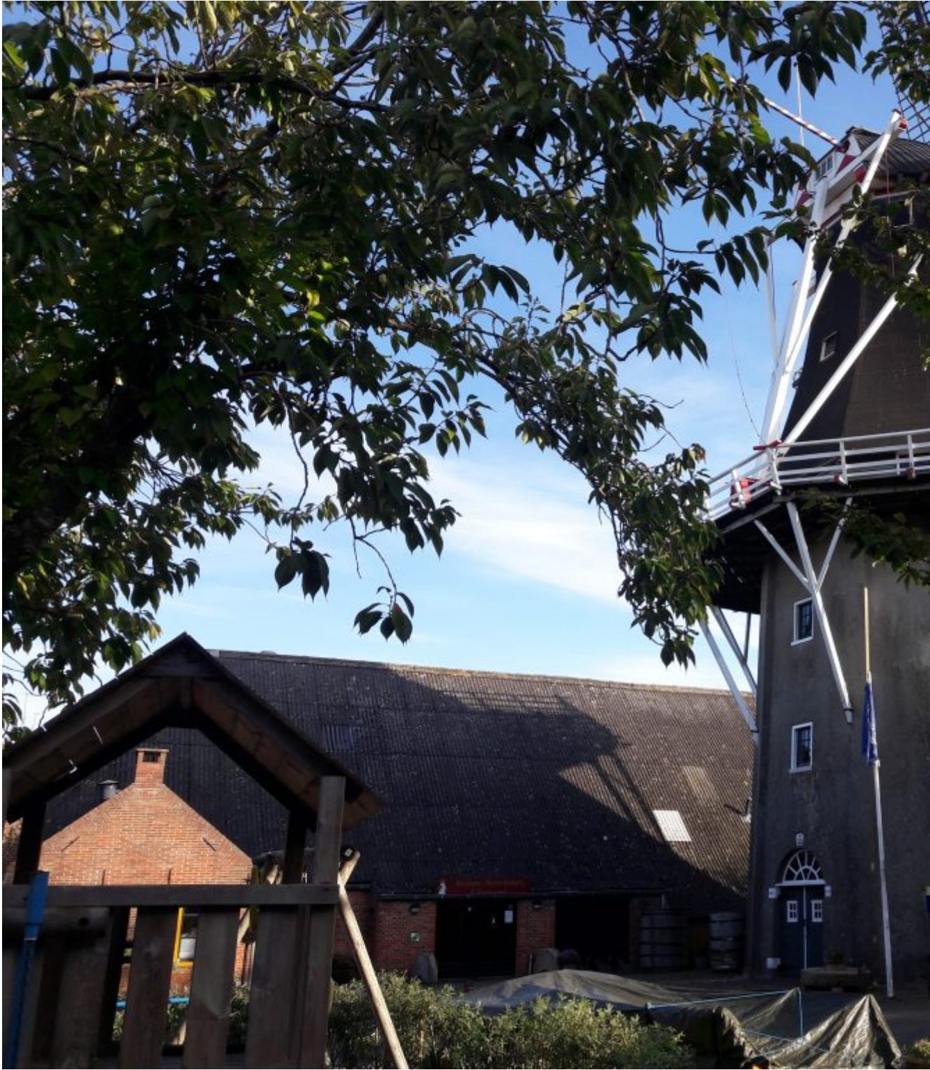
Pelmolen De Lelie