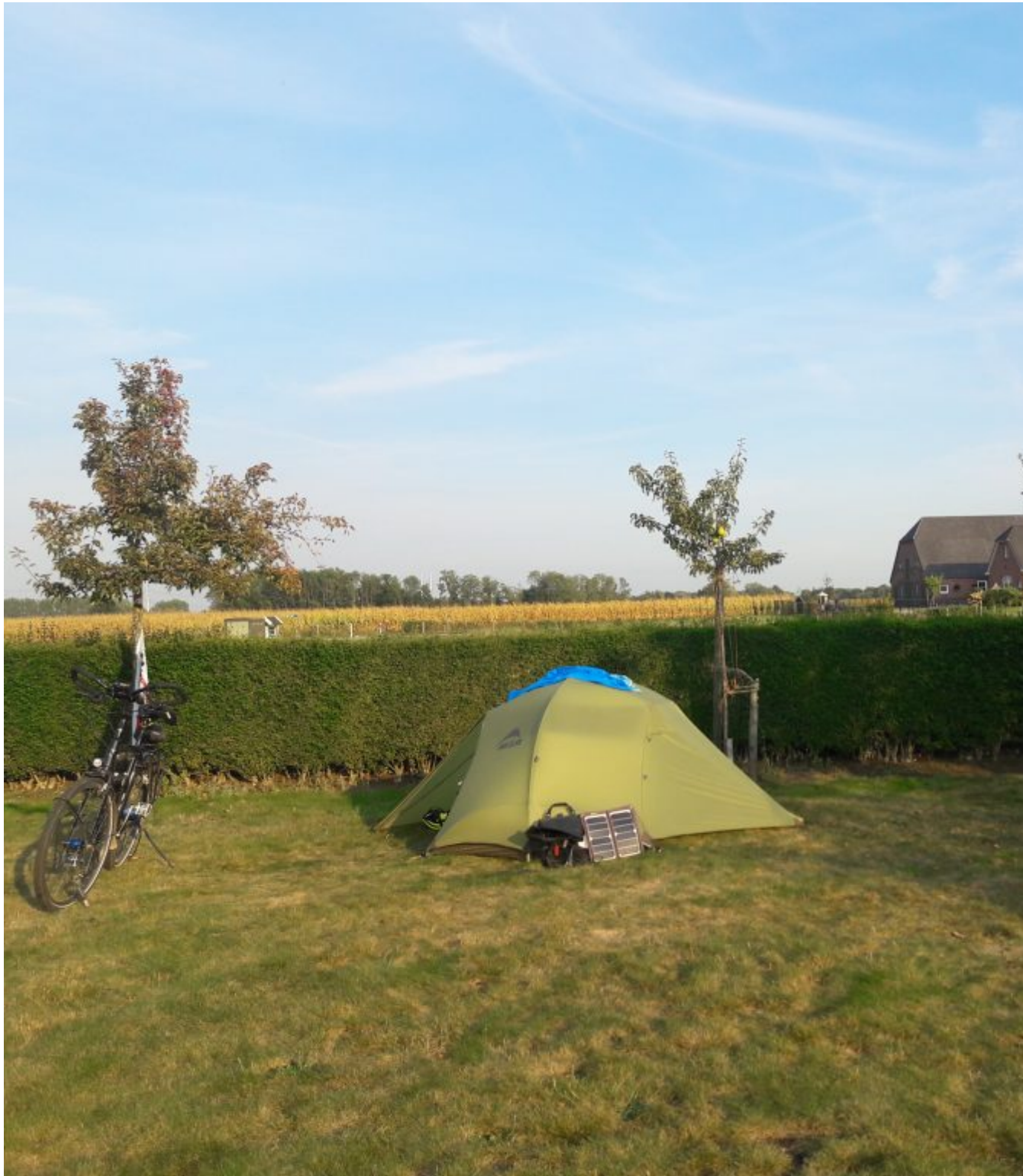
Camping 't Kleine Laar