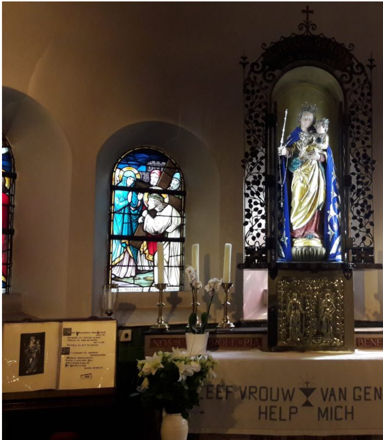
Onze Lieve Vrouw van Genooi