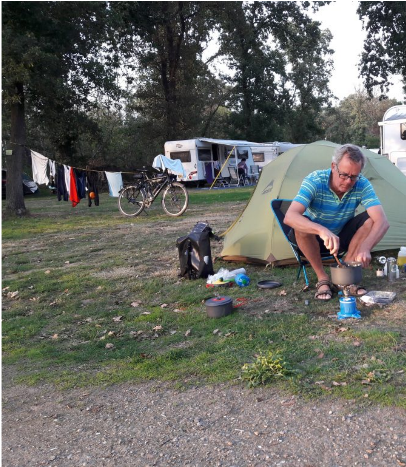
Camping Natuurplezier in Reuver