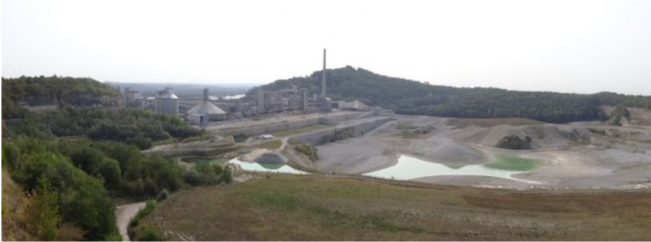
De afgravingen van Enci