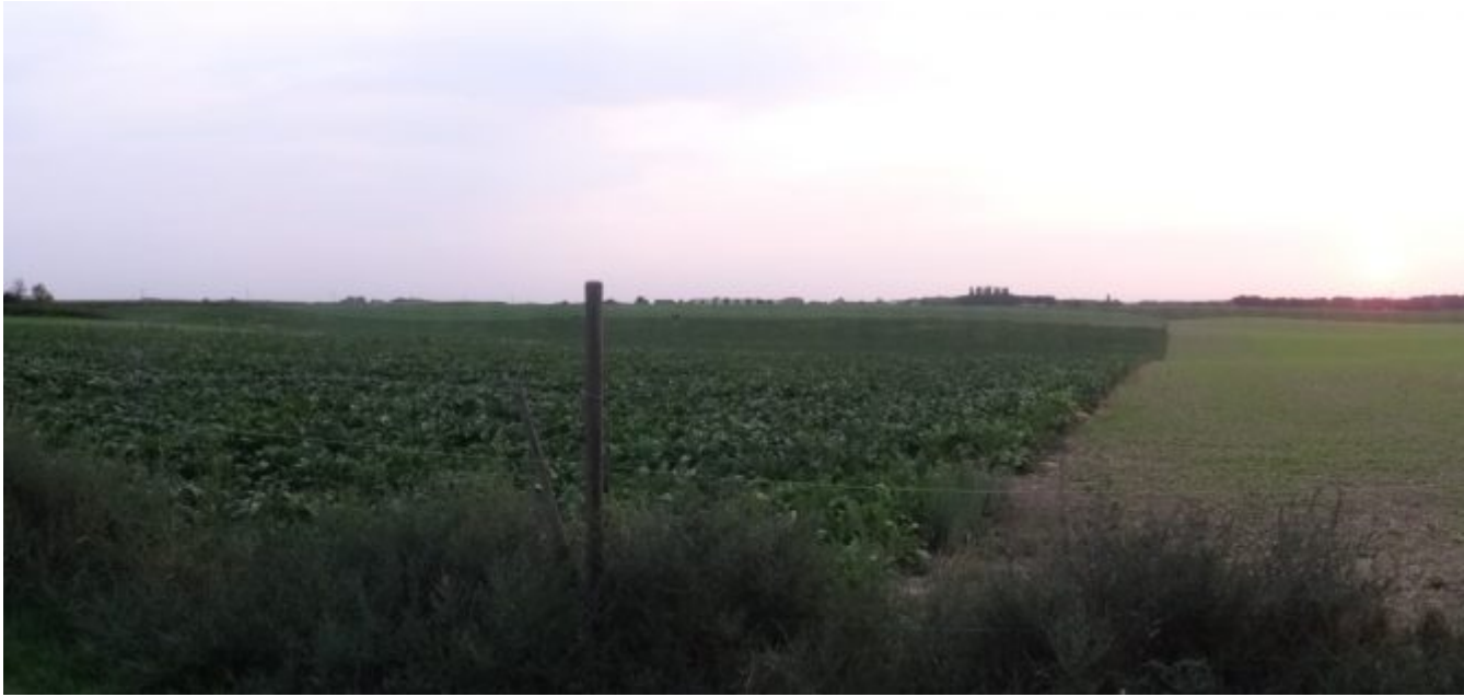
Uitzicht op de camping iets vroeger