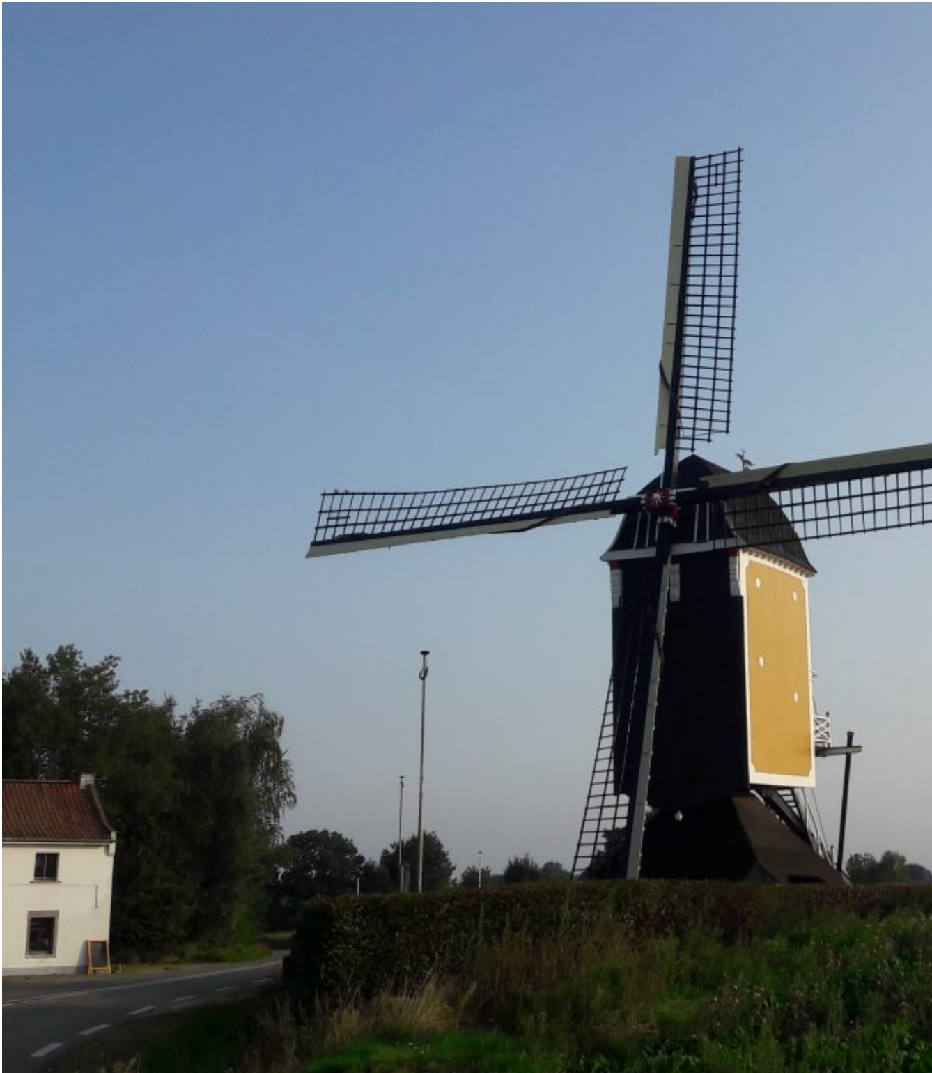
St. Hubertusmolen Beek