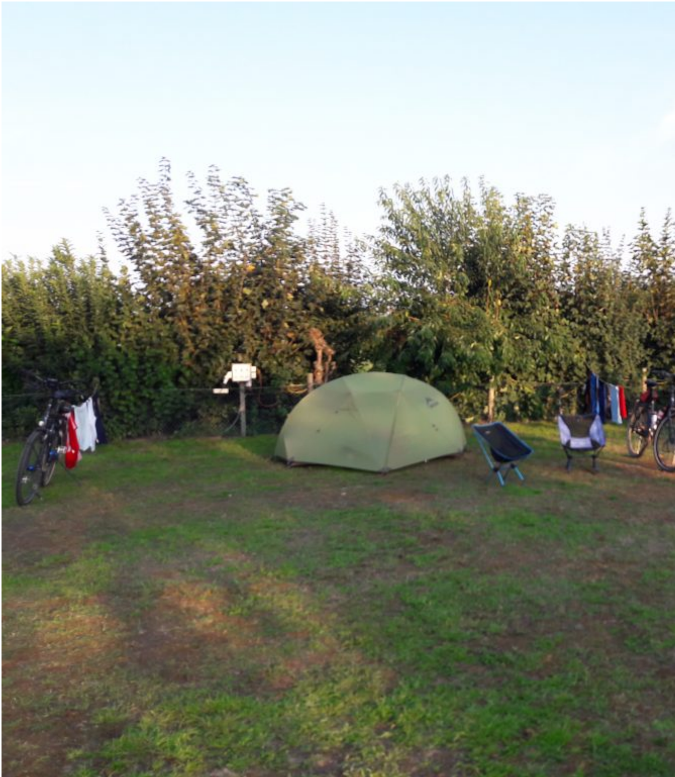
Camping de Bloemenkamp in Milsbeek