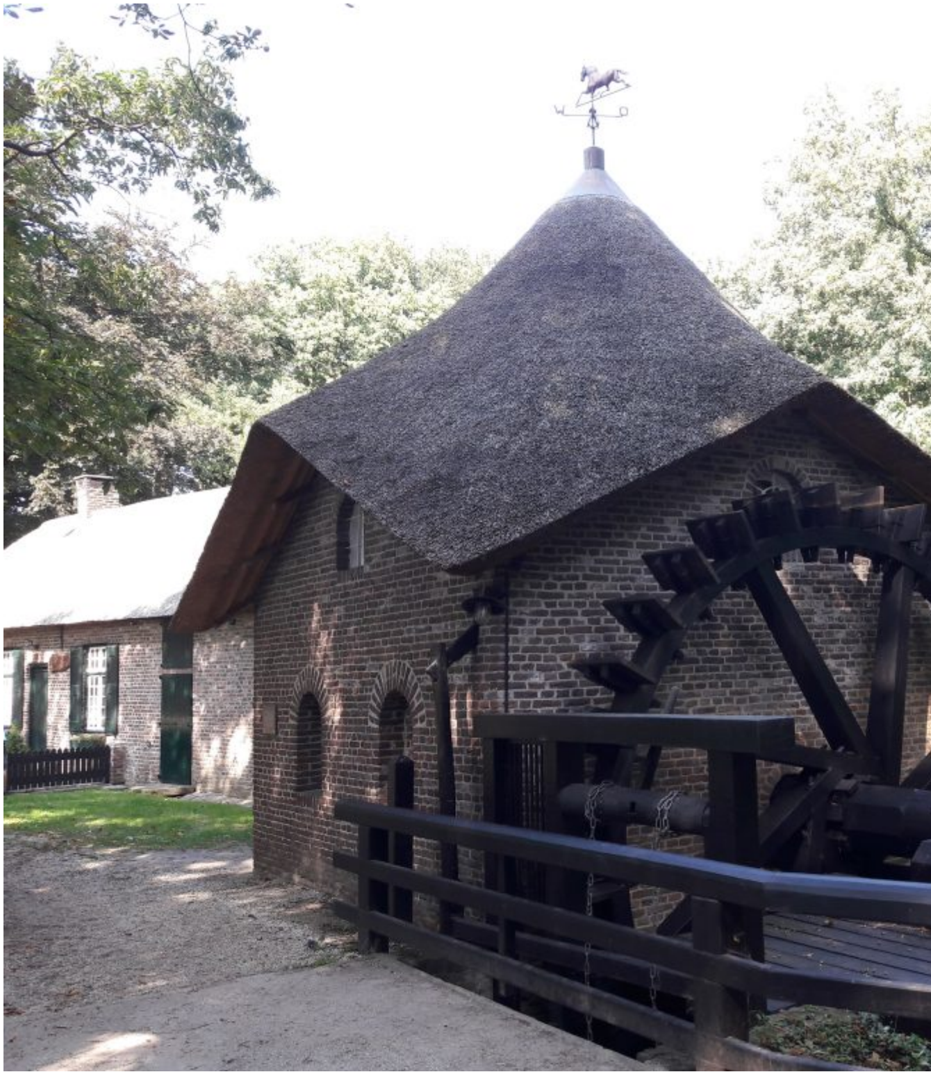
Rosmolen uit 1861