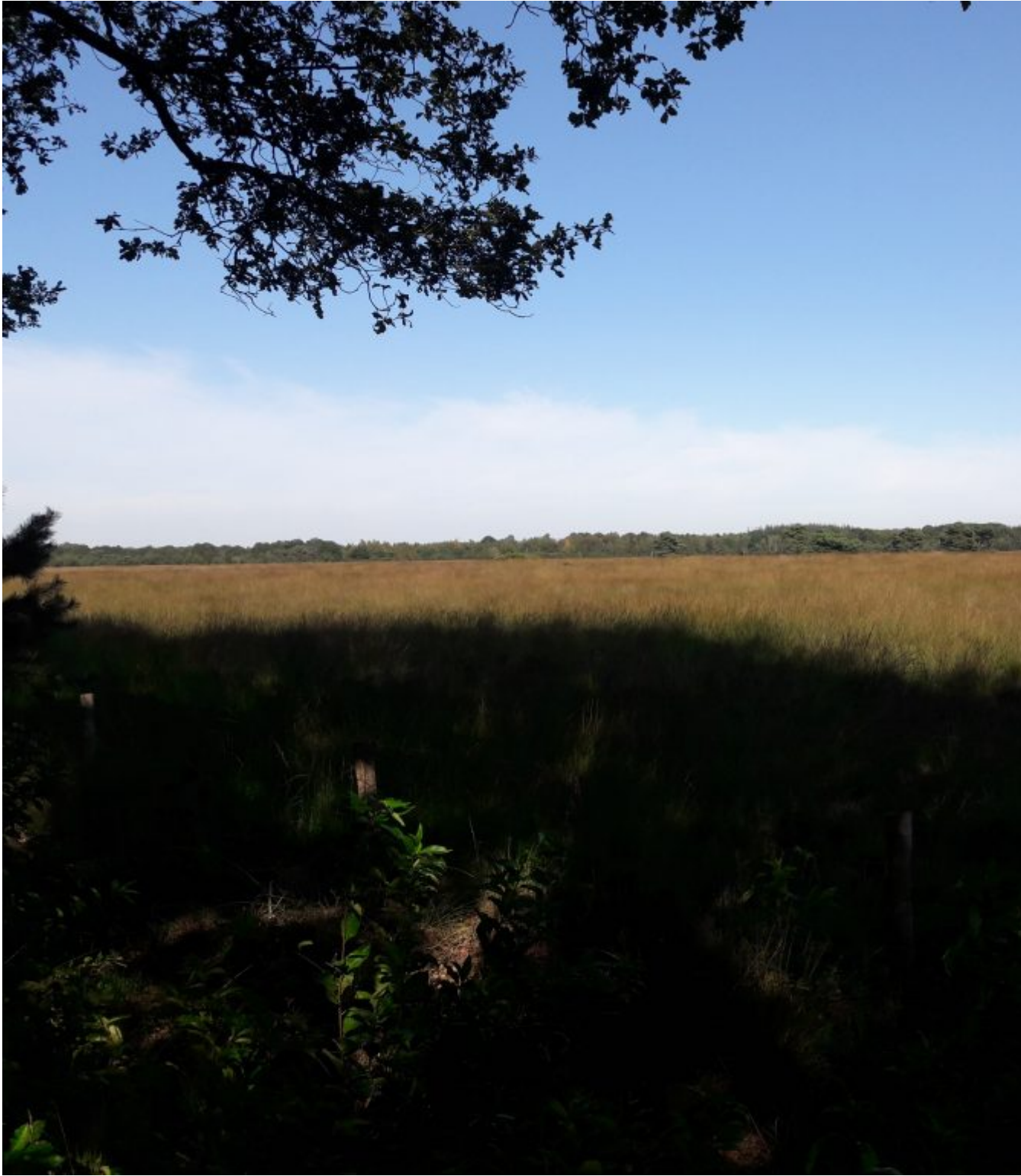
Nationaal Park Drents-Friese Wold