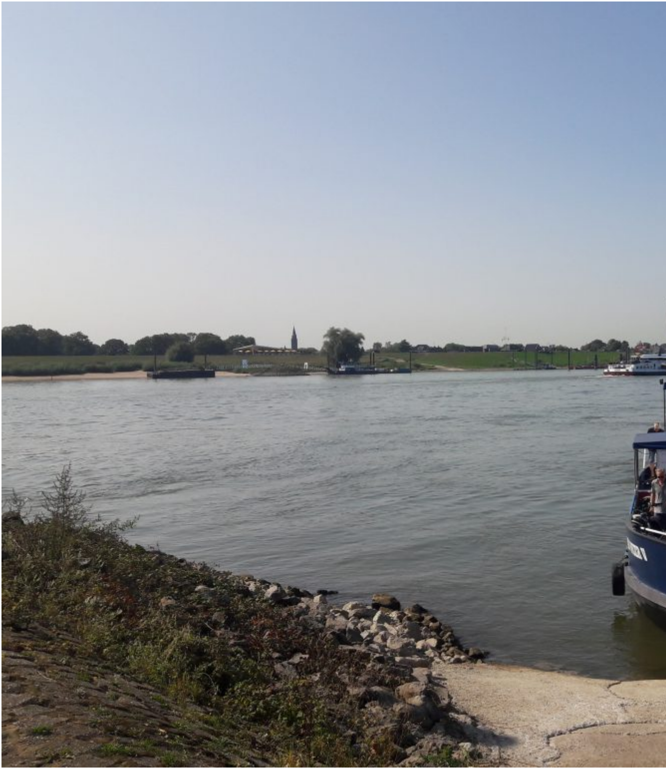
Het pontje bij Millingen aan de Rijn