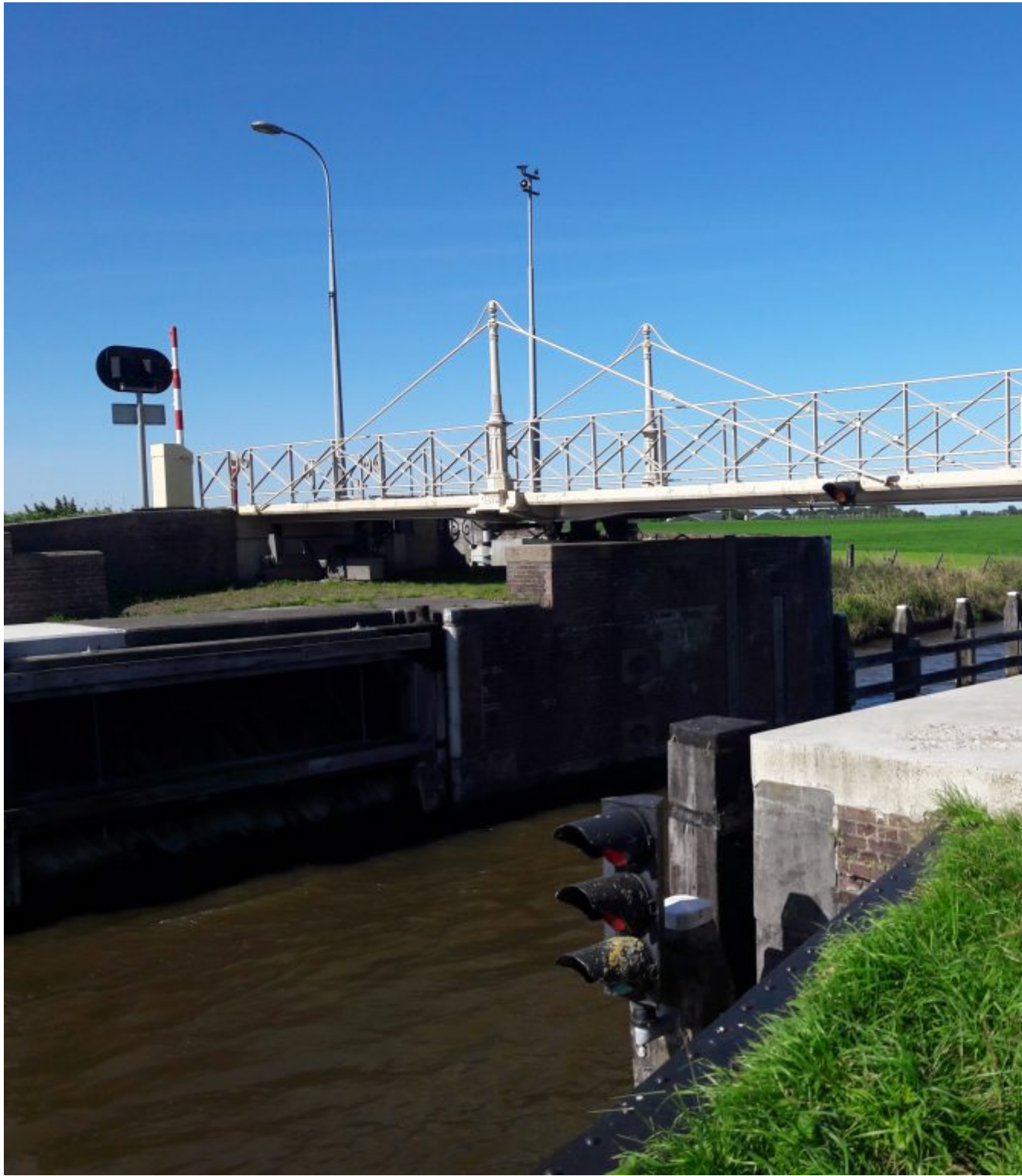
Gerestaureerd sluisje Wetsingerzijl