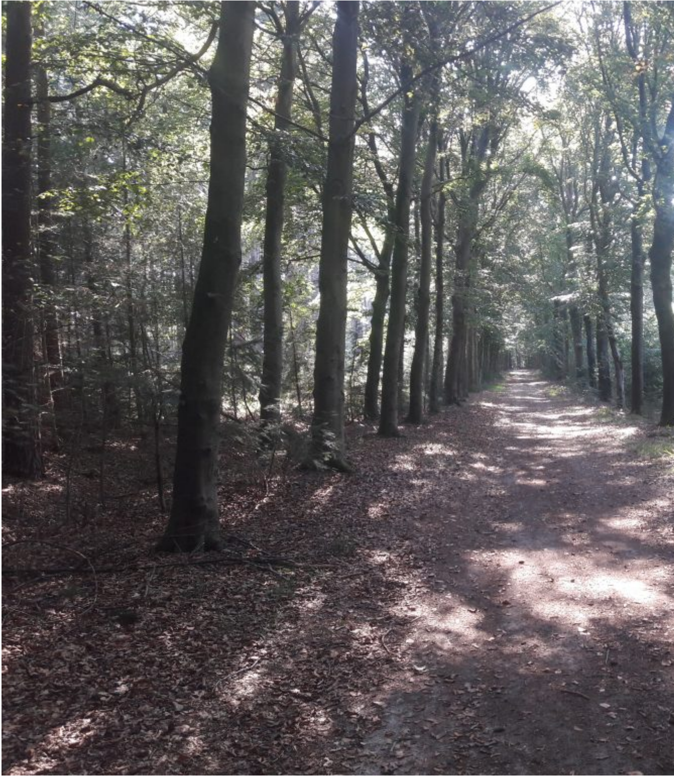
op het Pieterwandelpad