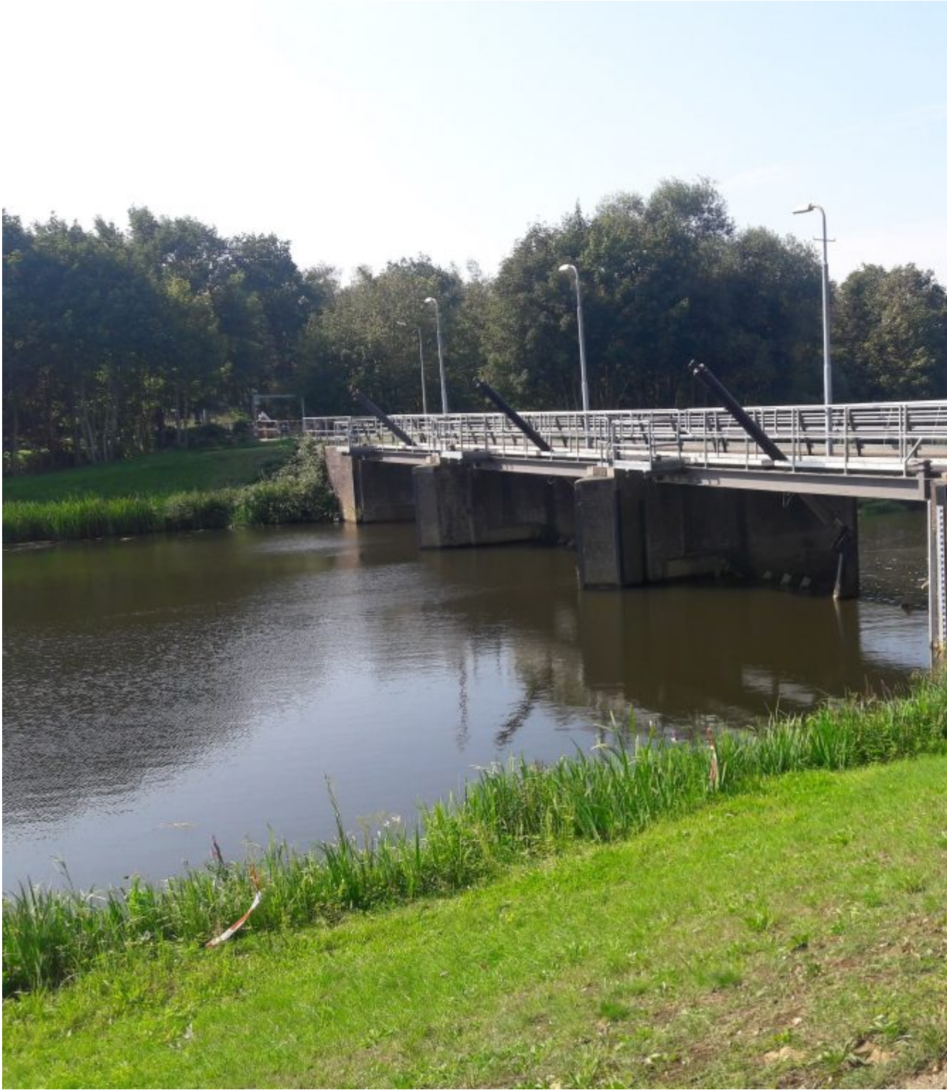
Stuw de Junne