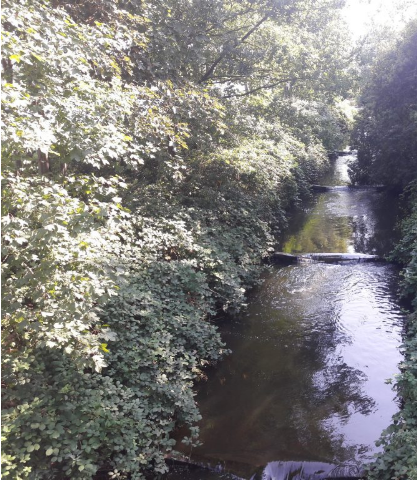
Vistrap de Junne