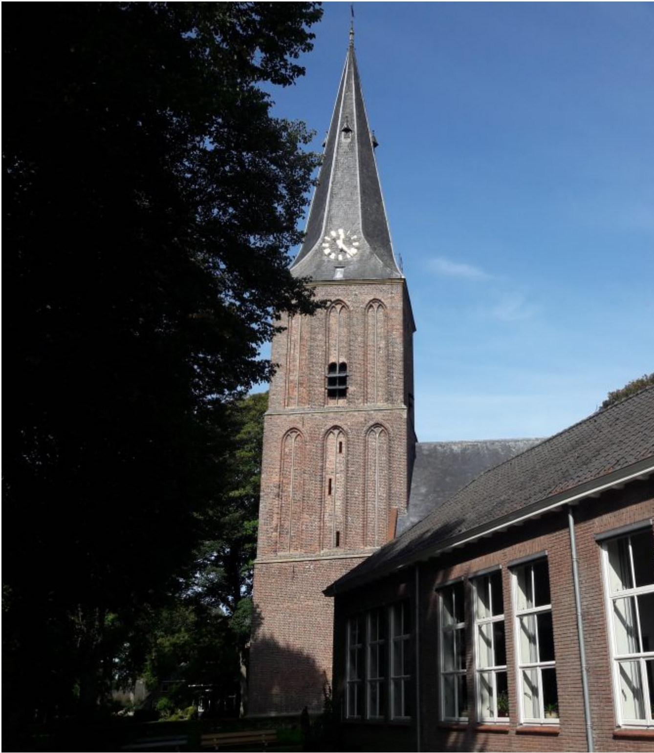
15e eeuwse kerk Sleen