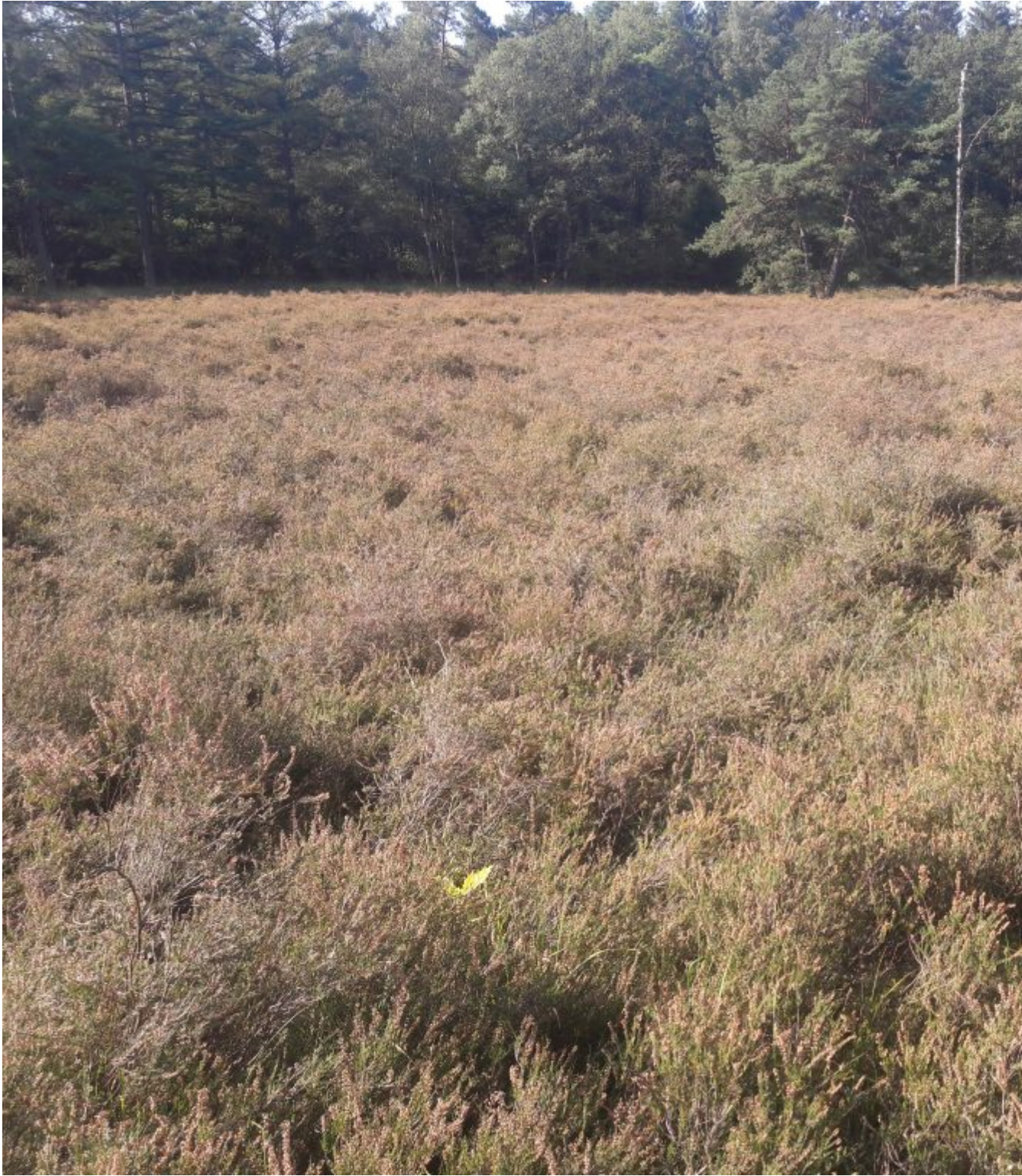
De hei bij Vorden