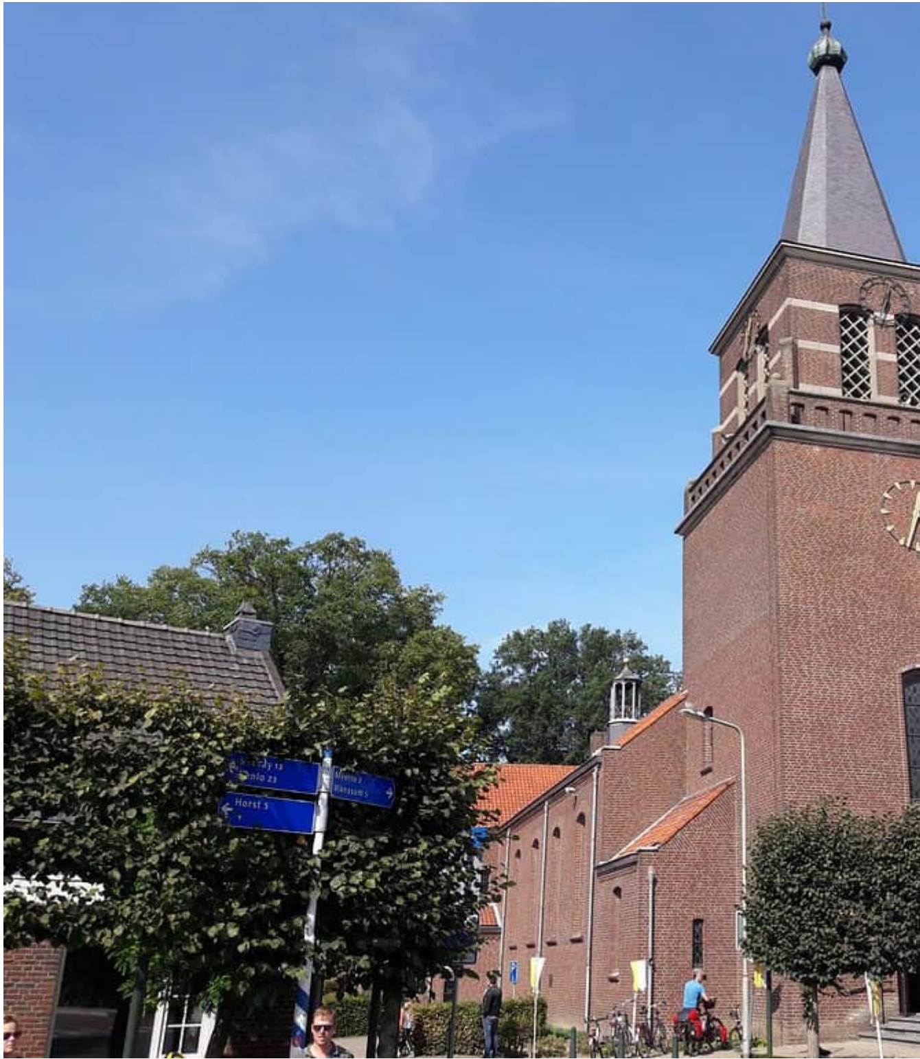
Kapel van Tienray