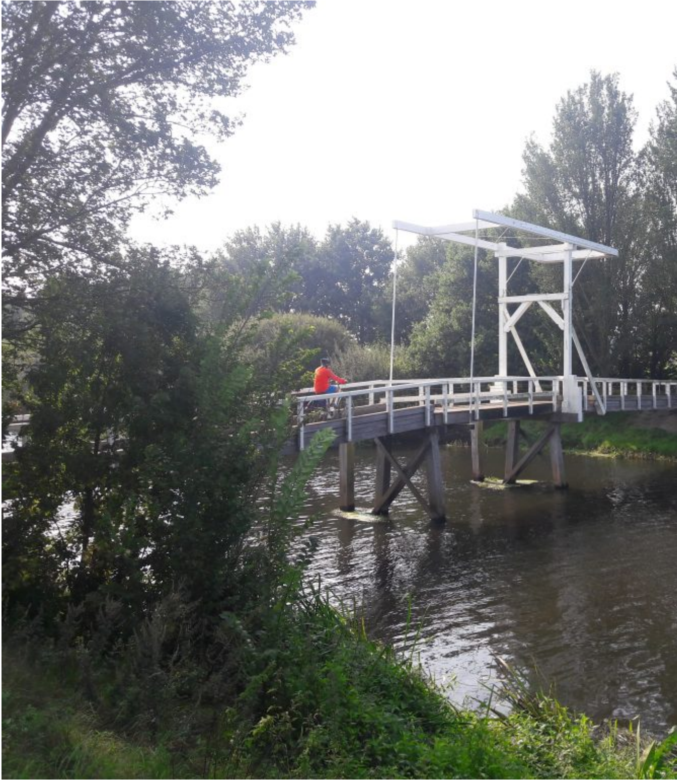
Witte bruggetje over de Regge