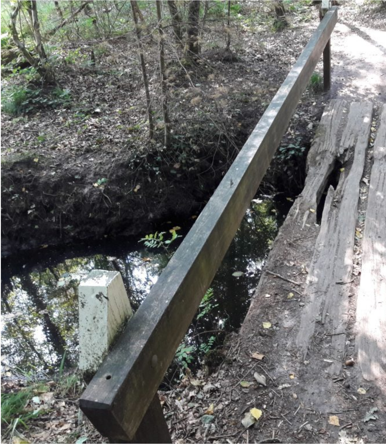
Ook landgoed Geijsteren