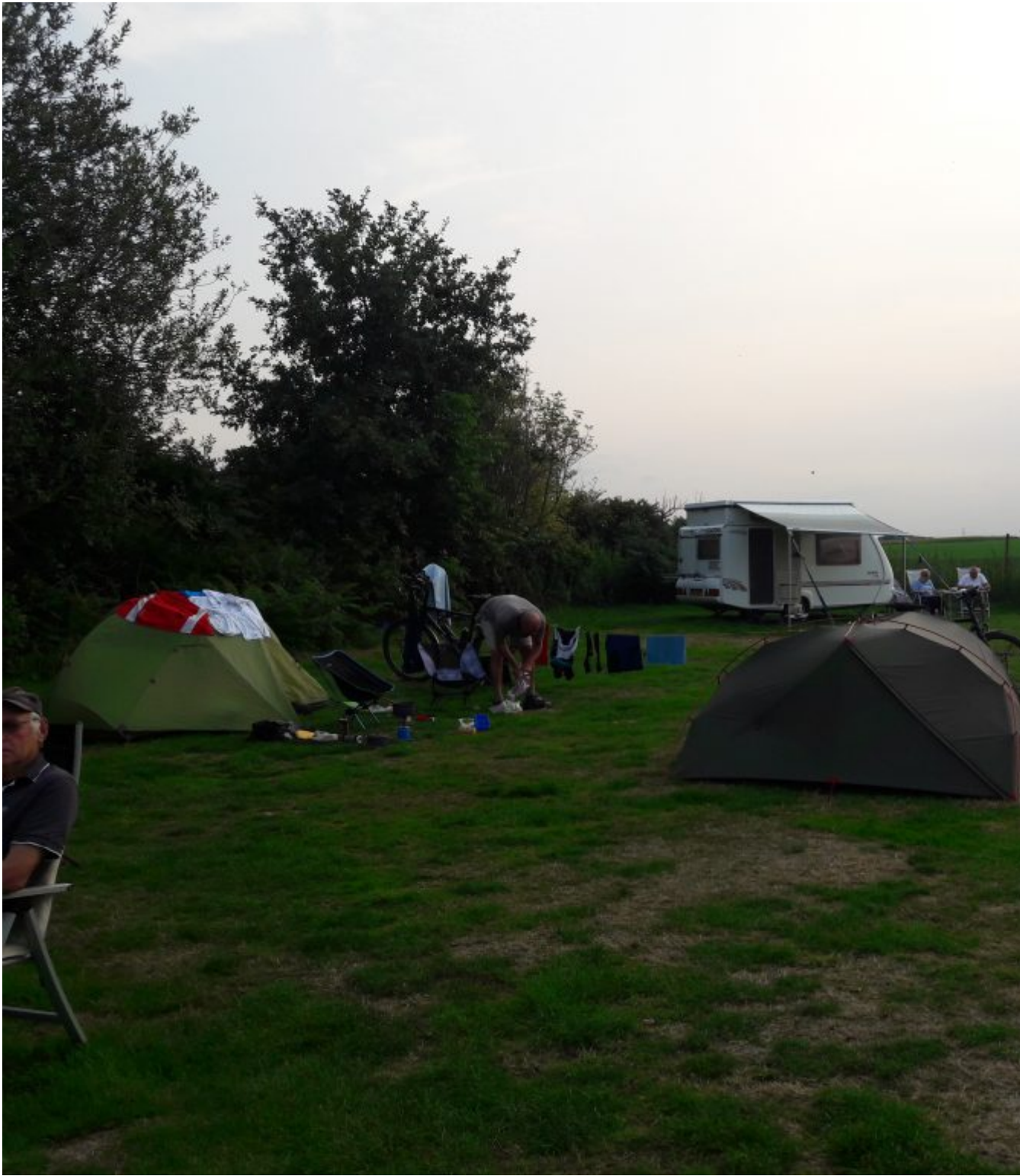
Camping Oensels Fruitweike