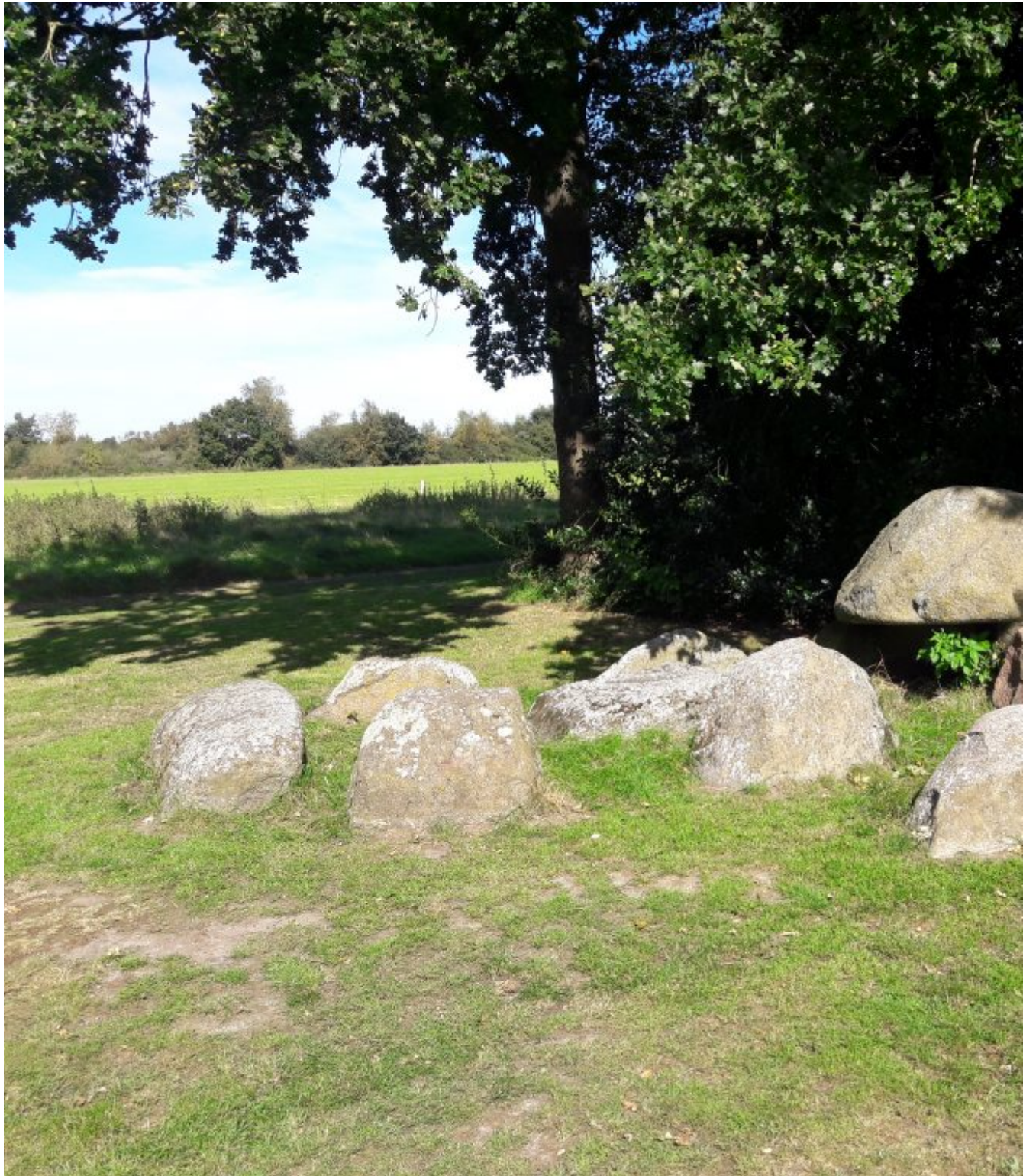
Hunebed D2 bij Westervelde