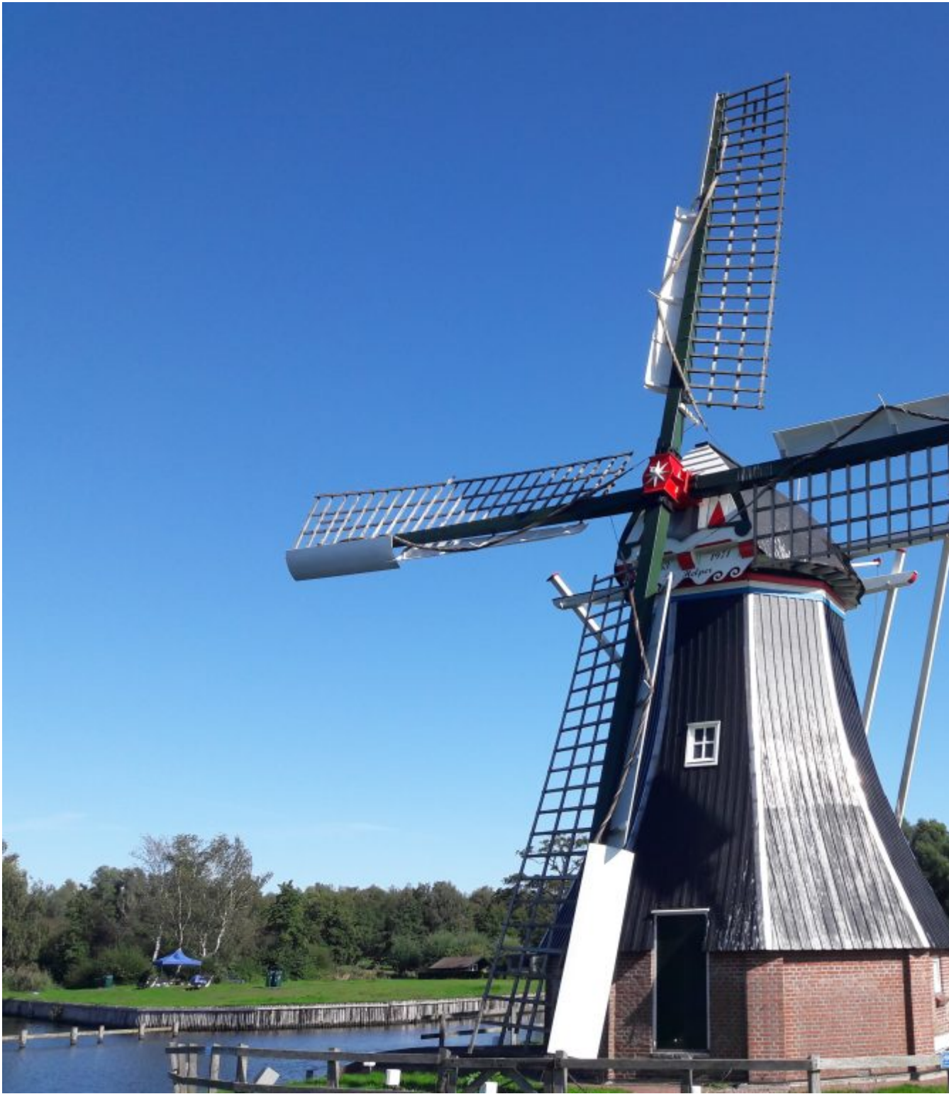
Molen de Helper