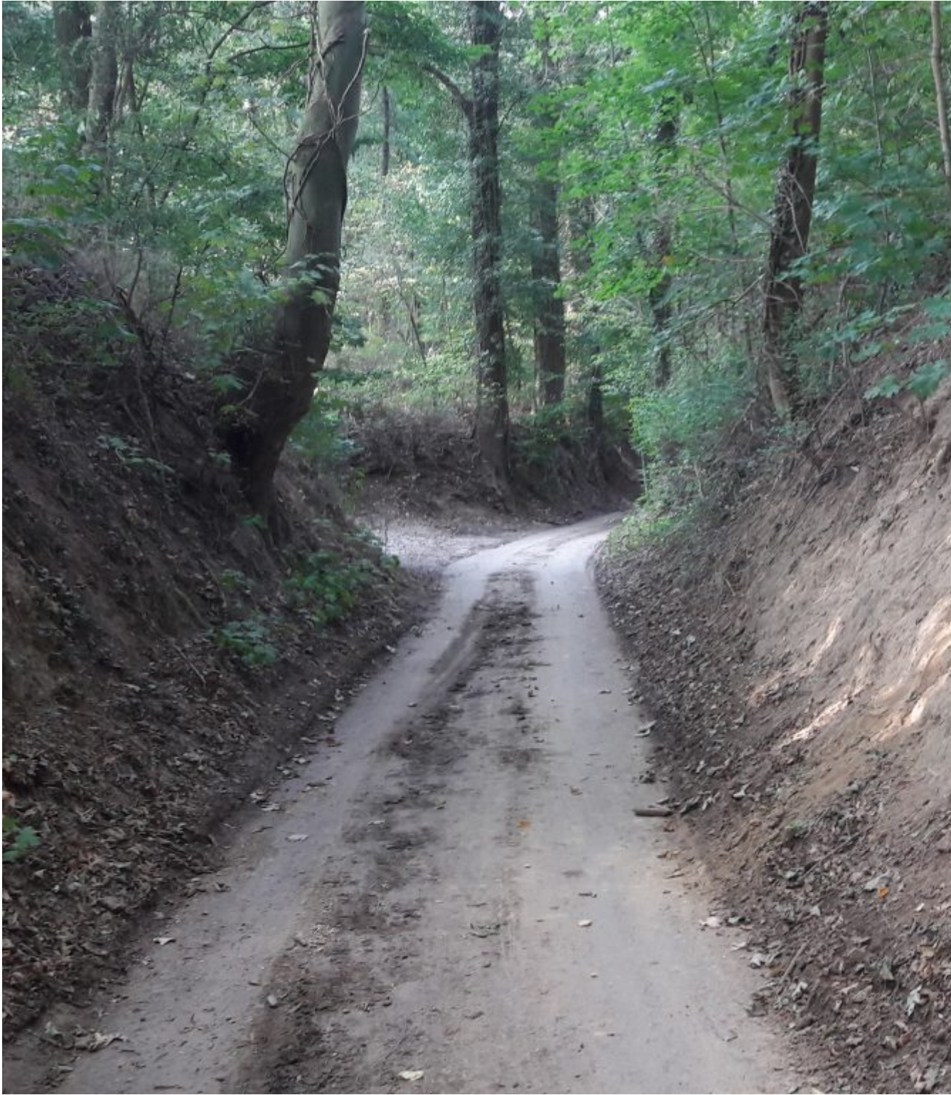
Prachtig uitgegraven weggetjes