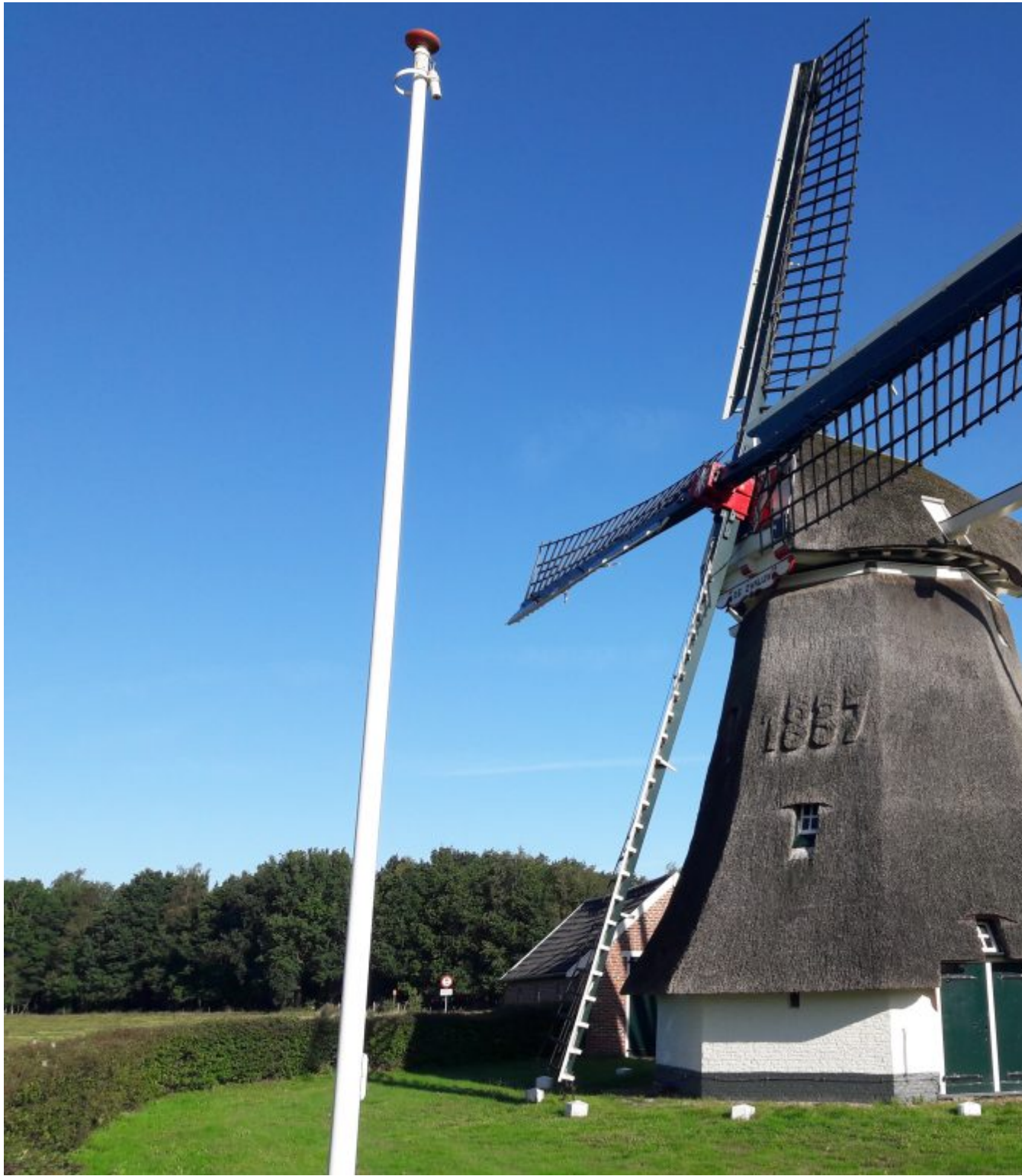
Molen de Zwaluw