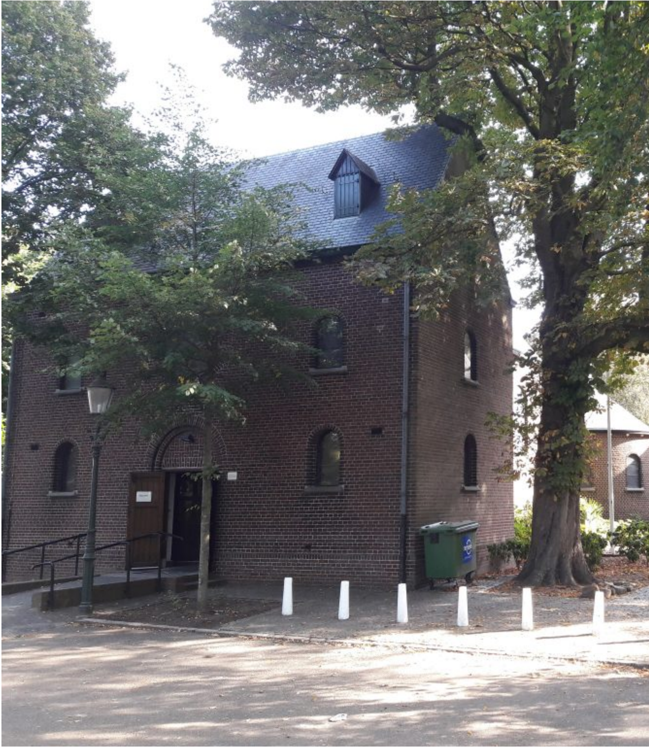
Kapel van Genooi