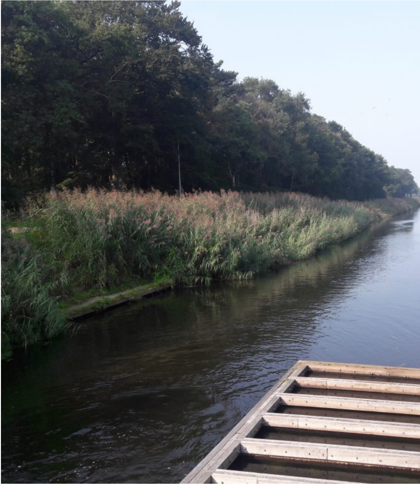
De stuw Hankate