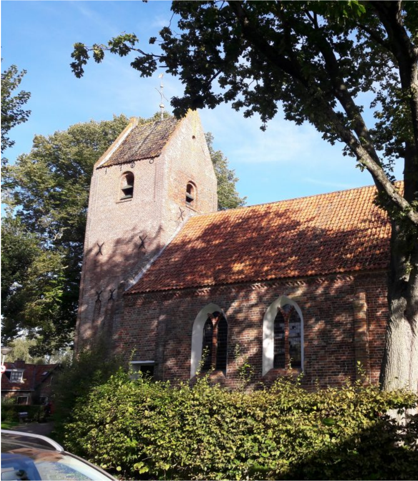
Oude katholieke St. Nicolaaskerk