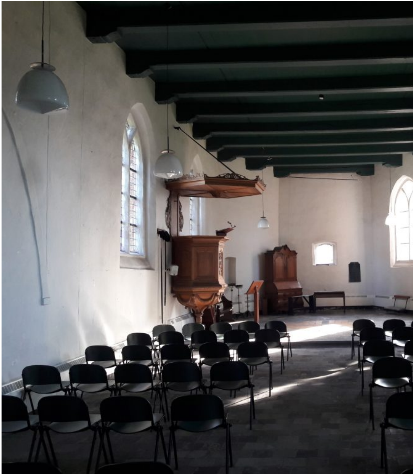
Oude katholieke St. Nicolaaskerk