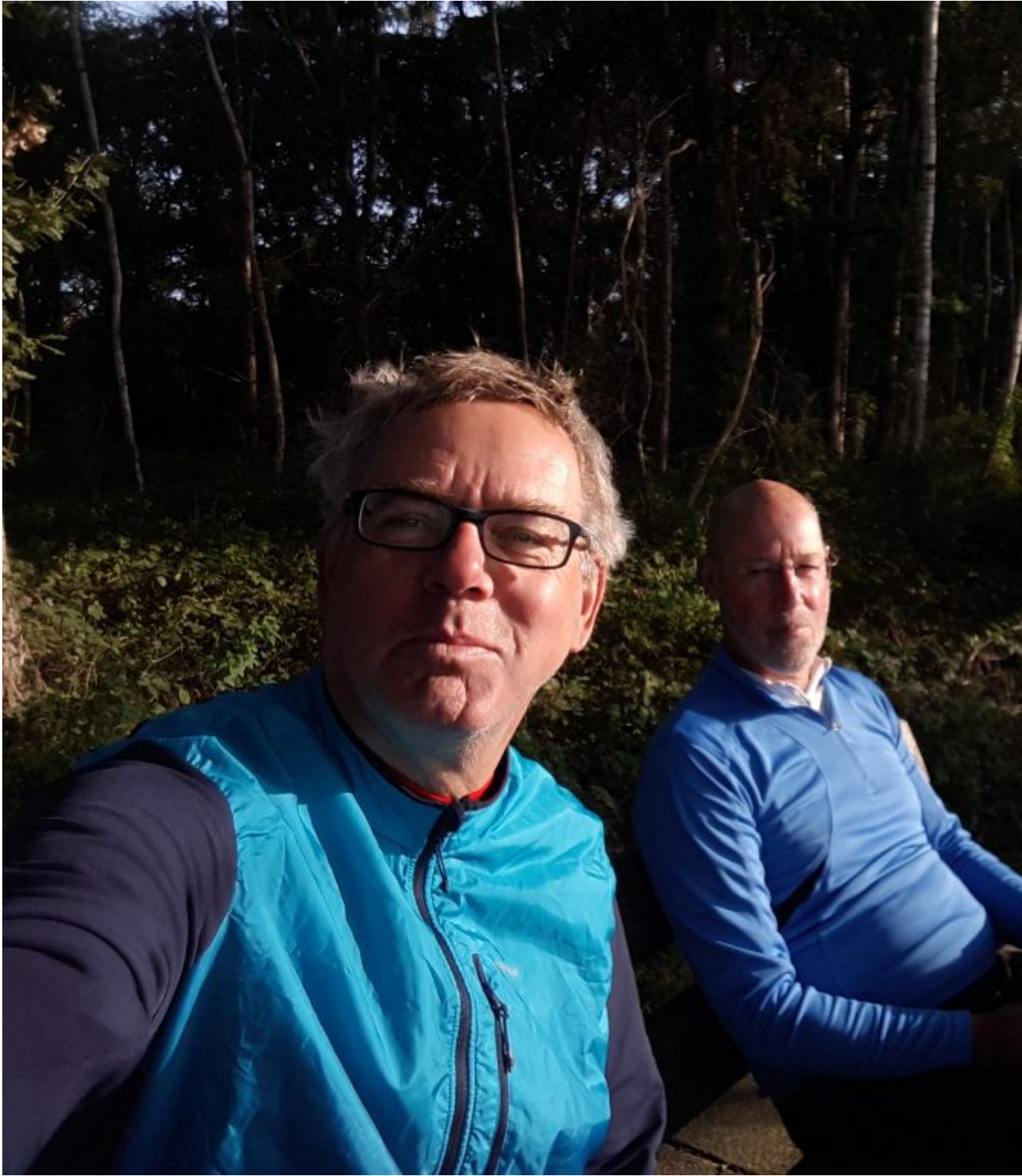
Weer een picknicktafel