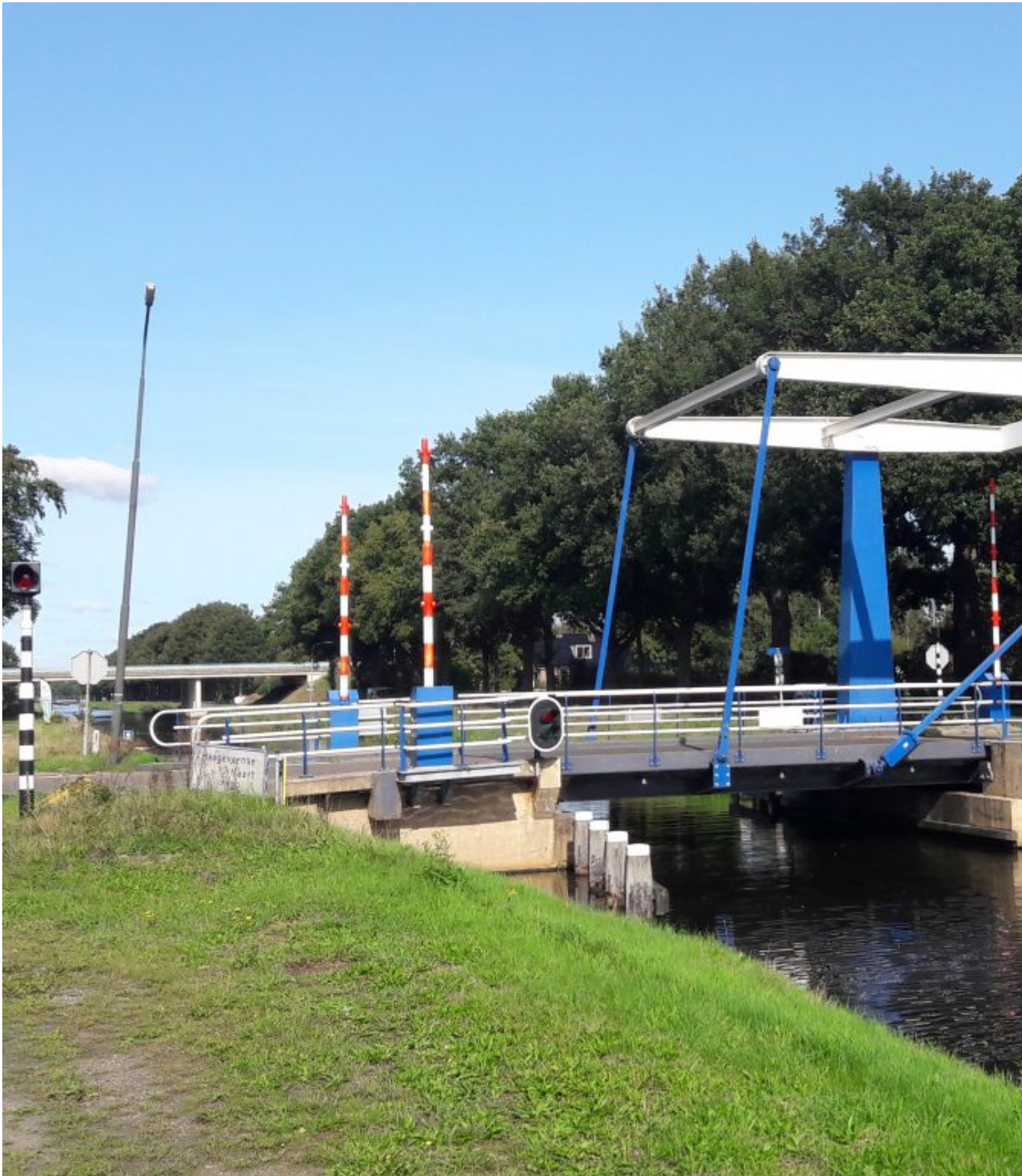
Verl. Hoogeveense Vaart