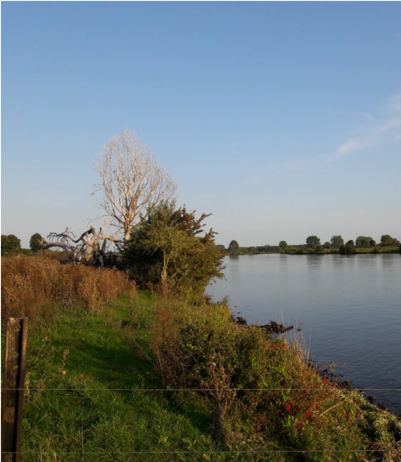
Laatste uitzicht op de Maas