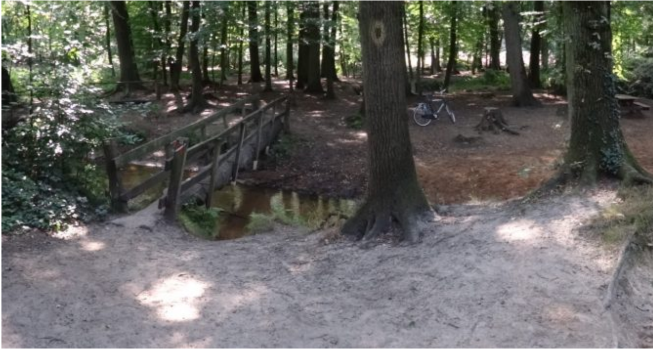
Mooi meanderend beekje