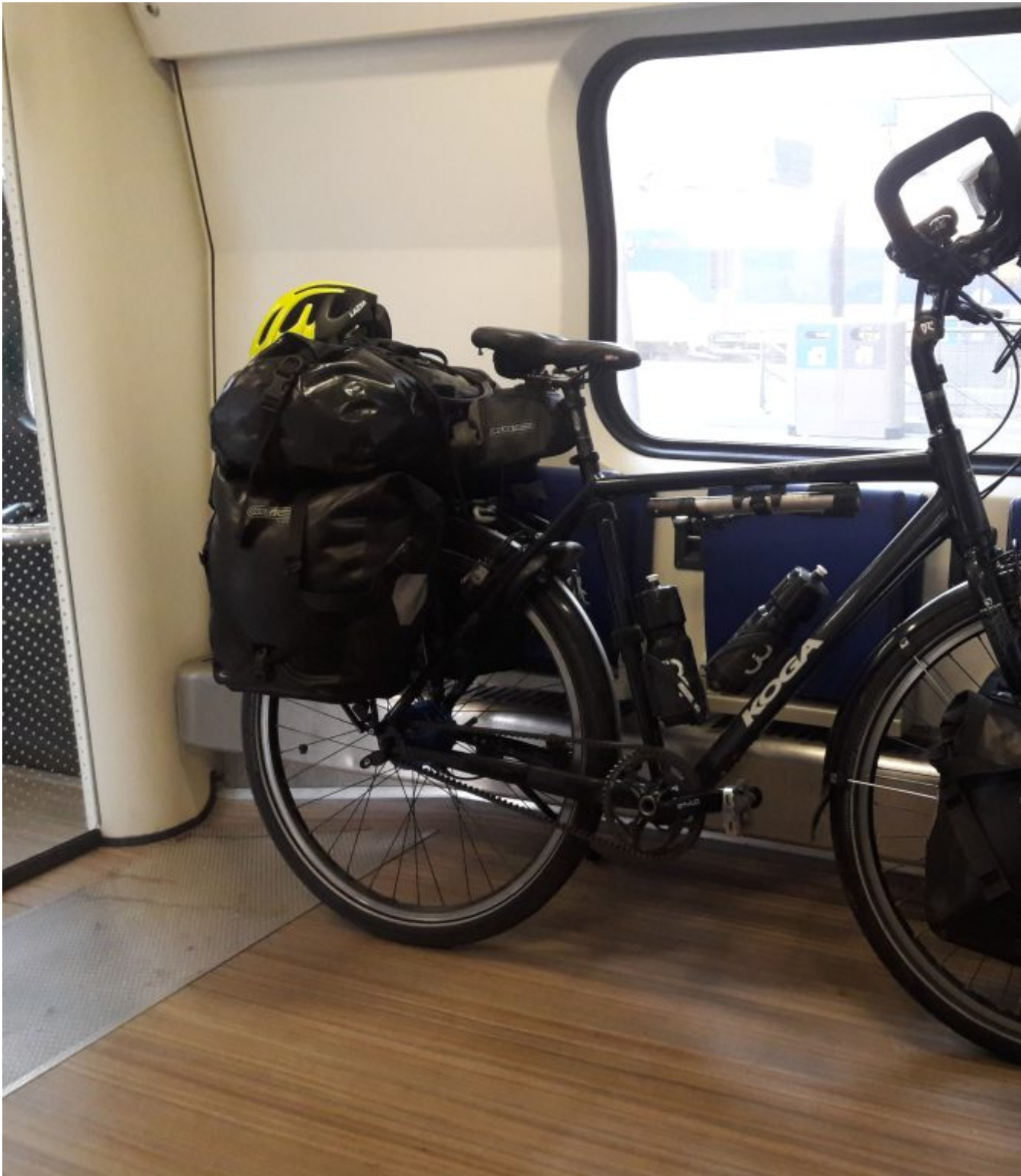
Eindelijk een goede trein