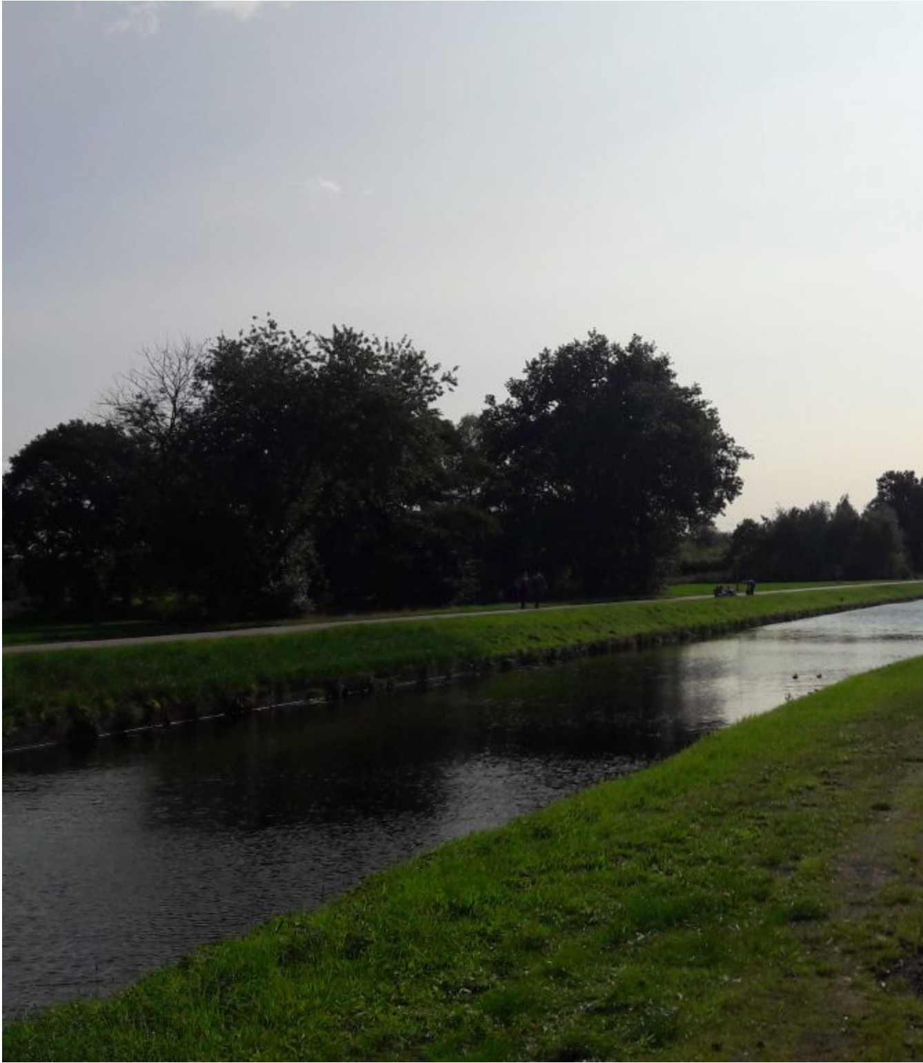
Verl. Hoogeveense Vaart