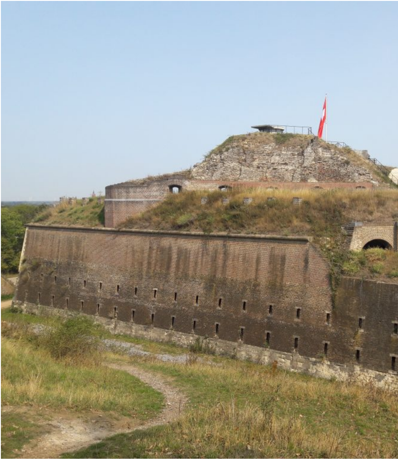
Fort St. Pieter