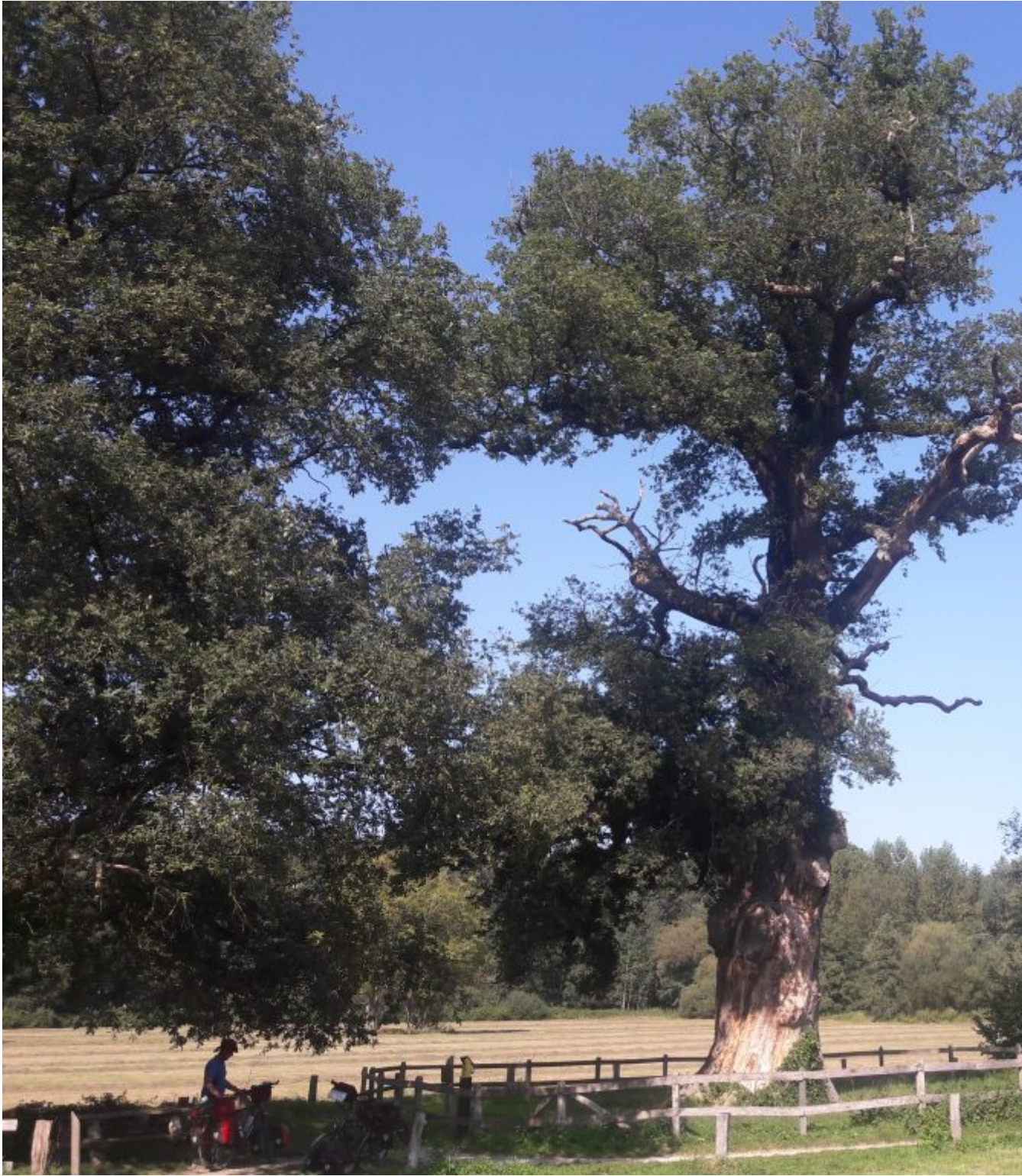
de Dikke boom