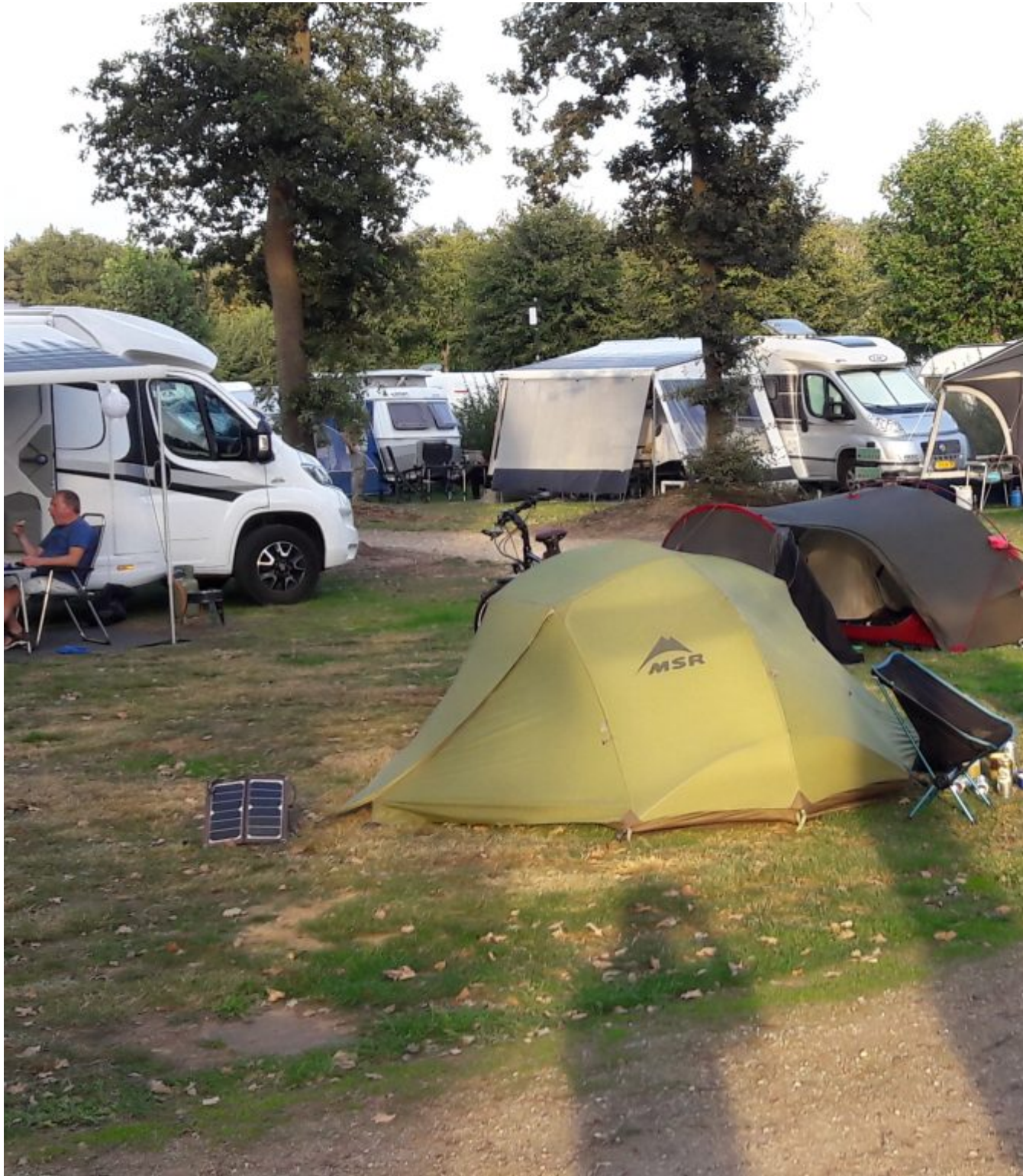
Camping Natuurplezier in Reuver