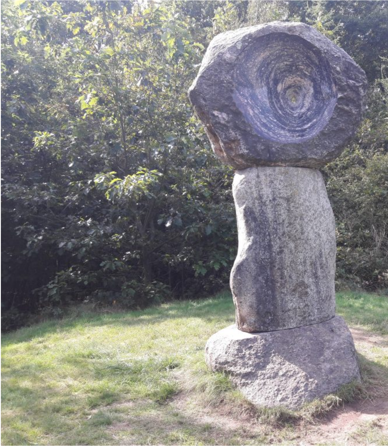
Blick in den Stein