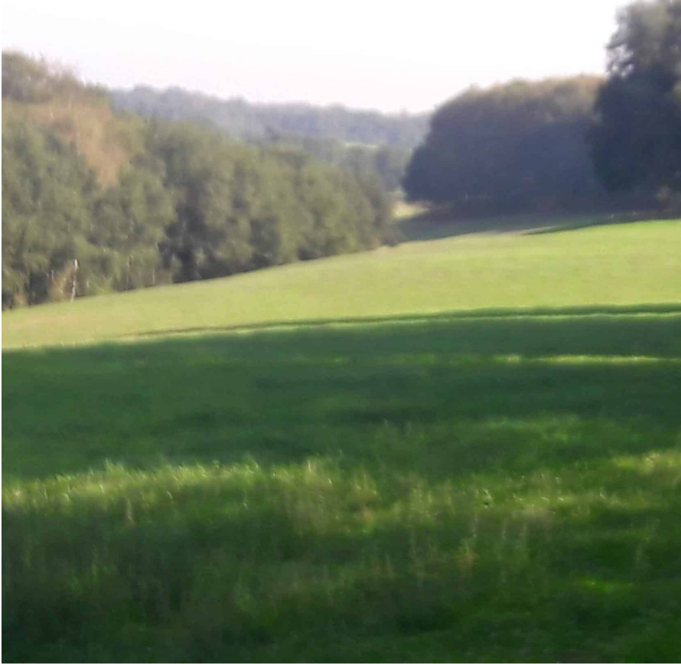
Op het Pieterwandelpad