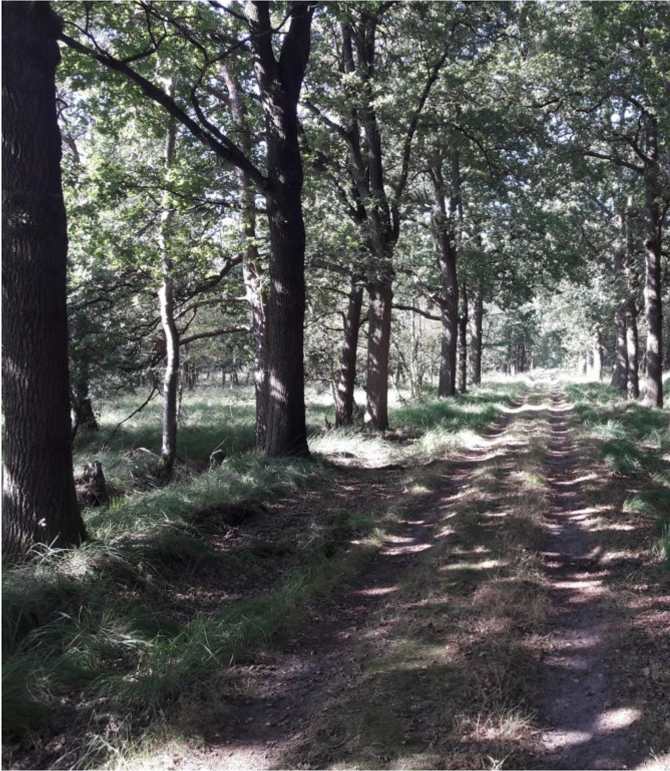
De gps stuurt ons over zandpaden