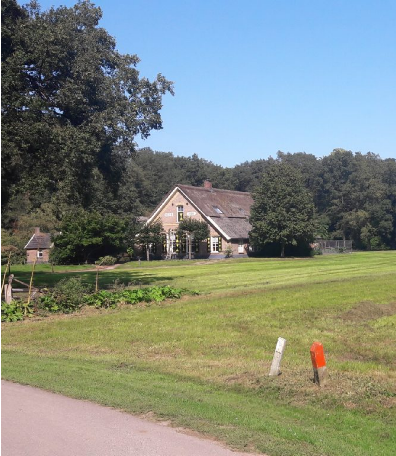
Authentieke boerderij met hooiberg