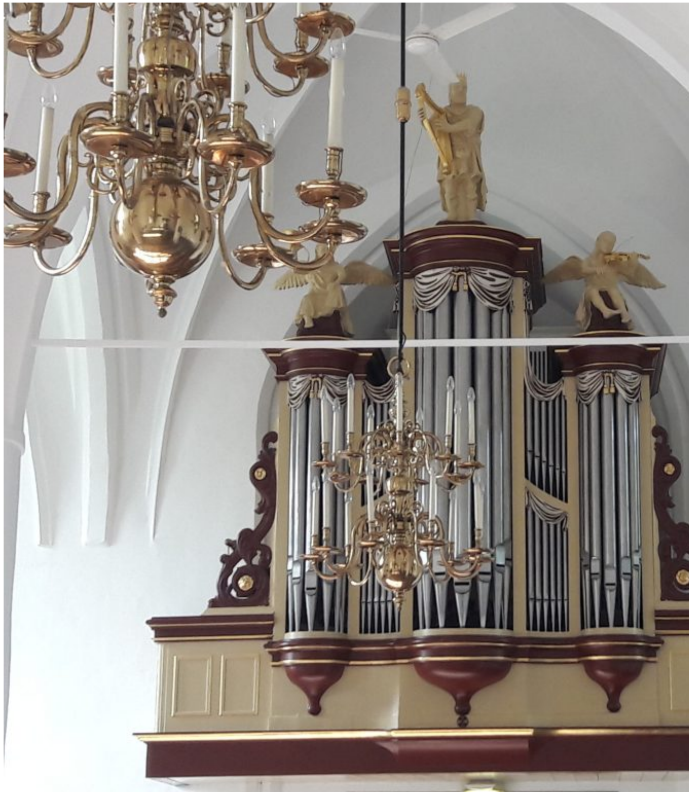
15e eeuwse kerk Sleen