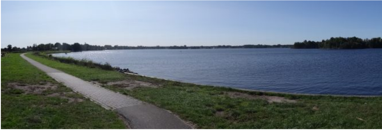
Paterswoldersmeer en Hoornsemeer