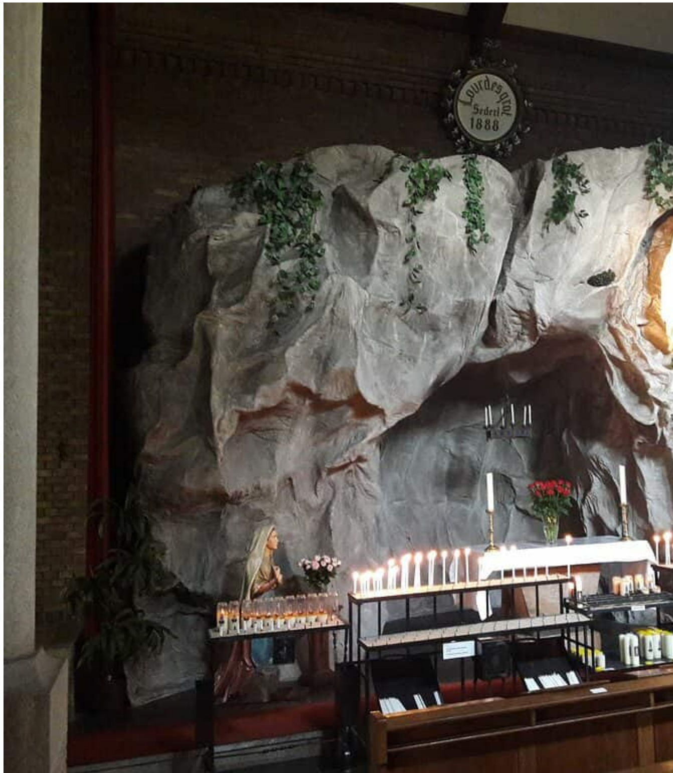
Troosteres der Bedrukten