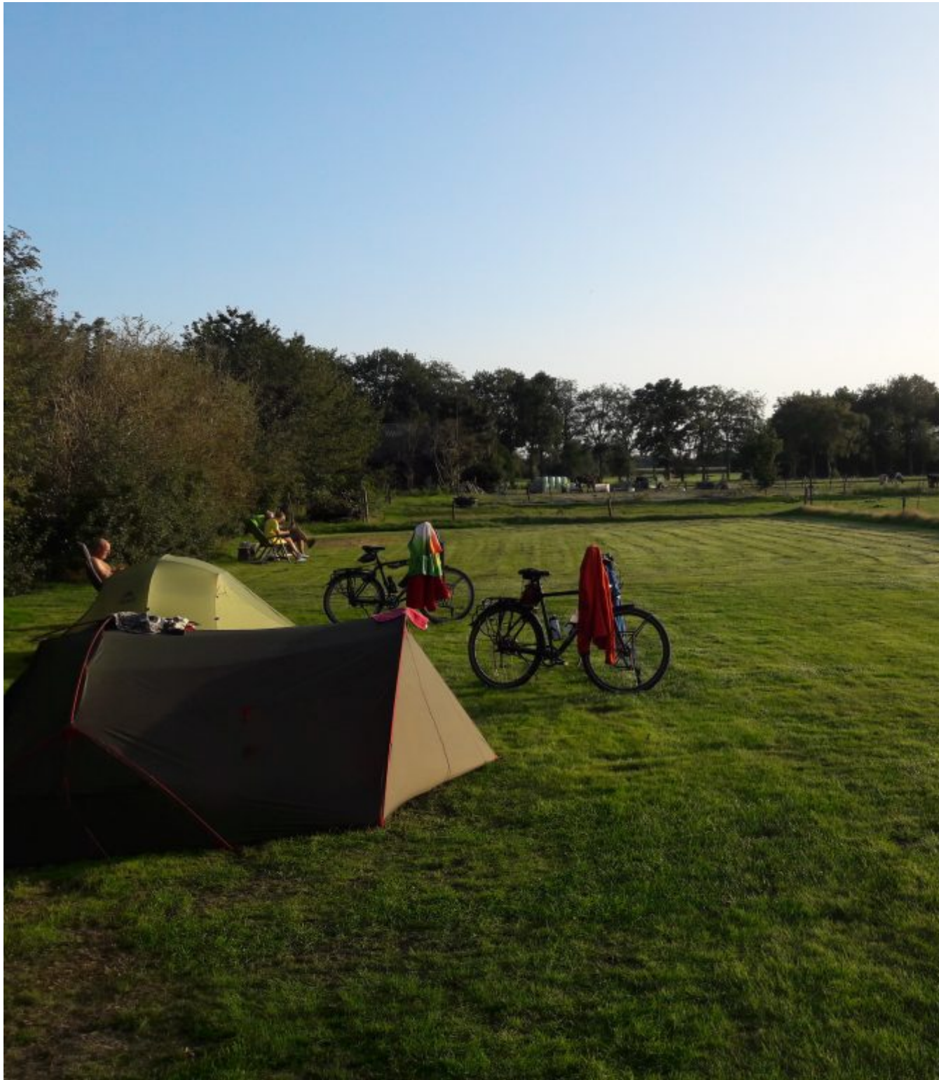
Camping de Olde Diever