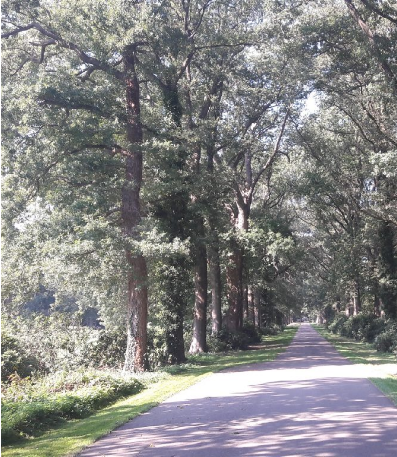
Nog een bomenlaan