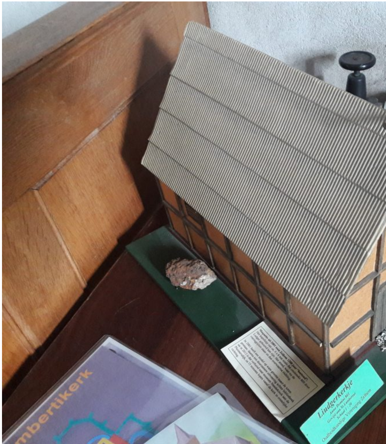
Replica eerste kapel