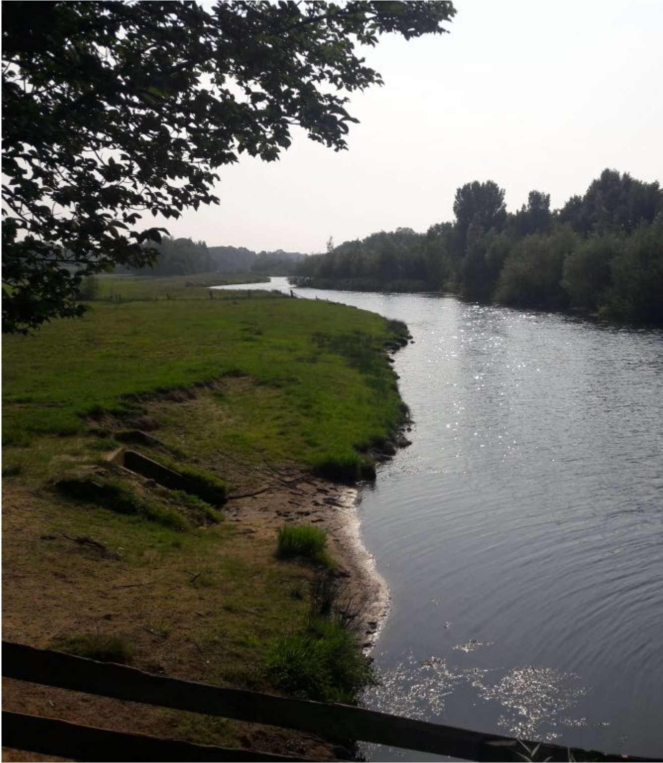
Rivier de Junne