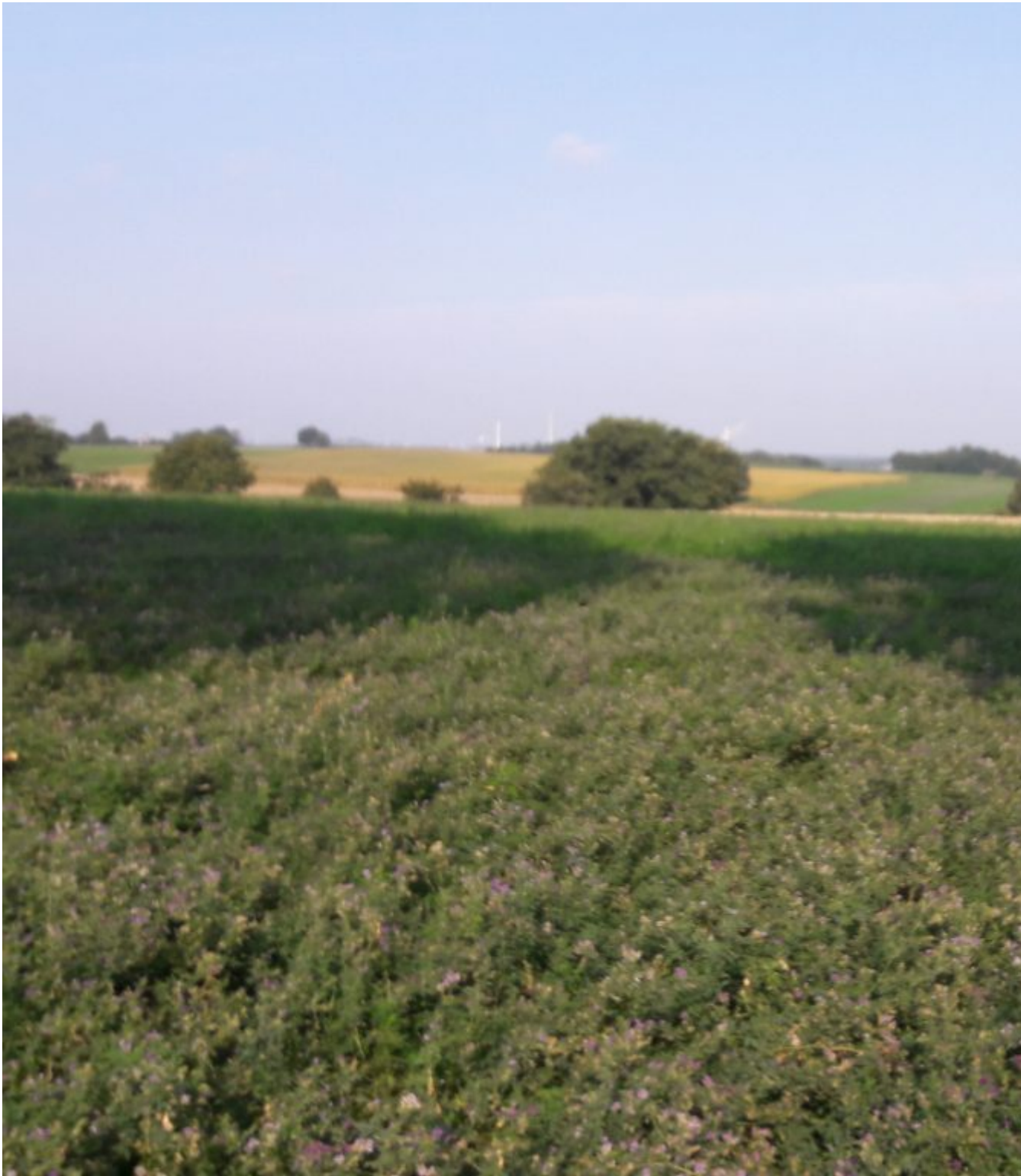
De laatste glooiende heuvels